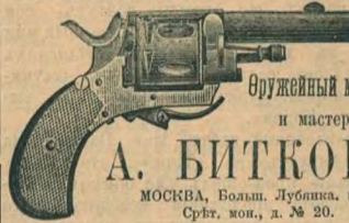
Оружейный магазинъ и мастерская

симъ объявляетъ, что срочные почтово-пассажирскіе пароходы совершаютъ рейсы по озеру Байкалу между желѣзнодорожными пристанями въ Баранчукѣ и Мысовой въ дни прихода поѣздовъ по вторникамъ, четвергамъ и субботамъ. Билеты продаются на пристаняхъ Баранчукѣ и Мысовой. Тарифъ значительно уменьшенъ.