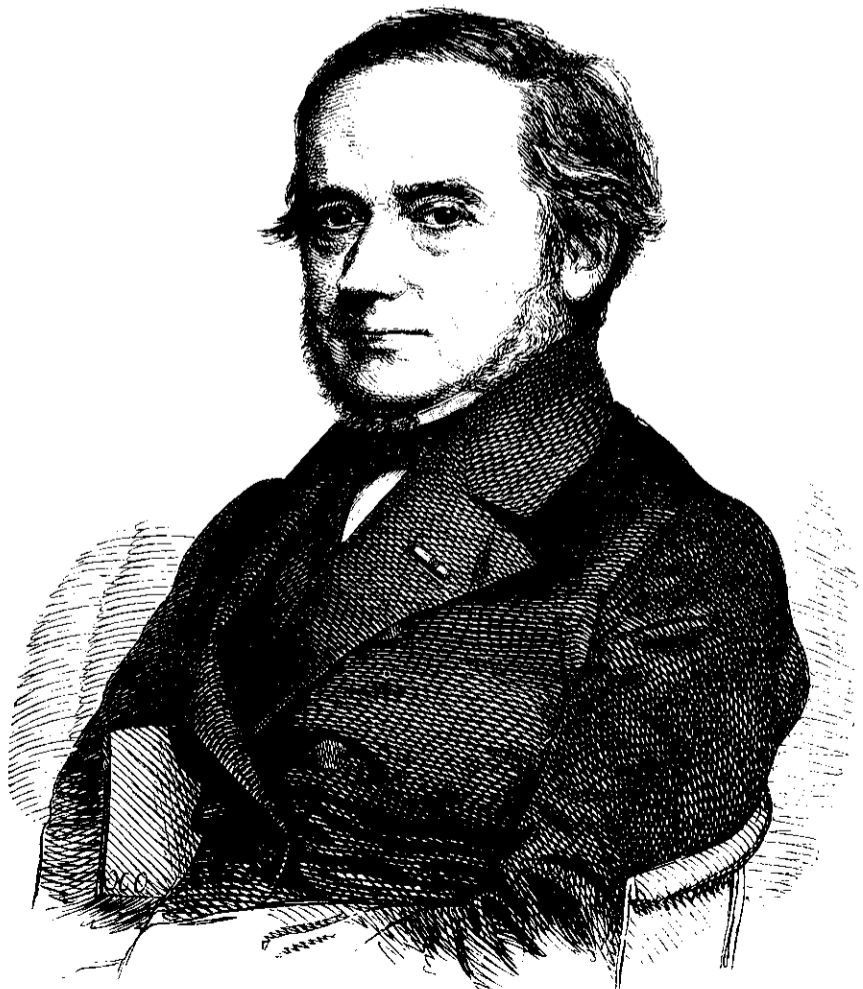
Hans Lassen Martensen.

I Aaret 1838 erholdt Martensen Ansættelse som Lector i Theologien, og det overdroges ham efter Professor Poul Møllers Død at holde Forelæsninger til 2den Examen over Moralphilosophien. I 1840 blev han extraordinair Professor. Universitetet aabnede Martensen en ny og kjær Virksomhed, og han kastede sig over den med Iver, Kjærlighed og den Lykke, som under Guds Bistand altid følger Dydighed, Talentet og den rene Villie. — I Aarene fra 1838—45, da han tilføjede blev Hofprædikant, levede Martensen saa at sige for Universitetet og har i denne Stilling udøvet en gennemgribende Indflydelse paa det theologiske Studium. Hans paa eengang grundige og klare, aandrige og vækkende, dybsindige kristelige Foredrag samlede en overordentlig talrig Kreds af yngre og ældre Tilhørere, og gjennem en Række af Forberedelser og Forarbejder stred han consequent frem til sit Systems Afslutning, der betegnes ved Dogmatikens Udgivelse.