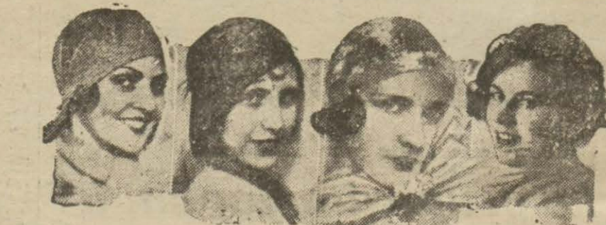
Belçika, Romanya, Cezair, Yunanistan güzelleri