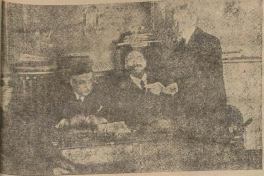
Gayri mübadillere tevziat yapılırken