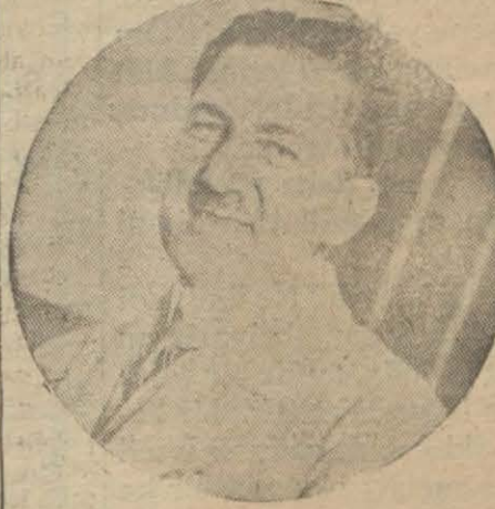
Selim Sırrı Bey

Dün erkek muallim mektebinde beden terbiyesi umumî müfettişi Selim Sırrı B. tarafından "Ne yemeli ve nasıl yemeli" mevzulu bir konferans verilmiştir. Musahebe çok müfit olmuş ve müteaddit defalar alkışlanmıştır. Selim Sırrı B. hasbihalinde muhtelif milletlerin yemek tarzına işaret ve bizim itiyatlarımızla mukayese etmiştir. Bu mukayeseye göre Avrupa hükümetlerinin kısmi azamında dört öğün yemek yemektedir. Selim Sırrı B. her memlekette olduğu gibi bizi de 3 tabakaya ayırıyor: