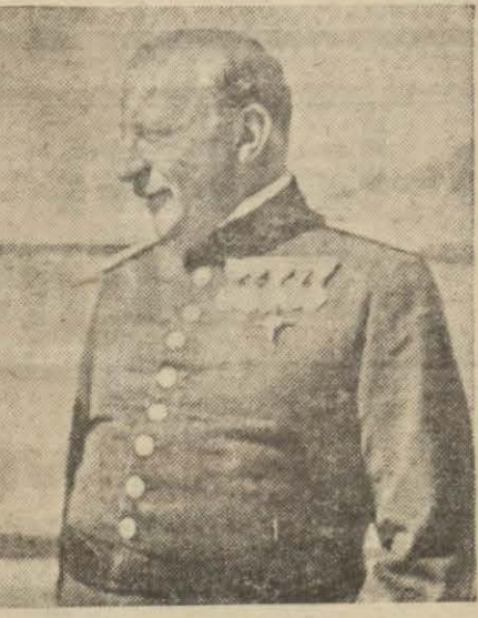
İspanya kralı Primo dö Rivera nı zırlarla konuşuyor..

Yeni başvekilin vazifesi müş- kîl olacaktır. Çünkü memleket te hali tabiiye avdet için çalı- şmağa mecbur olacak.