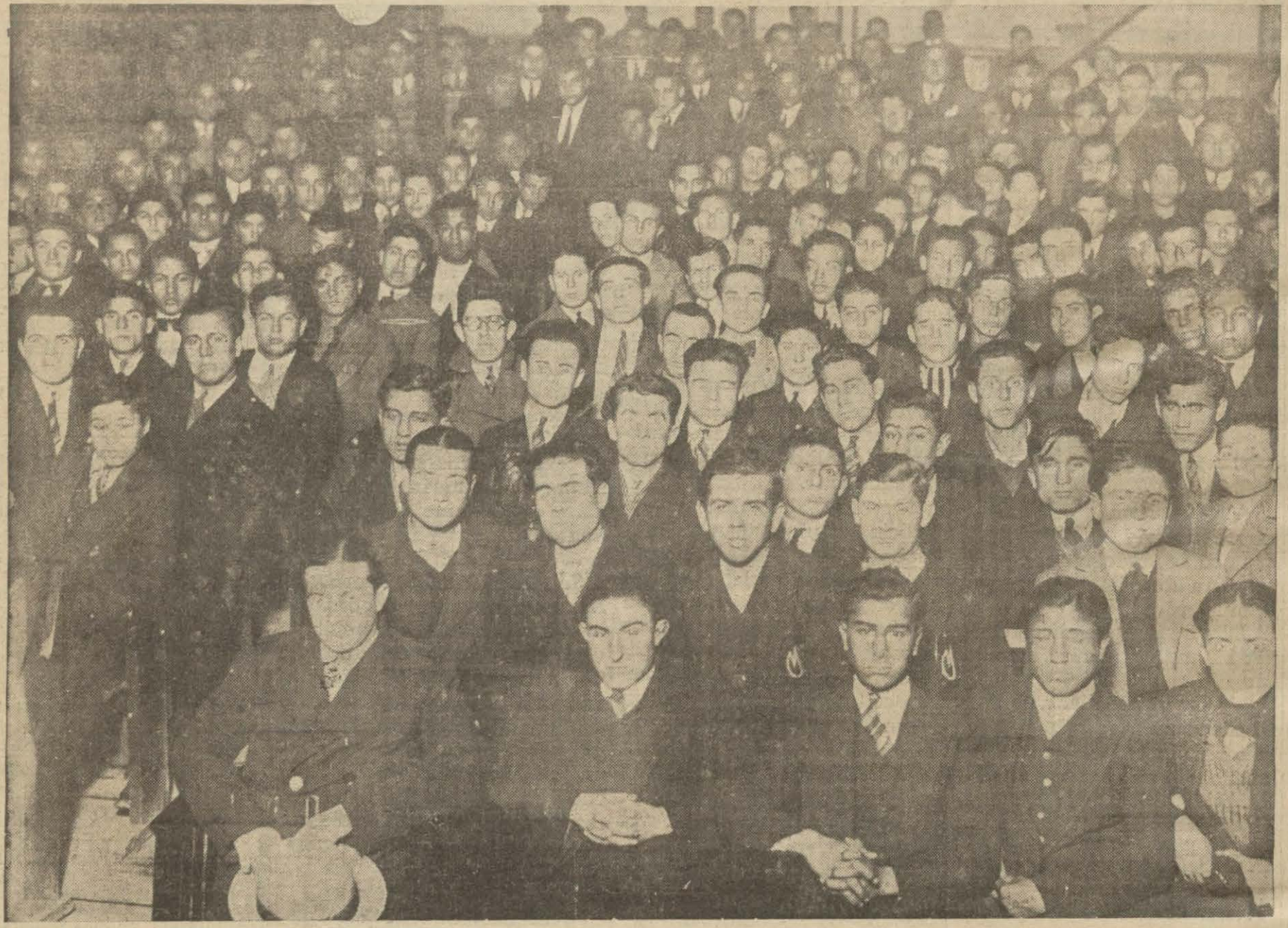
Dü Erkek muallim mektebinde ucuz yemekler hakkında bir konferans verilmiştir. Resim kenferansı dinleyen talebeyi göstermektedir

Her vatandaş şehrin temizliği için elinden geldiği kadar çalıştığı gibi Beledie nizamlarına riayet ve sırasında Belediyeye yardım etmek vazifesi de mükellef olduğunu unutmamalıdır.