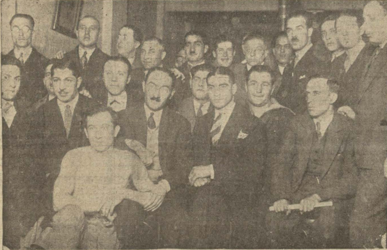
Galatasaray terbiyel bedenlye kulübünde bir çay ziyafeti verildi. Bu toplanmada boksun memlekette taammümü için icap eden esaslar görüldü.