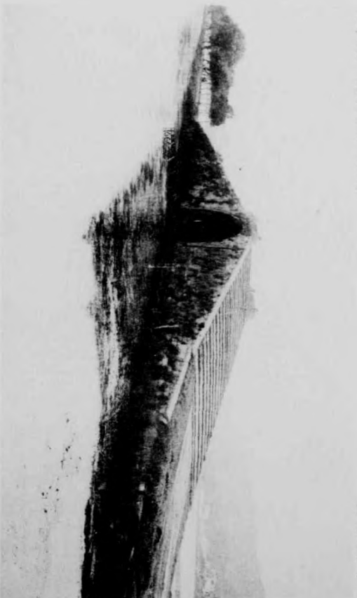
間之湖後前於介 橋一第之陸沙白爲