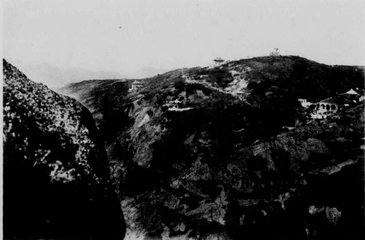
論葛望內洞石蟻蝦山(三)