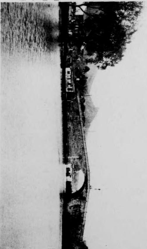
(西) 湖三 湖三