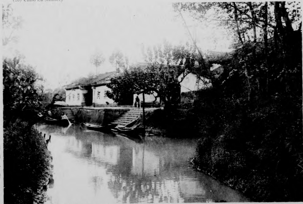
庵虛交豁西(六十二)