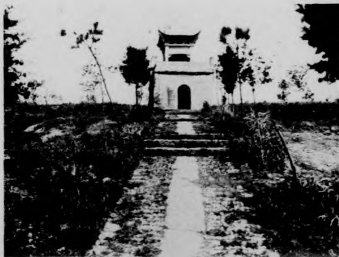
(5) "Sunrise" Platform