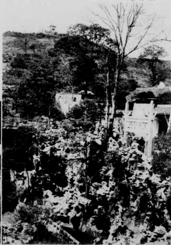
嶺 巔 (四)