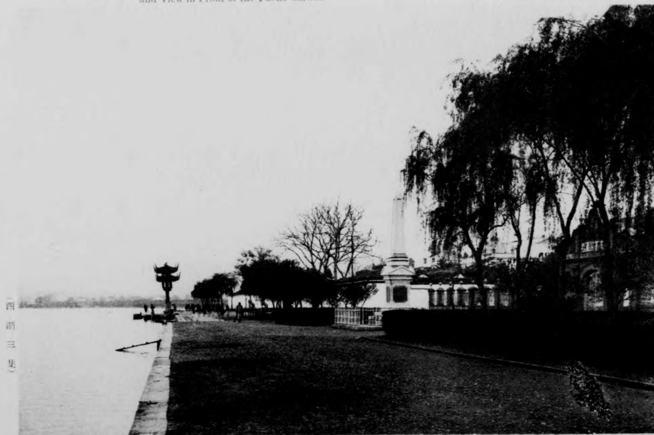
景外園公及祠烈忠(九)