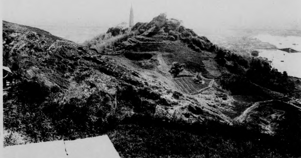
山石寶望臺陽初(六)