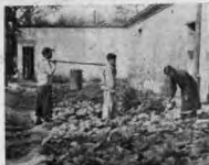
· 菜 澆 ·