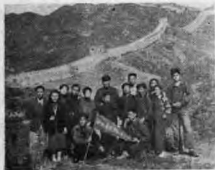
· 行 旅 城 長 ·