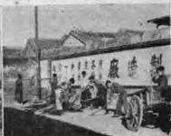
· 路 修 ·