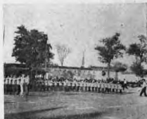
· 操 體 團 ·