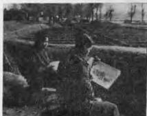
· 生 寫 外 校 ·