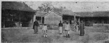
(攝思承王)形原舍校之年八二九一