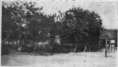
形情舍校之年九四九一