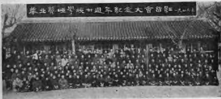
本校全體師生校友合影