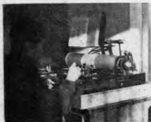
· 字 打 文 中 ·