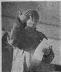
杜校長致詞時說本校開辦時僅有七名。