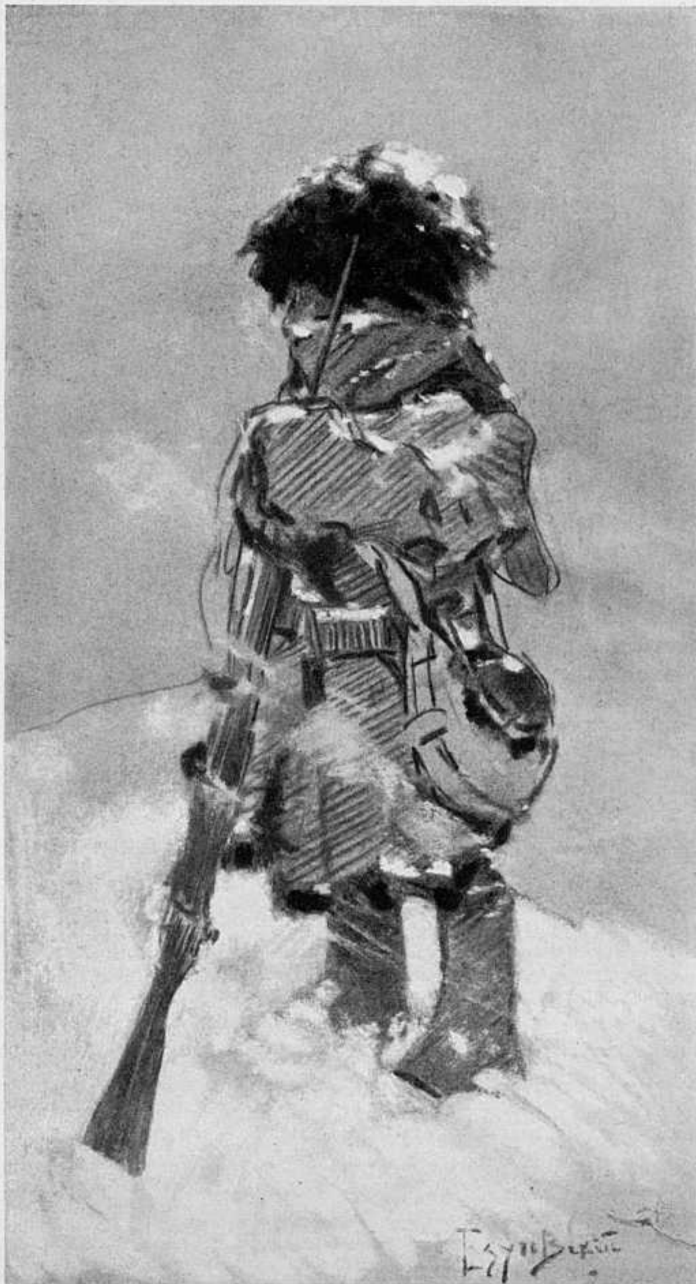
ЧАСОВОЙ. РИС. ХУД. М. ЕЗУЧЕВСКАГО. СОБСТВ. «ЛѢТОПИСИ».

Шумъ жизни настойчиво рвался туда, гдѣ уже завоевывала себѣ мѣсто смерть.