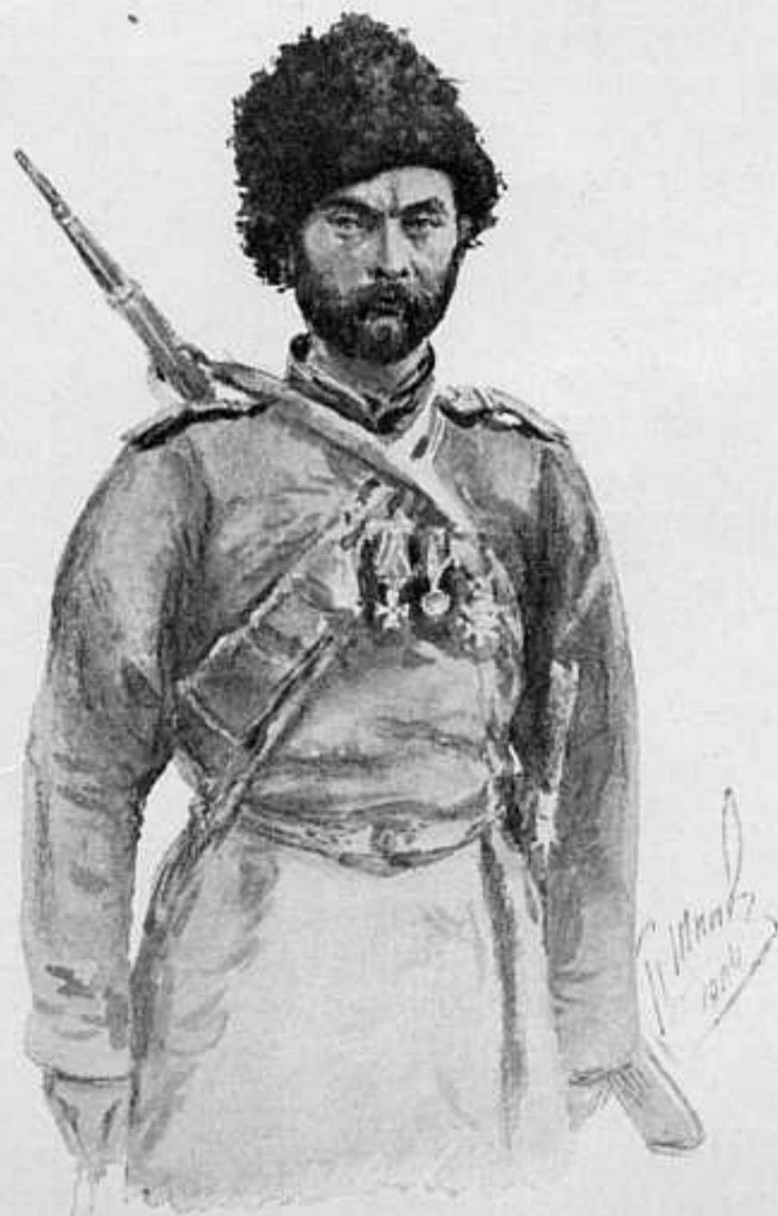
ПРИКАЗНЫЙ АГАПЪ ПЕРФИЛЬЕВЪ. Отличился во многихъ развѣздахъ и дѣяхъ.

Имѣя въ виду чрезвычайную энергію произведеннаго наступленія японцевъ, охватъ ихъ, направленный на оба нашихъ фланга и обнаруженное во многихъ мѣстахъ атаки превосходство въ силахъ, нѣкоторые предполагаютъ, что по числу японцы были значительно сильнѣе насъ, иначе они не посмѣли бы проявить такого рискованнаго обхода, долженствовавшаго въ концѣ концовъ кольцомъ охватить всѣ наши арміи, какъ то сдѣлали нѣмцы при Седанѣ въ 1870 г. Мнѣніе это, явившееся лишь послѣ отступленія нашихъ армій, т. е. подъ вліяніемъ успѣха, одержаннаго японцами, совершенно не согласовалось съ первоначальными данными о численности японскихъ силъ, сообщавшимися какъ нашими, такъ и иностранными обозрѣвателями войны. Оно противорѣчитъ и самому характеру дѣйствій нашего главнокомандующаго, проявленному въ данномъ случаѣ, — чрезвычайному упорству обороны, доведенной до крайняго предѣла. Ген.-ад. Куропаткинъ, положившій въ основаніе всѣхъ своихъ плановъ крайнюю осторожность и расчетливость, не рискнулъ бы и въ данномъ случаѣ, если бы не былъ убѣжденъ въ превосходствѣ или по крайней мѣрѣ въ равенствѣ своихъ силъ съ силами противника. Такимъ образомъ, если таковое превосходство и оказалось, то во всякомъ случаѣ это выяснилось только