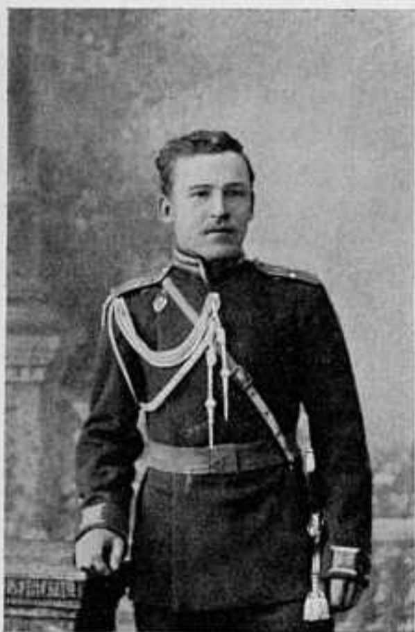
12-го сиб. барнаульск. пѣх. полка подпор. П. В. НОВГОРОДЦЕВЪ. Убитъ 29 сентября 1904 г. у дер. Хамытунь.