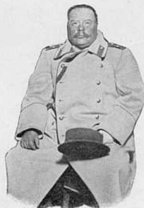
КОМАНД. 10-ГО АРМ. КОРПУСА ГЕН.-ЛЕЙТ. ЦЕРПИЦКІЙ.

Благодаря чрезвычайнымъ усиліямъ частей 2-й арміи въ районѣ ст. Усытхай, опасность окруженія была устранена, и войска наши уже къ утру 25-го февраля вышли изъ тяжелаго положенія. Въ этотъ день, противникъ хотя и обстрѣливалъ Мандаринскую дорогу и съ запада и съ востока, у Усытхай и Пухе, — тѣмъ не менѣе не могъ овладѣть ею. Въ этотъ тяжелый день многія части войскъ вели себя самоотверженно, и въ данное время можно надѣяться, что кризисъ миновалъ и русская армія сохранила свою силу, хотя и понесла большія потери въ людяхъ и матеріальной части. Ген.-ад.