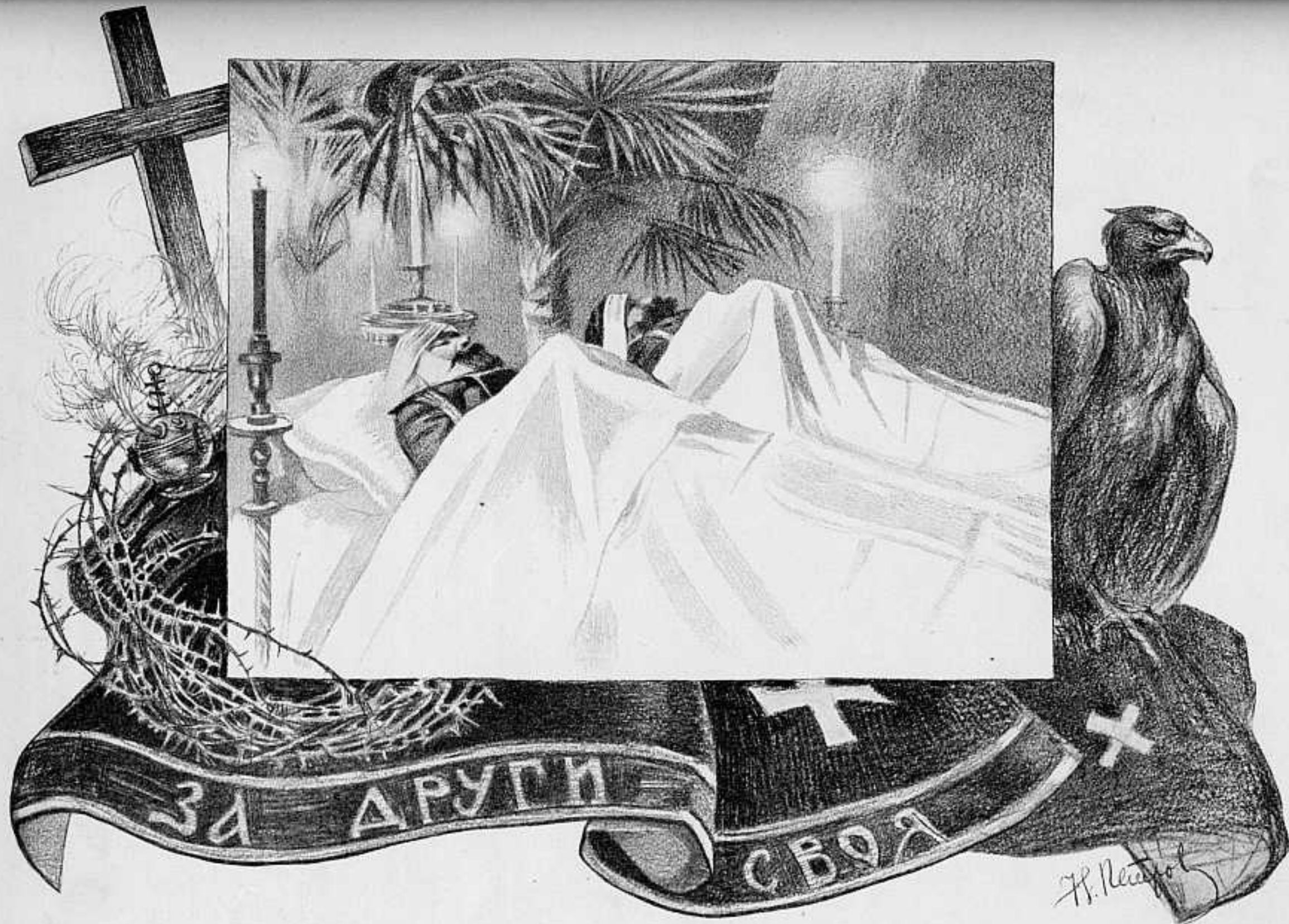
СМЕРТЬ ДВУХЪ ГЕРОЕВЪ: ГЕНЕР. КОНДРАТЕНКО И ПОЛКОВН. НАУМЕНКО. УБИТЫ ОДНОВРЕМЕННО НА ФОРТЪ КИКУШАНЪ, ТѢЛА ИХЪ ДО ПОГРЕБЕНІЯ НАХОДИЛИСЬ ВЪ ЧАСОВНѢ.

РИС. ХУД. Н. ПЕТРОВА. СОБСТВ. «ЛЪТОПИСИ».