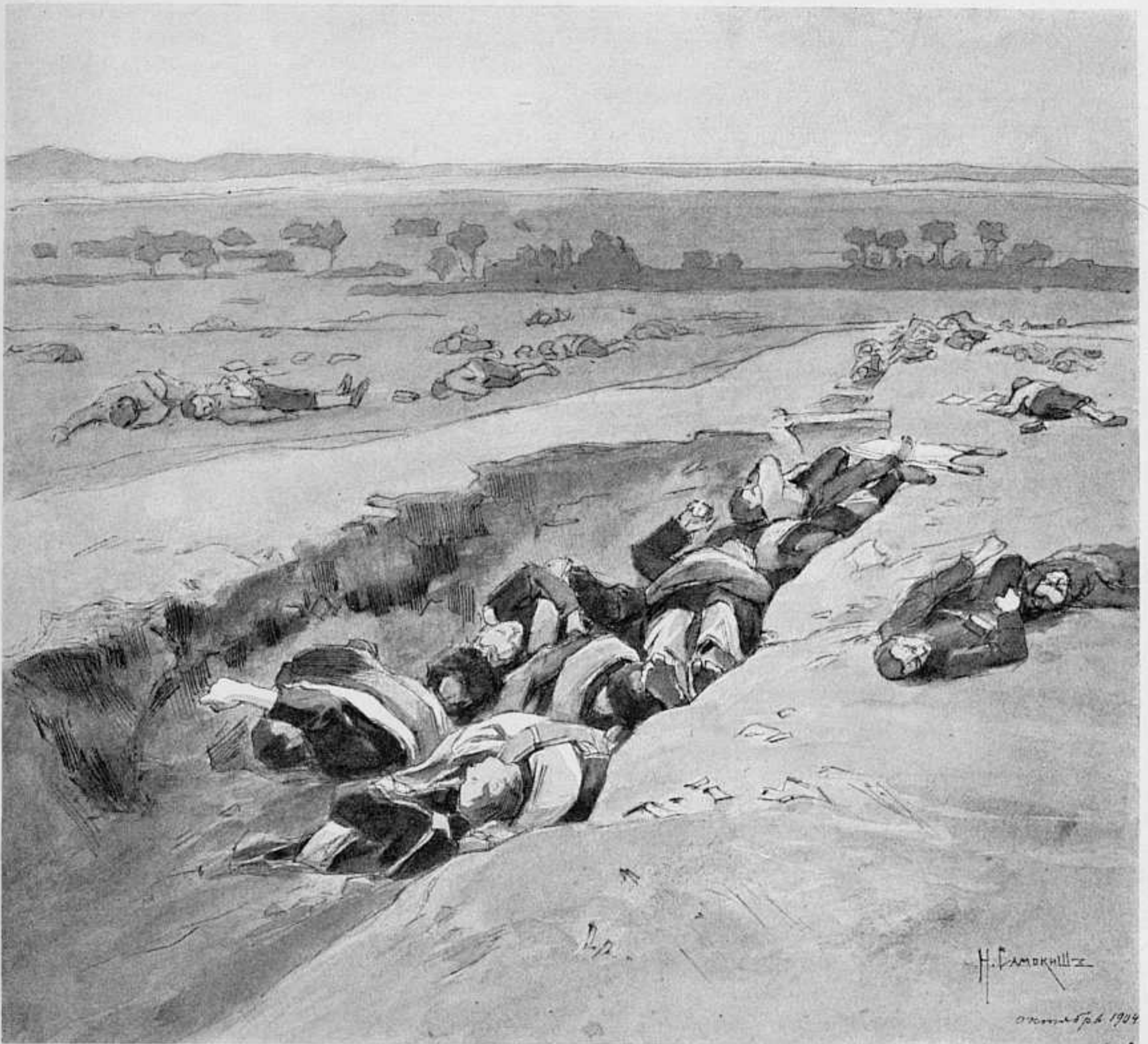
ПУТИЛОВСКАЯ СОПКА. РИС. АКАДЕМИКА Н. САМОКИША СЪ ТЕАТРА ВОЙНЫ.