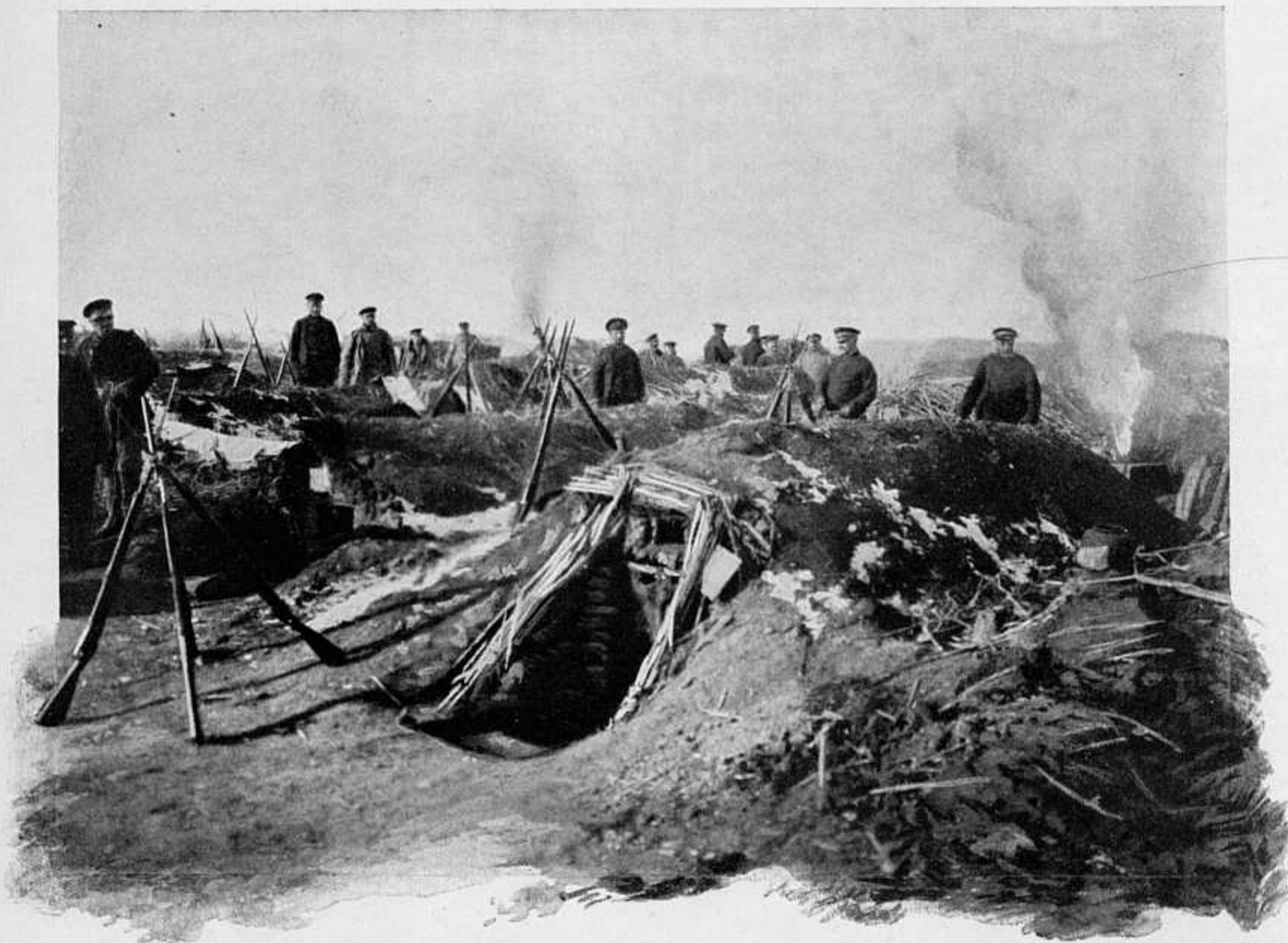
ПЛАТО НОВГОРОДСКОЙ СОПКИ. ЗЕМЛЯНКИ ВОЙСКЪ.

нерами и военнымъ вѣдомствомъ, она дала возможность не только заложить громадную базу для армій, но и не допустить никакой перегрузки, затирки и загрузки вагонами и паровозами Харбина. Особенно выдѣляется сортировочная станція, гдѣ легко, свободно и быстро, благодаря обилію путей, распредѣляются всѣ поѣзда и всѣ вагоны. Здѣсь разбираютъ и больныхъ и раненыхъ, прибывающихъ съ санитарными поѣздами.