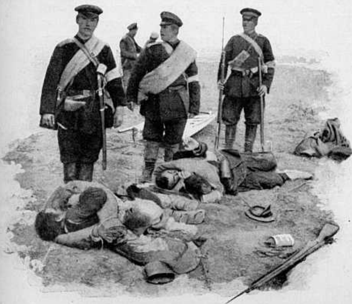
У ПОДНОЖІЯ НОВГОРОДСКОЙ СОПКИ УТРОМЪ 4 ОКТЯБРЯ 1904 Г.

Вскорѣ обнаруженное здѣсь превосходство силъ противника, заставило только что прибывшаго сюда и принявшаго командованіе ген. барона Каульбарса отвести войска 16 корпуса назадъ, ближе къ Мукдену. Для парированія обнаруженнаго обхода, угрожавшаго не только захвату пути нашего отступленія отъ Мукдена, но и тылу 2-й арміи, эту послѣднюю пришлось также отвести назадъ, на линіи Мадяпу-Янсинтунь. Наша 2-я армія отходила назадъ подъ давленіемъ перешедшей 18 февраля въ наступленіе арміи Оку. Послѣ кровопролитнаго боя 18 и 19 февраля, важный пунктъ на р. Хунхе—д. Сухадепу окончательно остается въ рукахъ японцевъ, и тѣмъ устанавливается связь между арміей Оку и арміей Ноги. Съ 19 по 21 февраля дѣйствія на нашемъ правомъ флангѣ были вполне успѣшны; сосредоточивъ свои резервы и 2-ю армію противъ Оку и Ноги, мы отра-