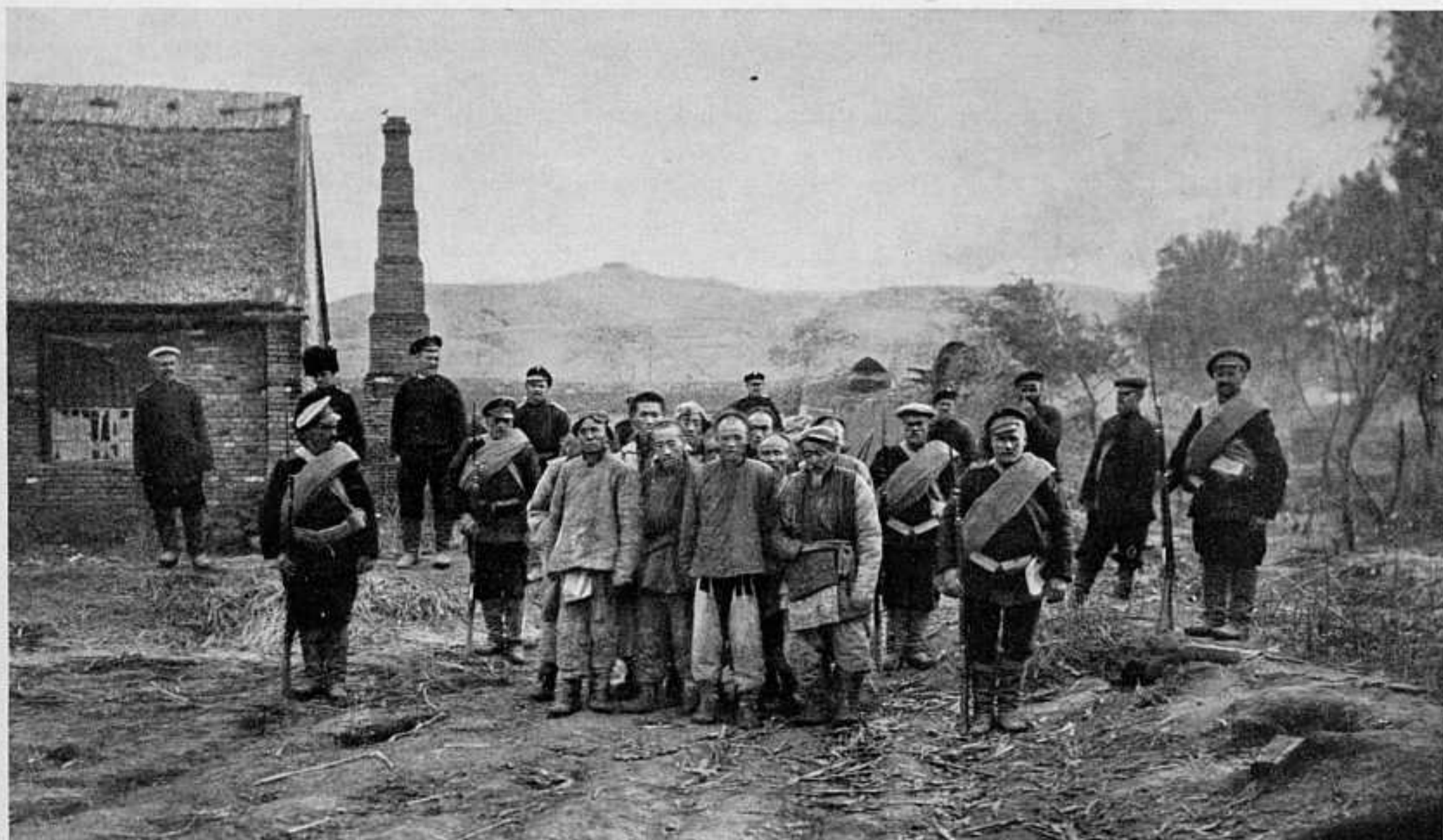
КИТАЙЦЫ - СИГНАЛЬЩИКИ, ПОЙМАННЫЕ ВО ВРЕМЯ БОЯ ВЪ ДЕР. ХУАНЬШАНЬ.