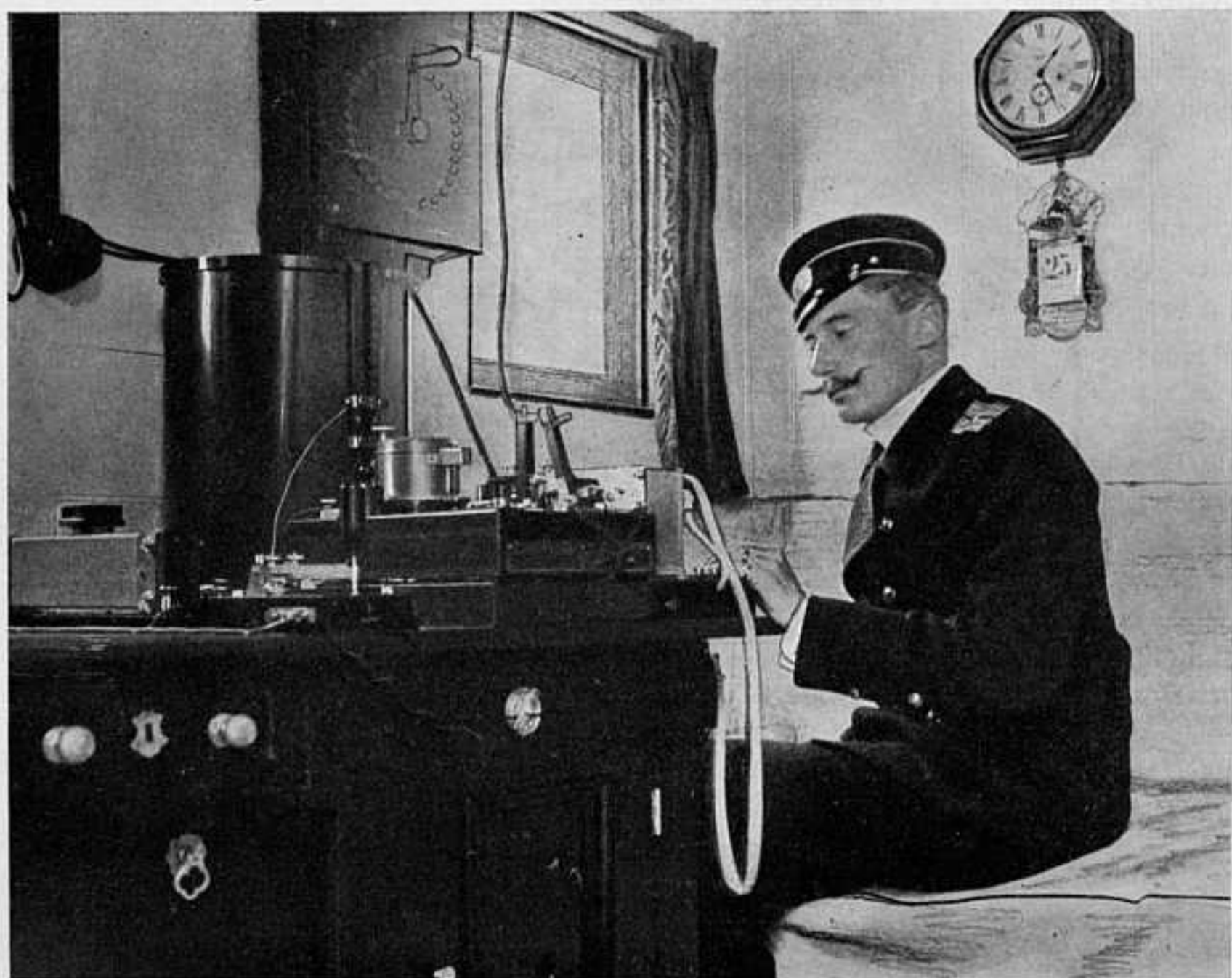
ПРИЕМЪ РАДИОГРАММЫ НА СТАНЦИИ БЕЗПРОВОЛОЧНАГО ТЕЛЕГРАФА НАШЕГО КРЕЙСЕРА.

Степень пораженія, понесеннаго нашими арміями, за недостаткомъ полученныхъ свѣдѣній и дошедшихъ пока съ театра войны вѣстей, въ настоящее время еще не опредѣлилась, но, во всякомъ случаѣ, неудачу