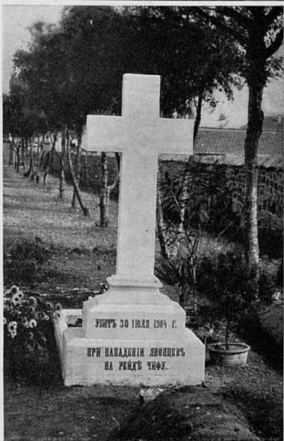
ЧИФУ. МОГИЛА Д. М. ВОЛОВИЧА, УБИТАГО ЯПОНЦАМИ ВЪ ЧИФУ ПРИ НАПАДЕНІИ ИХЪ НА ЭСКАДРЕННЫЙ МИНОНОСЕЦЪ «РѢШИТЕЛЬНЫЙ».