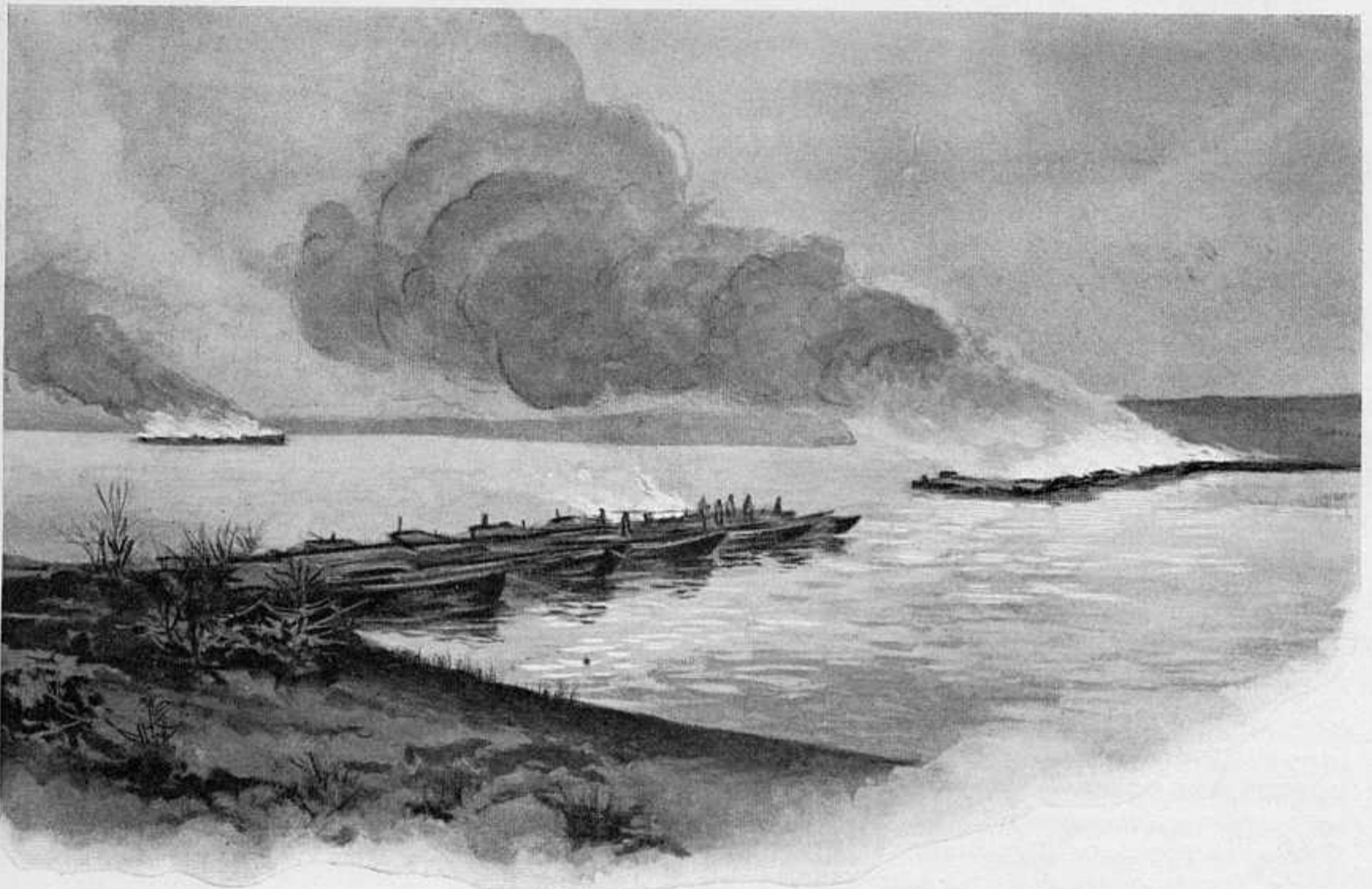
МОМЕНТЪ СОЖЖЕНІЯ МОСТА НА ЛЯОХЕ ВО ВРЕМЯ ОТСТУПЛЕНІЯ ОТЪ ДЕРЕВНИ ДАВАНЪ. ПО ФОТ. РИС. ХУД. А. ЛЕО.

изводится противъ нашего праваго фланга, почему 1 Сибирскій корпусъ былъ немедленно перетянутъ на нашъ правый флангъ. Такимъ образомъ, 1 Сибирскій корпусъ, одинъ изъ лучшихъ нашихъ корпусовъ, въ