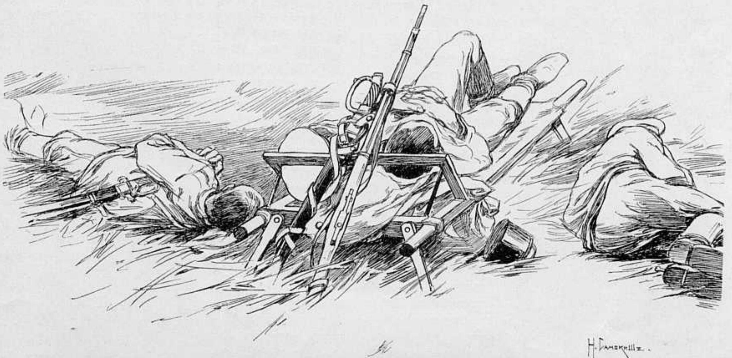
РИСУНОКЪ АКАДЕМИКА Н. САМОКИША СЪ ТЕАТРА ВОЙНЫ.