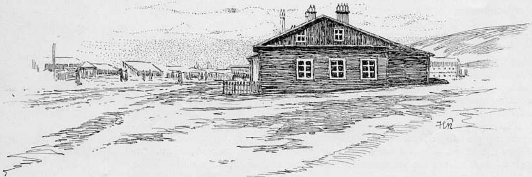
ПОРТЬ-АРТУРЪ. ДОМЪ ВЪ КОТОРОМЪ ЖИЛЪ ГЕНЕРАЛЬ КОНДРАТЕНКО.

Куропаткинъ опредѣляетъ число раненыхъ нашихъ въ 50 тыс. человѣкъ. Въ токійскихъ телеграммахъ показываютъ до 20 тыс. плѣнныхъ, взятыхъ японцами. Надо думать, что въ этомъ числѣ заключаются именно раненые, оставленные на полѣ сраженія въ Мукденѣ, отставшіе и ослабѣвшіе.