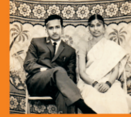
बापू व पद्मजा