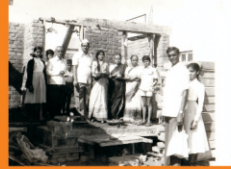
घर बांधकामावेळीचे क्षणचित्र