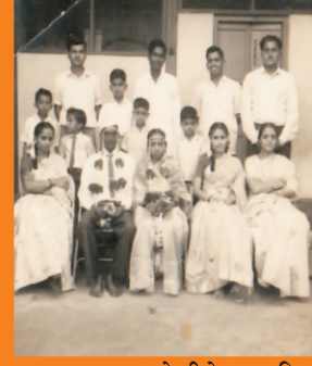
आमच्या लग्नावेळीचे छायाचित्र