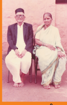
अण्णा व मामी