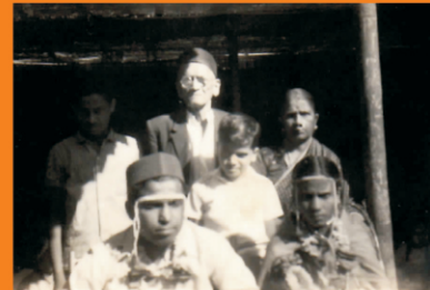
मागे अण्णा व मामी लिलाच्या लग्नामध्ये