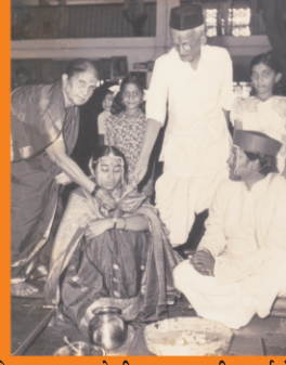
विजयच्या लग्नावेळी अण्णा, मामी, वर्षा, मेघा