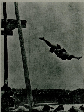
غريده ادمان : پورتوتده آما تورك بوكس بر بردن دكره آتلايشلري

بو مهم مسابقيه « بارباروس خبرالدين » زرهليسيه آمريقا سفارتي معيته مأمور « سقوربيون » ياطي افراي آراسندن اتخاب ايديش اونر كشيكل ايكي طاقم آراسنده اجرا ايديلدی . بزجه ، اك زياده تديقه ، تنقيده باشلامان بر خيلي زمان اول طرفين قاييدانلاري آراسنده مسابقيه