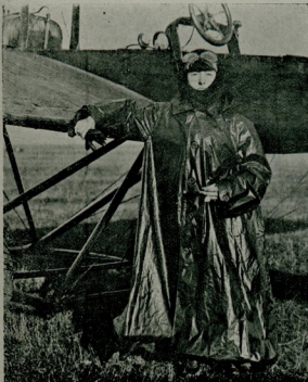
بلىقس خاتم طيارە نك اوكندە

بووچەلە اويونك برنجى قىسمى ختام بولدى برمدت استراحتدن سوگرە ايگىجى قىسم باشلادى حىسونون بىكل و بردىجى كوزل بر پاس ساپەسندە نشئت بك مكمىل برغول ياپدى . بوندىن سكرماويون