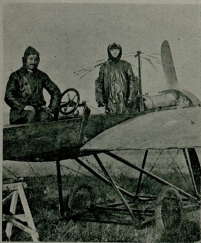
بلقیس خانم نطق ایراد ایدر ایکن

بارباروس طاقنک قایدانی ایلك چیکشده کی موفقیت ایله ایکنجیده کی سریع مغلوبیتی نظر دفته آلاق آمریقالیلرک چورابلری چیقارمیلری بر دفعه داهایا تکلیف ایتدیهده یینه قبول ایدیلیدی ،