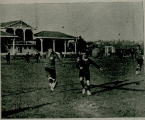
جمه ایی فوت بول رسملردن : آناطولی و دارالفنون فوولبری

آ کلاشیلوردی . بارباروس طاقنك قابدانی قاتلر آراسنده توازن اولوب اولمادینی آ کلاشیلوق ایچون هرایی طاقم افرادیئده طارنیلماسی ایجاب ایتدیکنی ایلهری سوریلوردی . بوتکلیفی سقوریون طاقنك قابدانی قطعاً قبول ایتمه یور و بلماقابه کندی طاقنك افرادی سسکسان کشیک محدود برکنله دن سجمش اولدیغنی، بناء علیه شرائط مسابقه نك قبولنده کندیسنه حق ترجیح و بریک لازمکه چکنی درمیان ایدیوردی . بز هرایی طرفی ده اساس اعتباریله کندی نقطه نظرلرنده حقی بولویورسه قده ظاهر حال بز میکیلره مع التأسف حق و بردره میور . بز قطعاً قانغز که بز میکیلر زومسز بردوشونجه نك داها تورکجه سی موقفسز برعلو جنابك قربانی اولدیلر . اونار دوشوندیله که سقوریونك افرادی محدود، بناء علیه سسجه ملری داها زیاده محدود اولاجق . اکر کندیلری طاقارینی لزومندن زیاده آغیر ، اوقولی افراد ایله دولدوره حق اولسه لر - که بوتون دونانما آراسنده (۱۰۰) کیلوبی متجاوز نقلته مالک البته اون اون برکنشی واردر صانیر بز - ظاهرده اولدجه چیرکین کورونه جک ایشته بولوزومسز دوشونجه به برده نقلتک توازی مسئله سی انضمام ایدنجه هبسی تقریباً عینی چایده اوتوز قدر افراد انتخاب ایدره ک (رینغه) کتیرمشار .