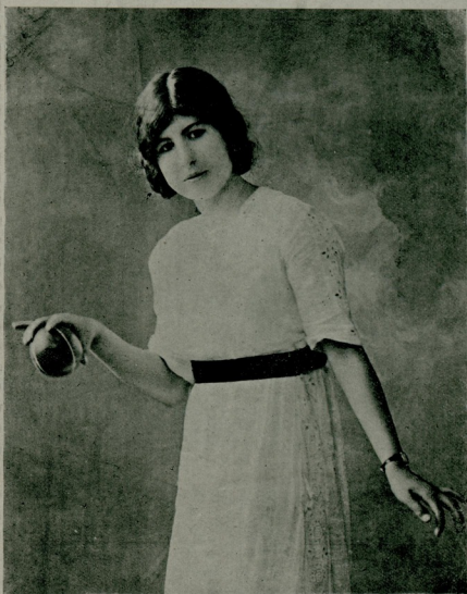
اسکیتینگ ادمان مسابقه لنده : فادینلر آراسنده کی ظرافت و پائینازده رأی قازانان مادموارل قاتیلا

ونهایت اقلامک ودواثر رسمیه نك اقسام اوزری سپور ادمانلرله مشغول اوله جق درجه ده ایرکن برافلاماسی خصوصاتی تحت تأمینہ آلتورسه آتی سنه سوکره اشتراک بلکه ۱۴ سنه سوکره ده عثمانلی بپراغنی مسابقه دیره کنه چکدبرمک میسر اولور .