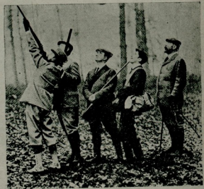
غریبه ادمان : انکاتر قرالی آوده

اوحد . قابلیت ملیه در . بو خلق اکر سپوری آکلار ، مراق ایدر ، چالیشیرسه فهنا . عکسی حالده هیچ برشی یابیلهماز . بناءً علیه ، هرشیدن اول خلفه سپور فکری ویرمک ، افکاری بوکا حاضرلا . دقدن صوکره ایشه باشلامق لازمدر . خلفه سپور فکری نصل ویرمک لازم کلدیکنی ، آیری برنسخه به براقه جغ چونکه بوراده مسئله هم اوزون سورده جک همده مقصدی غائب ایتمش اوله جغز .