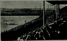
غریبه ادمان : انکاترده بر فوت بول مسابقه سنده ایوبون عملک رکوشه جکی ! . .

اولنیداده اجراسی ماجوظاولان انواع مسابقاتی برر برر ذکر ایوب بزده کی وضع حاضرینی ، آکا کورده تشکیلی لازمکن مؤسسات وتوسلی اقتضا ایدن تدابیری یازمجم : یالکز شوراسی اونوتولماسون که ؛ بوخصوصه کی مساعیمزک برحدی واردر .