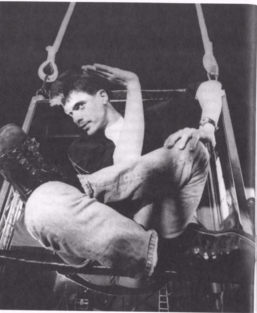
Philippe Decouflé