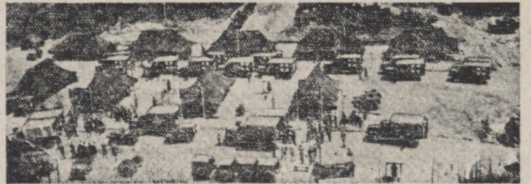
دهکده ای که اسیران ملل متحد و کویست ها در آنجا مبادله می شوند

پان مونجویم - غیر کراری فرانسه بقرار اظهار محافل ملل متحد در کره استحال دارد مبادله اسیران تا یک هفته دیگر با پایان یابد. اکنون فقط ۱۴۰۰ فراز اسیران ملل متحد در بازداشتگاه های کویست ها پس میگردند که باید بمقامات ملل متحد تحویل داده شوند از اسیران کویست ۲۲ هزار چینی و کره شمالی حاضر به بازگشت بوطن نمود نیستند و در دهکده ای که تماما با چادر های نظامی ساخته شده و در ۱۰ کیلومتری جنوب پان مونجویم قرارداد تکهارتی می شوند. ۵۰ نفر از نیروهای هندی که مأمور حفاظت این اسیران می باشند روز سه شنبه وارد کره شدند و قراردات چهار هزار نفر دیگر نیز در طرف ۱۵ روز آینده بکره بیابند. سربازان هندی توسط هلیکوپتر های امریکایی به دهکده اسیران برده می شوند و یک ناو هواپیمای امریکایی نیز برای این منظور در بندر اینچون لنگر انداخته است زیرا سربازان کره جنوبی اعلام کرده اند که اگر یک سرباز هندی در خاک کره مشاهده شود هدف گلوله قرار خواهد گرفت. نیروهای ملل متحد کمال سعی را می نمایند و قنای که موجب بهران و نزاع بین سربازان کره جنوبی و هندی شود رخ ندهد.