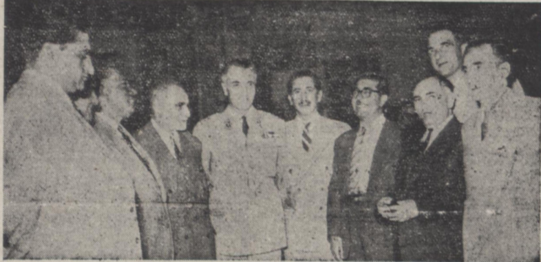
در این عکس تیمسار سپهبدزاهدی نخست وزیر در میان عده ای از نمایندگان مجلس شورای ملی در کاخ وزارت امور خارجه دیده میشوند

مدار مقرر دیروز از طرف آقای نخست وزیر مجلس ضیافتی بپای در کاخ وزارت امور خارجه برپا گردید بود که علاوه بر آقایان نمایندگان غیر مستغنی مجلس که کتبا برای حضور در این مجلس دعوت شده بودند اعضای هیئت دولت و مدیر عامل سازمان بر نامه و روسای شهربانی و شهرداری و عده ای از مأمورین و رؤسای عالی رتبه وزارت خارجه و چند نفر از مدیران جراید نیز در آن حضور داشتند. منظور از تشکیل این جلسه آشنائی بیشتری بین آقایان نمایندگان آن مجلس و هیئت دولت و سایر مقامات عالی رتبه دولتی بود و بهین لحاظ بنا باظهار اغلب بقیه در صفحه چهارم