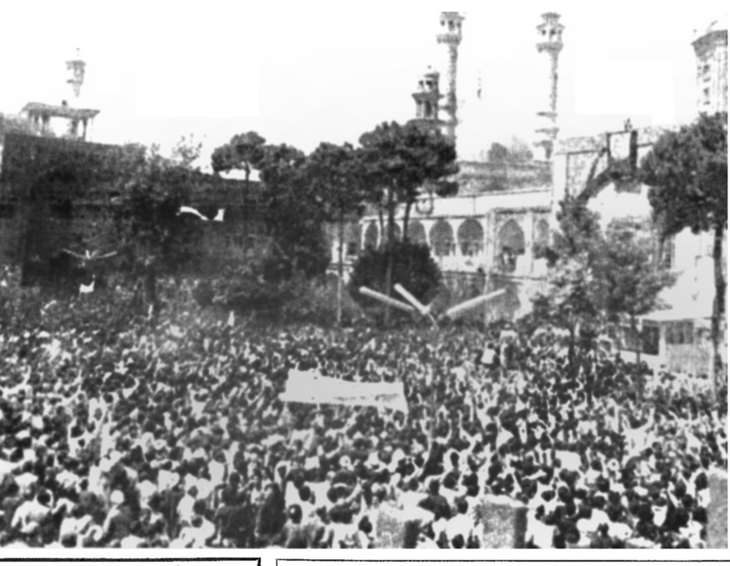
بزرگداشت خاطره قیام خورن ۱۵ خرداد سال ۱۳۵۷ قم شکوه دیگری داشت دیروز دهها هزار تن زن و مرد مسلمان در حرم مطهر حضرت معصومه (ع) مدرسه فیضیه و محوطه درالشفاء و میدان مقابل مدرسه فیضیه یاد شهدای بخون خفته ۱۵ خرداد را گرامی داشتند

اگر اینجانب از طرف امام نرفته بودم، باید از طرف خود امام یا دفتر امام تگدیب شود و مربوط به مدرسین قم نیست در صفحه ۲