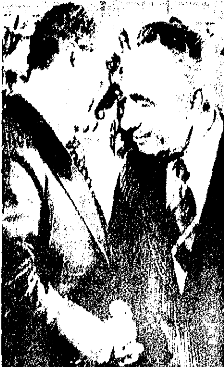
محمود احمدی نژاد، رئیس‌جمهور ایران، در جریان دیدار با سادات در تهران.

وین - اوسویشته‌پرس - امور سادات رئیس‌جمهوری مصر دیروز گفت که در کوششهای صلح خاور میانه پیشرفتی چنان چشمگیر صورت گرفته است که ملاقات ناهای میان او و بگین، نخست‌وزیر اسرائیل را توجیه کند. در همین حال دولت اسرائیل اعلام داشت که طرح نامه مصر برای صلح خاور میانه را «کاملاً غیر قابل قبول» می‌داند.