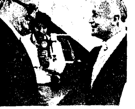
عباس عسکری در استقبال از گوندروا و کجیون وزیر خارجه ترکیه