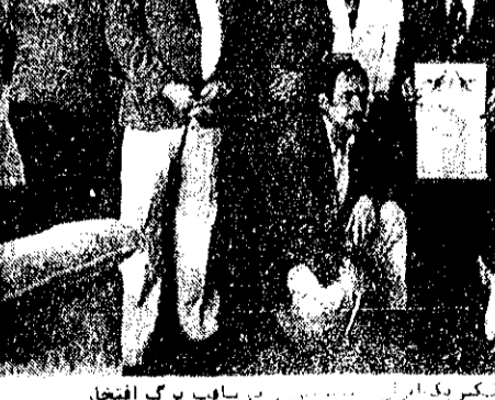
مدیرعامل و کارکنان شرکت سهامی الکتریک ایران در مراسم برگ افتخار