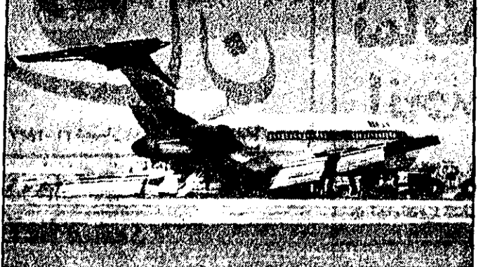
هوایما پس از خالی کردن یزین با سینه در فرودگاه برمین نشست

کمیته و میزان مالیات خود را تعیین نمایند. هدایت کلیه مالیات وزارت امور اقتصادی و دارایی در دست بررسی است. اصناف خود را تعیین خواهند کرد. براساس این طرح، سازمان مالیات تعیین خواهد کرد که هر کس مالیات تعیین کند و هر کس مالیات تعیین کند و هر کس مالیات تعیین کند.