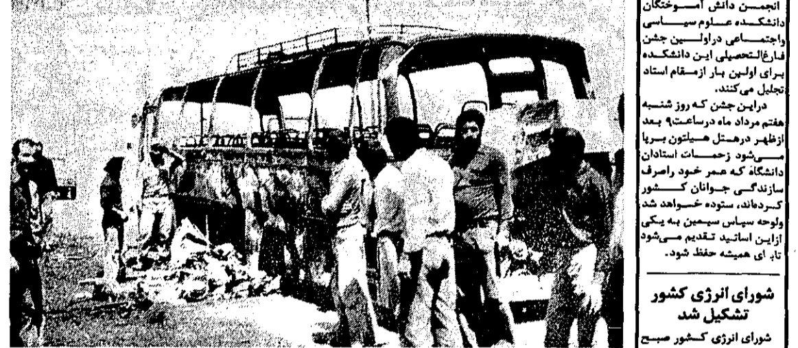
جبهه متحرک - حادثه وحشتناک جاده قزوین و آتش گرفتن اتوبوس بقدری سریع اتفاق افتاد که ۸ نفر از مسافران اتوبوس فرصت فرار نیافتند و زنده زنده در آتش سوختند. حادثه را راننده فراری یک پیکان بوجود آورد.

تعدادی از مسافران که در قسمت عقب نشسته بودند، به علت فلفل بودن در، نتوانستند پیاده شوند و دچار سوختگی شدند و ۸ نفر آنها در آتش مدتی در میان شعله‌های آتش سوختند و جز غلغله آن شدند، بطوریکه حتی شناخت هیچک از آنها مقدور نبود. مستولان این حادثه وحشتناک، چهار مرد، دو زن و دو کودک بودند که هویت آنها تاکنون اعلام نشده است. ۱۵ مسافر دیگر اتوبوس که به سختی دچار سوختگی شده‌اند توسط مأموران اورژانس قزوین به بیمارستان گورش کبیر این شهر انتقال یافته و تحت درمان قرار گرفته‌اند. بهمنی اظهار کرد که این حادثه در جاده قزوین و آتش گرفتن اتوبوس بقدری سریع اتفاق افتاد که ۸ نفر از مسافران اتوبوس فرصت فرار نیافتند و زنده زنده در آتش سوختند.