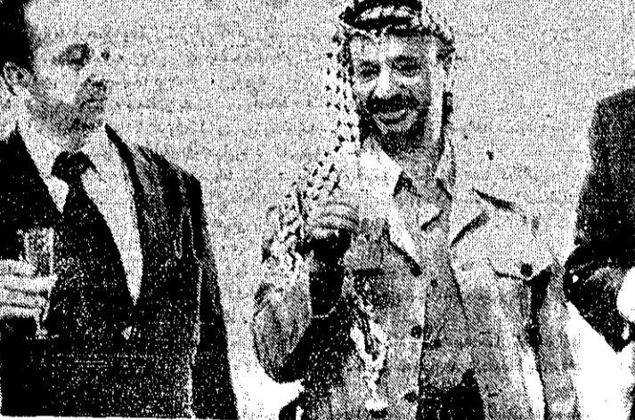
یاسر عرفات رهبر سازمان آزادیبخش فلسطین