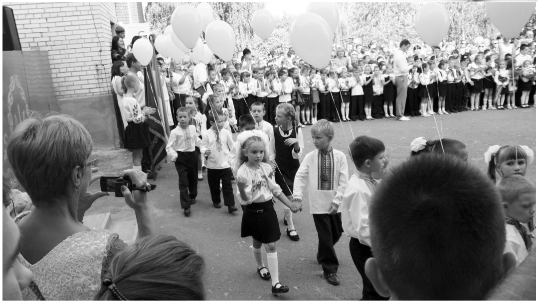
Цього незабутнього, вересневого сонячного дня зробили перші кроки в перший клас Макарівського НВК «ЗОШ-І ст. – районна гімназія» 77 хлопчиків і дівчаток.

Гучними оплесками зустріли присутні й батьків першокласників: за добрим народним звичаєм вони благословили своїх синочків і доньок хлібом-сіллю на вишиваному рушнику, доручаючи дітей вчителям і бажаючі, щоб засівали їх голівоньки знаннями, немов ниву житом-пшеницею, щоб зростали діти не пустоцвітом, а вагомими колосками на радість батькам і на славу України! Під вишитими рушниками, як оберегами на все шкільне життя, проїшли першокласники до своїх навчальних