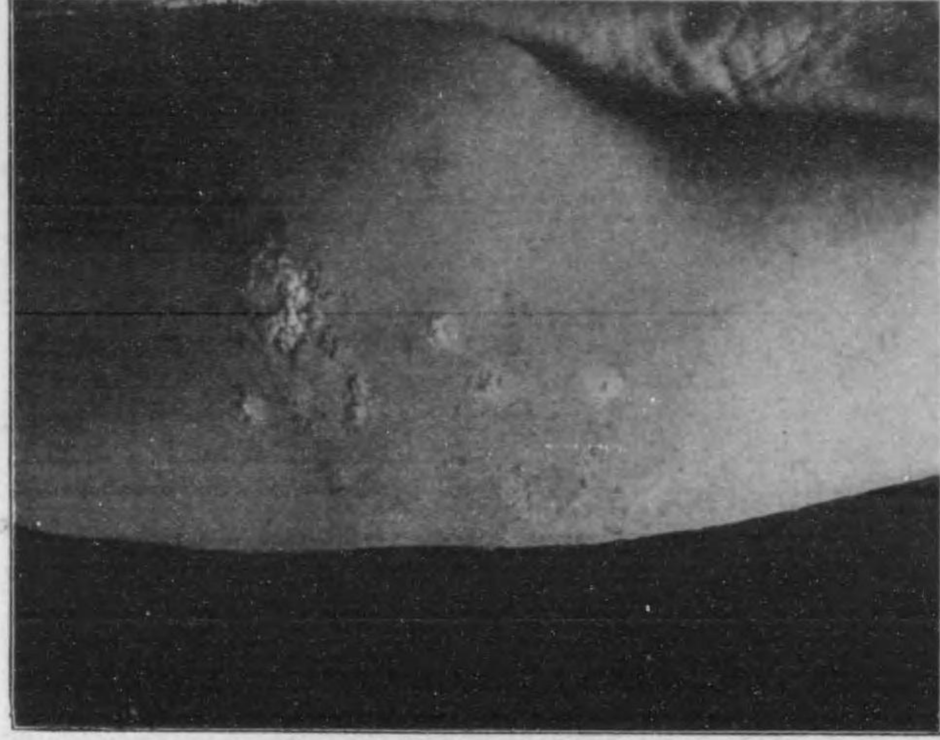
Herpes zoster 帶狀ヘルペス