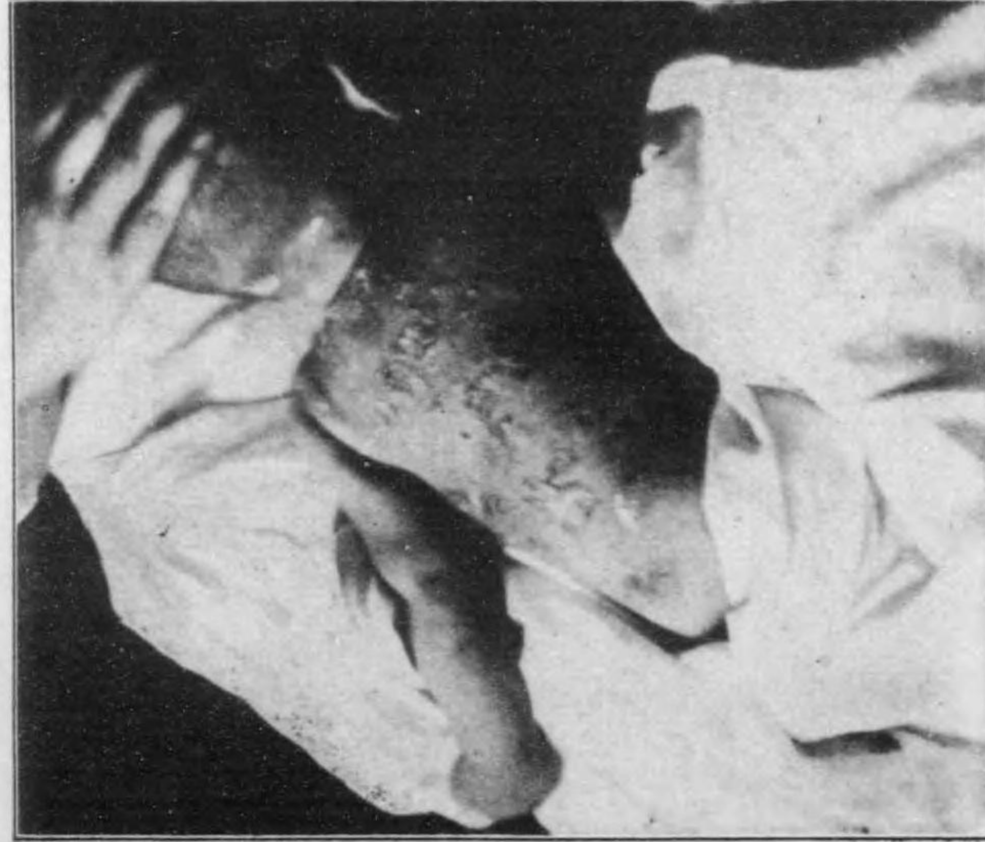
Pemphigus Neonatorum 初生兒天疱瘡