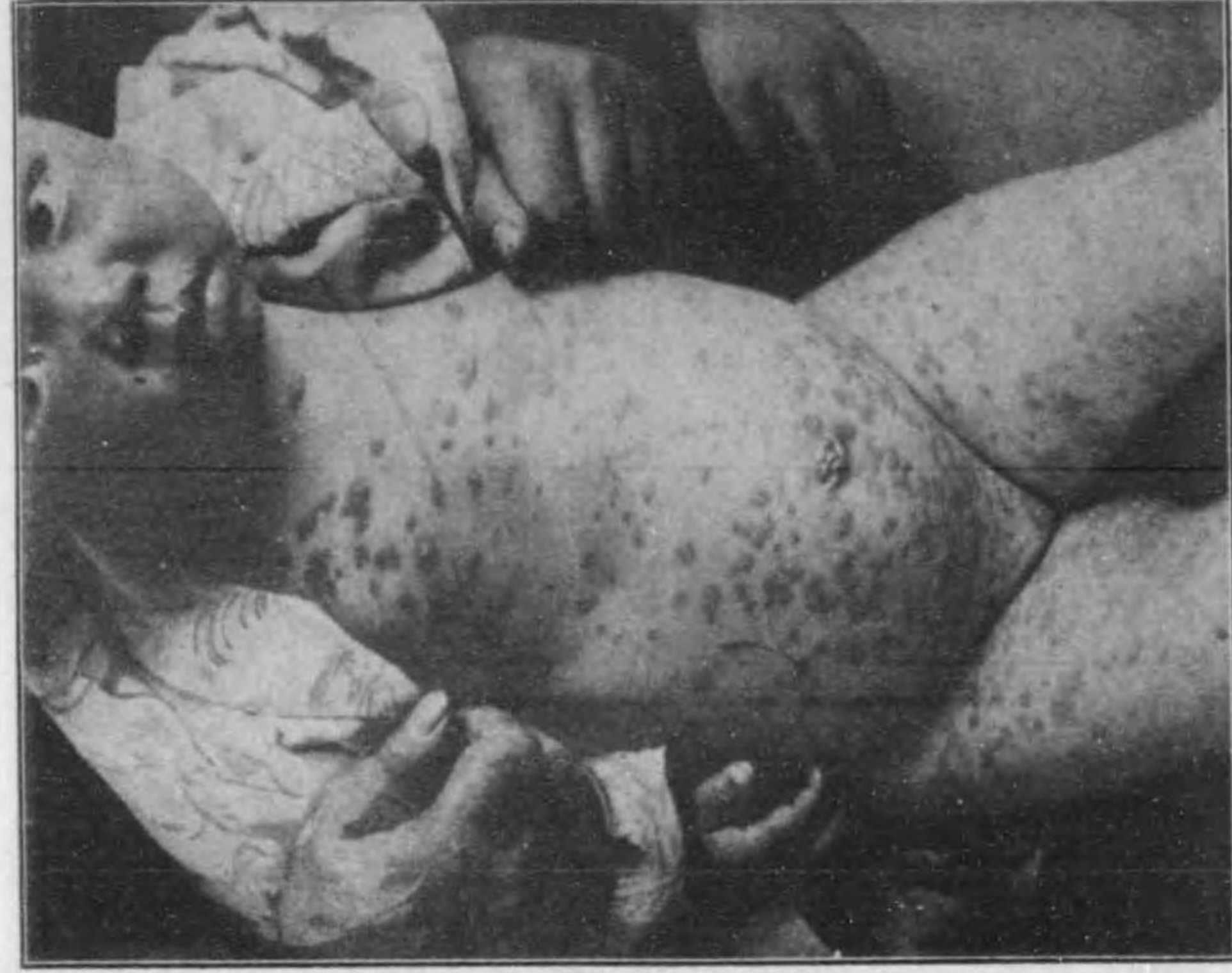
Urticaria pigmentosa 色素性蕁麻疹