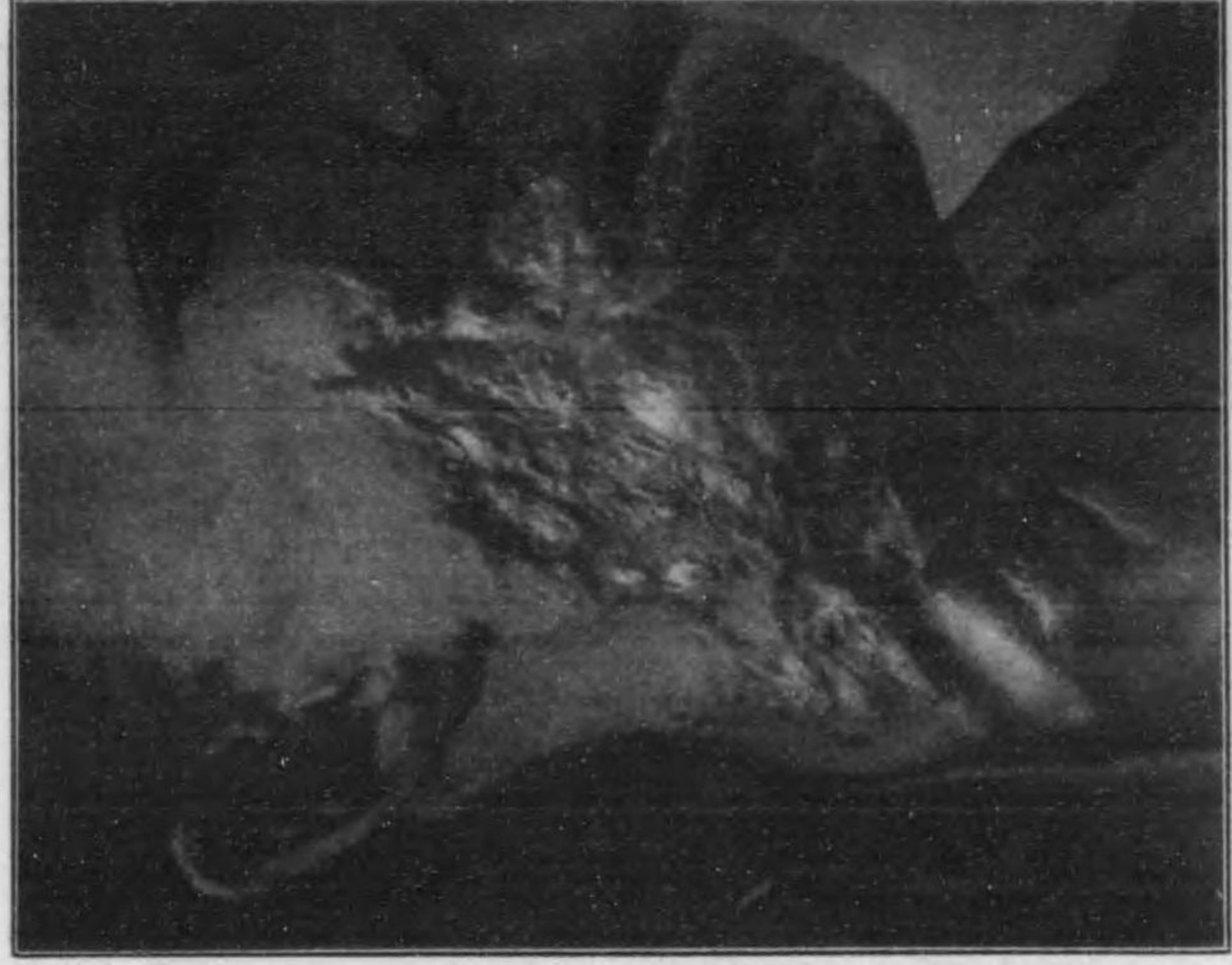
Lupus vulgaris 尋常性狼瘡