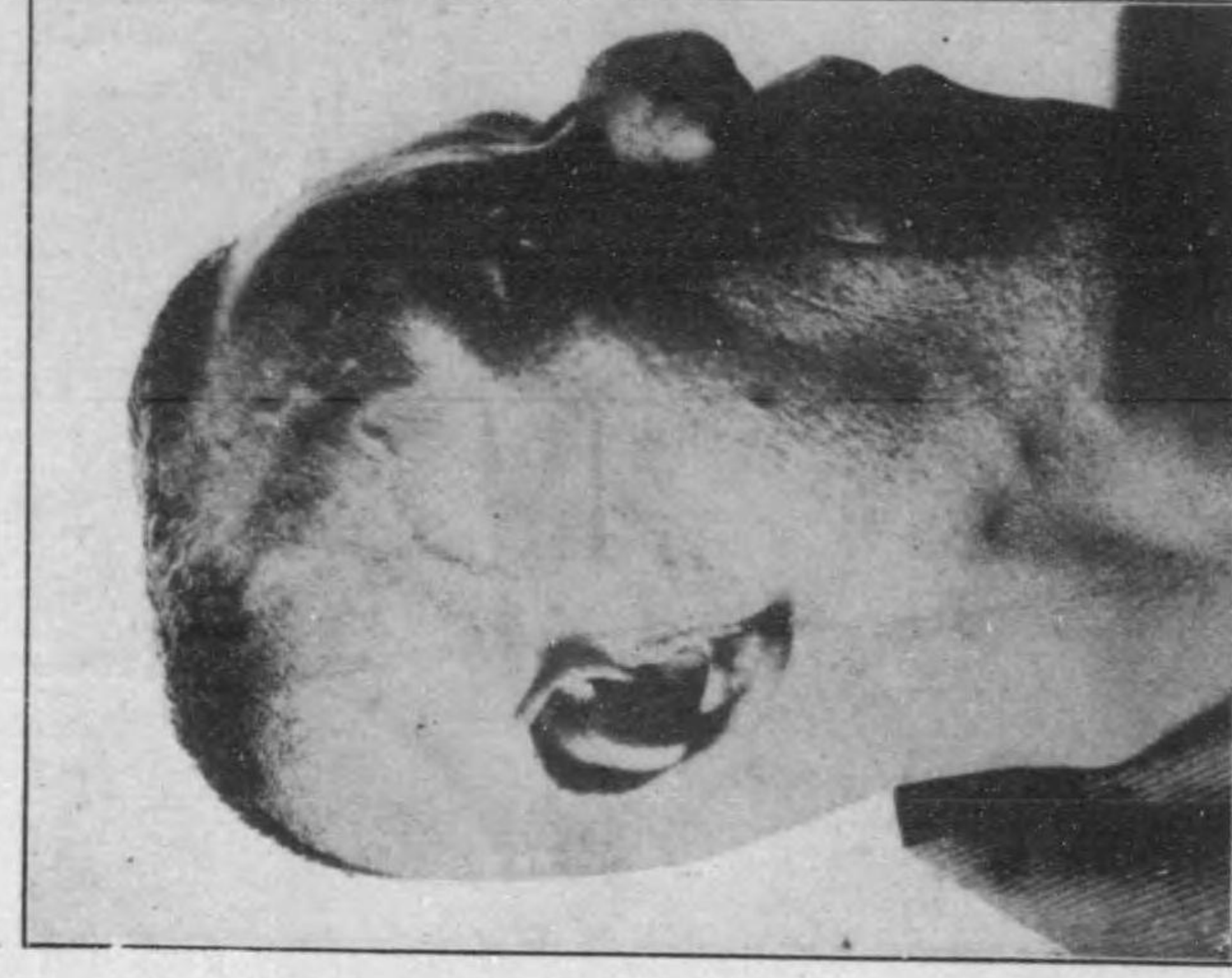
Haemangiom der Nase 鼻部血管腫