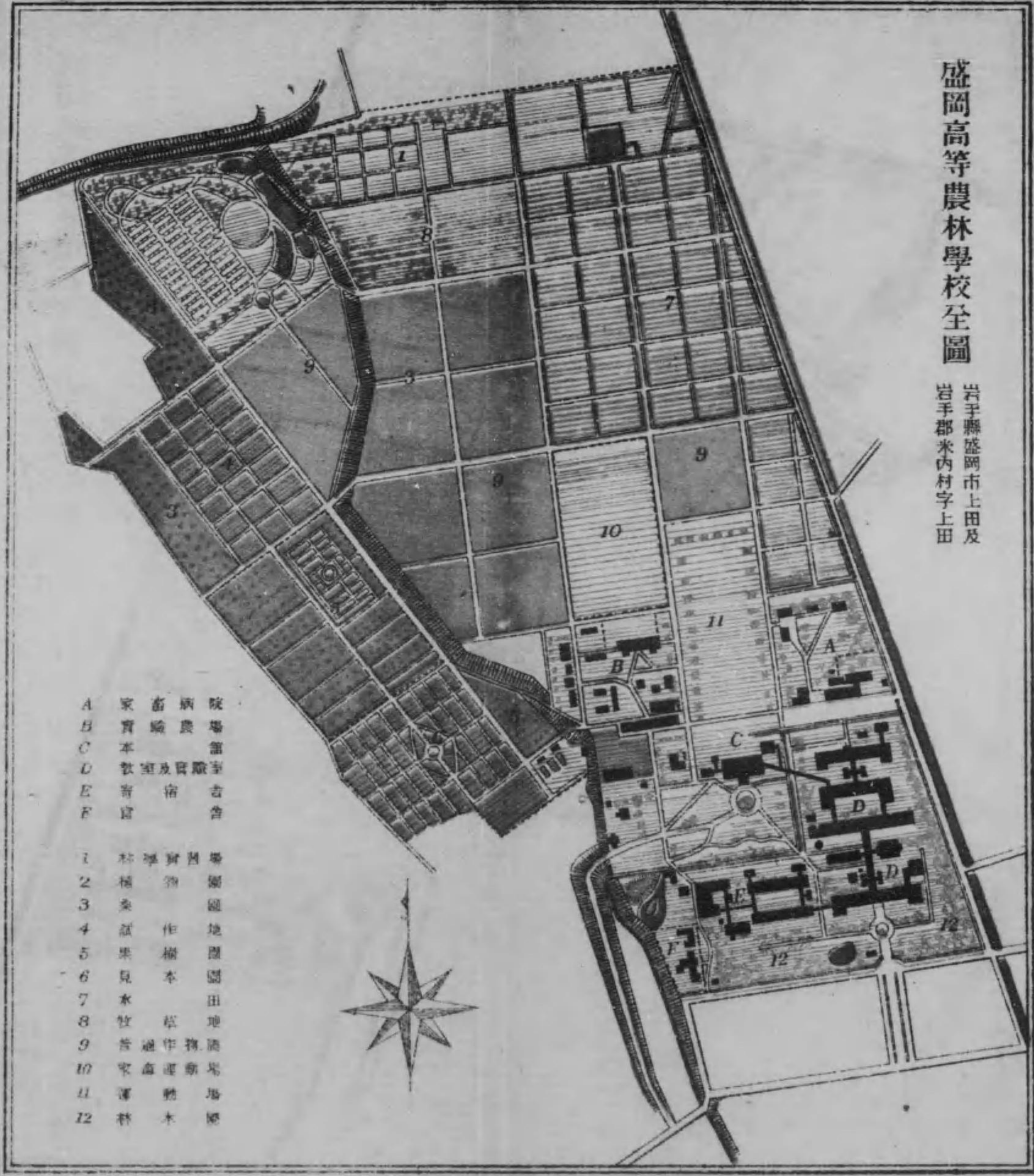
盛岡高等農林學校全圖