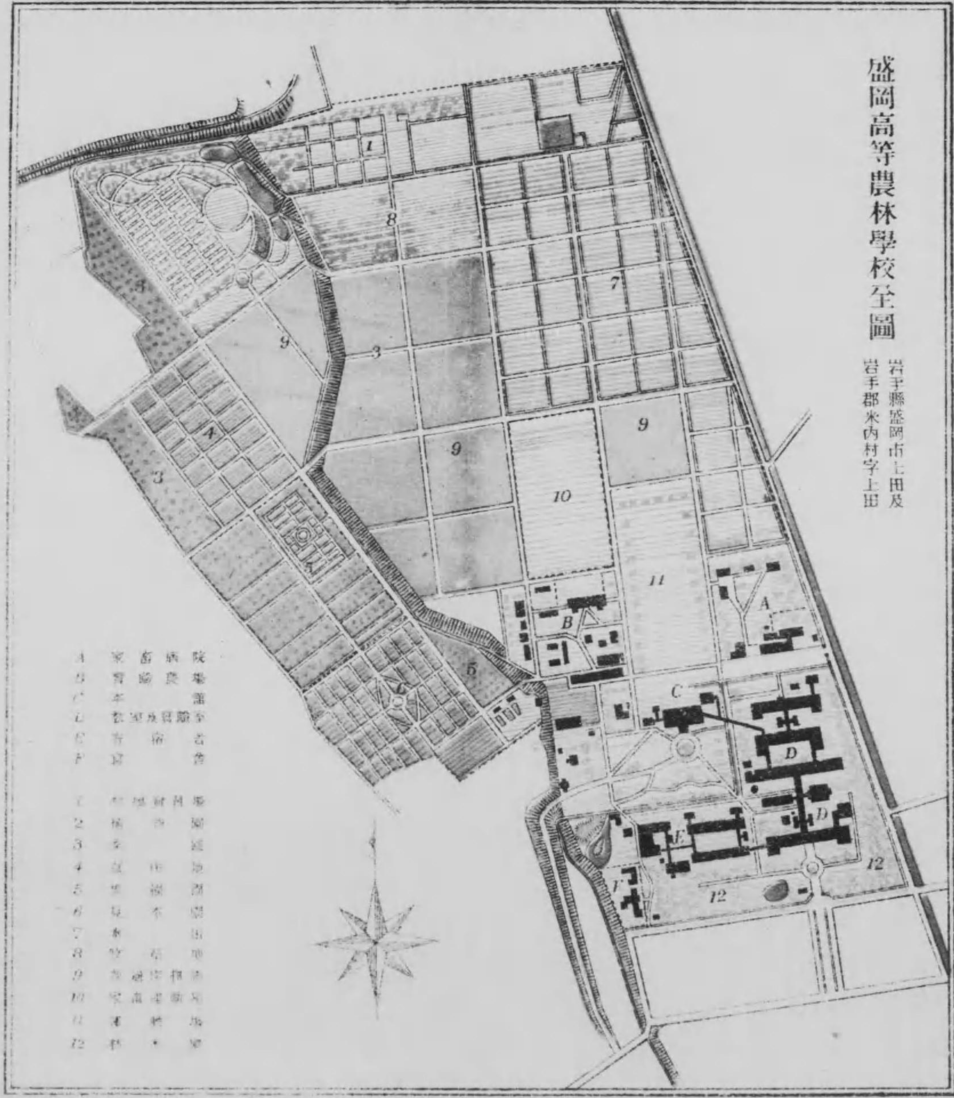
盛岡高等農林學校全圖