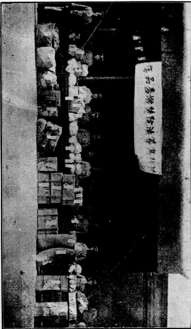
河高北院法與天地方院法共焚燬毒品陳列攝影