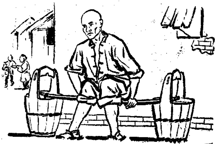
萬年青不信服命運