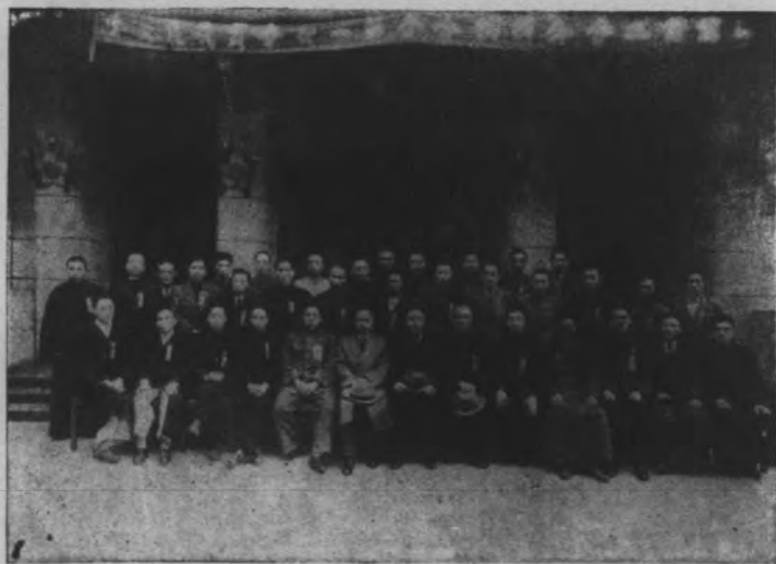
本會第一屆理事監事就職合影