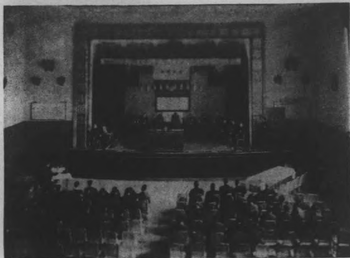
大會會場內部情形