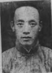
理事會合沅 年齡四十二歲 籍貫浙江溫嶺 單位溫嶺縣鹽業 商業工會理事