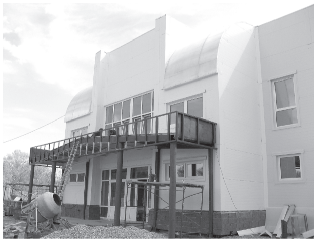
Город и мы

Глядя на счастливые лица участников выставки, я понял, что есть в этом старинном занятии нечто - какой-то особый магнетизм, заставляющий снова и снова идти на природу, срезать гибкие ветви и священнодействовать над ними, превращая вязанку ивовых прутьев в шедевры истинно русского народного промысла.