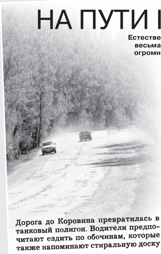
Дорога до Коровина превратилась в танковый полигон. Водители предпочитают ездить по обочинам, которые также напоминают стиральную доску