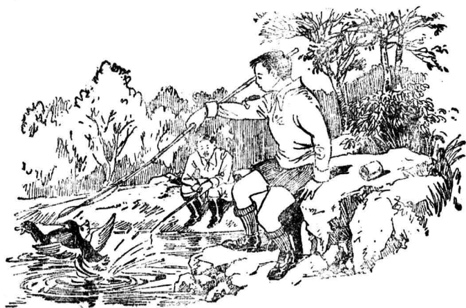
險些打死人家的鴨子

這時，我們已走到鄉下。有四個人在後面走來，比我們走得快，不久就走到我們身旁了。這四個人中間，有二個穿黑色制服，其餘二個身體一高一矮，都穿