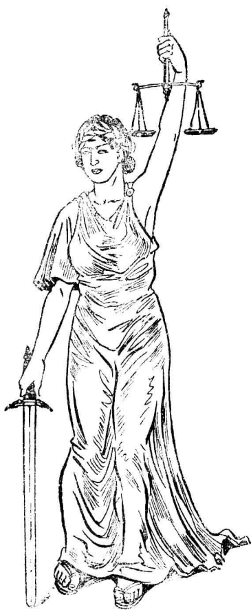
的私無的平公是律法