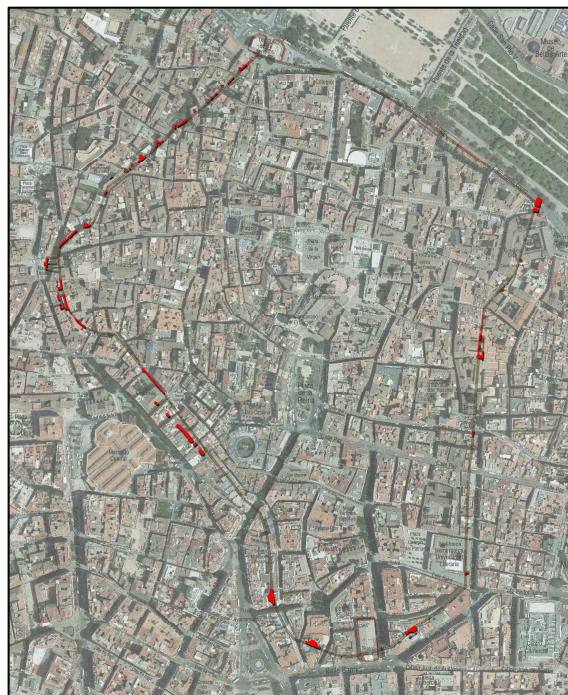
Foto aérea 2008 SIGESPA con ámbito arqueológico propuesto