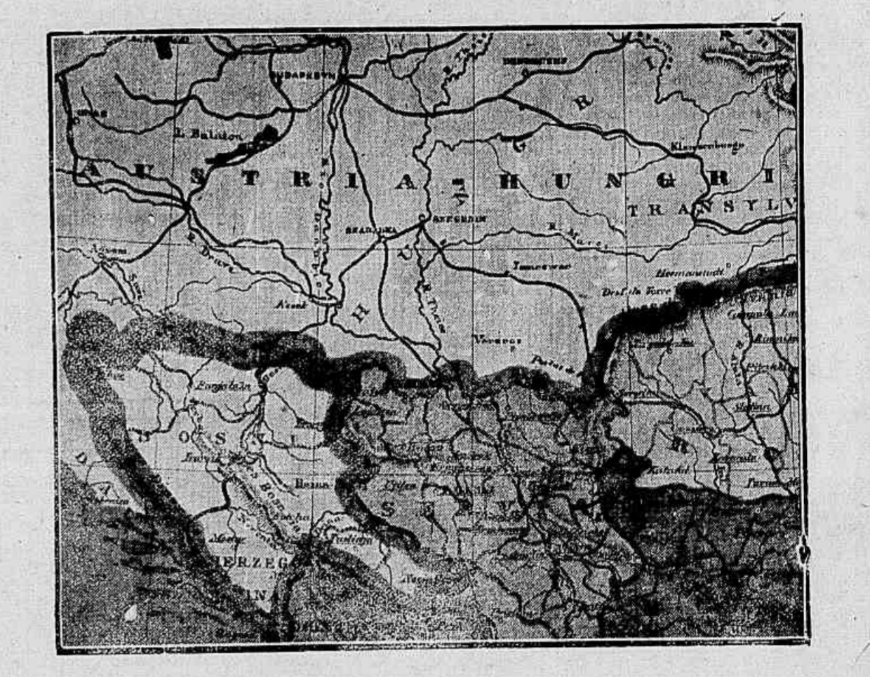
Um mappa da Servia e do Montenegro, onde deverá desenvolver-se a acção com a Austria

PREPARATIVOS MILITARES EM MALTA LONDRES, 30 - Dizem de La Valette, na ilha de Malta, que se fazem all activos preparativos militares, os quaes annunciam as preliminares da mobilização.