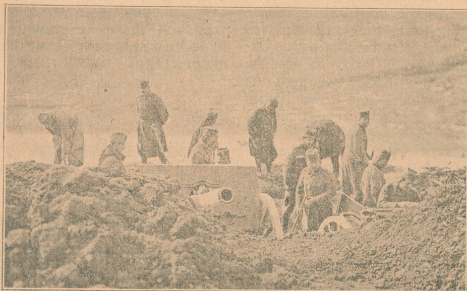
Српска Артиљерија под Једреном