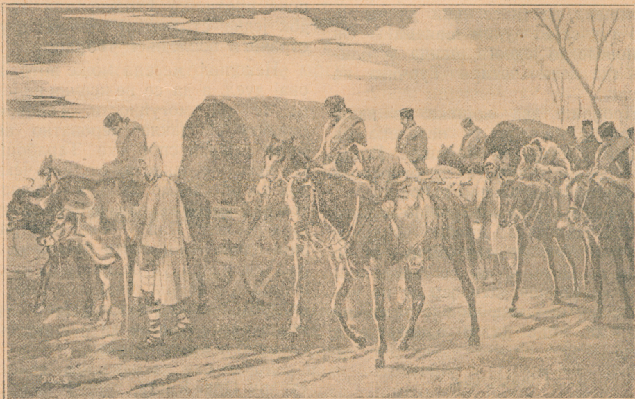
* Ноћни поход српске војске