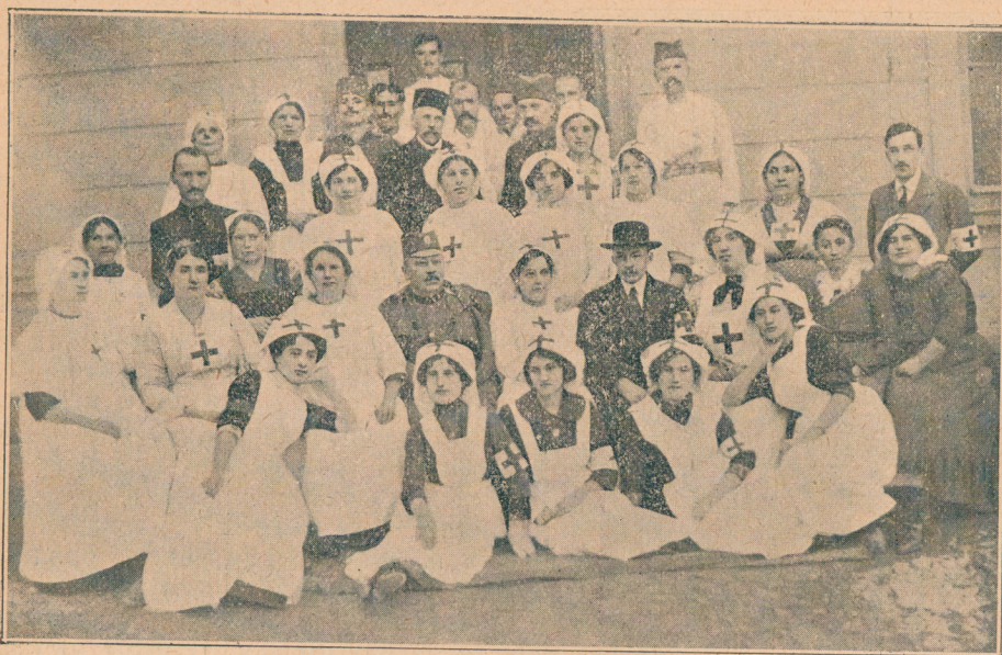
Српски болничари и болничарке у паланачкој болници у Србији.

ва, помоћу којих су могли спречавати покушаје испада турске војске из тврђаве, али ни са овим није се могло ни помислити на какве операције против силних утврђења, наоружаних великим „Круповим“ топовима највећег калибра. На послетку је дошло и осам великих опсадних топова и тек онда отпочело се са бомбардовањем спољашњих утврђења.