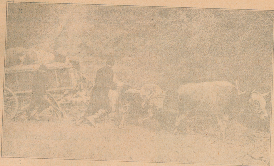
Српска неуморна комора пред Битољем

се рат прекинути, чије настављање (после «лондонских разговора») сматрамо за највеће злочинство и у толико страховитије, што је бесмислено! Не знам, да ли сам у праву или нисам; али ја апсолутно нисам у стању, да схватим смисао продужењу рата! Никако не ћу ни покушати да схватим, зашто је потребно да овде на Балканском Полуострву изгине још хиљадама људи?! Јер, чини ми се, човек не мора бити ни пророк ни Бисмарк, па да предвиди, какав ће бити крај овог рату!