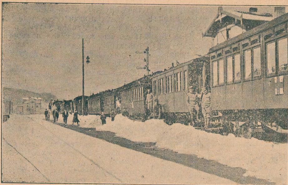
Први српски санитетски воз са рањеницима са Једрена

Срце ми је узбуђено као да сам кришом угледао неко заробљено благо наше... Види се само једна половина вароши, у којој је све зграде надвисила величанствена католичка црква (најљепша кат. црква на Балкану), мало даље од ње су велике касарне турске посред читавог лабиринта улица, обраслих бујним зеленилом. Све мирно, немо, као изгубљено у трави, почива, као и да не слуги, шта је све уперено на њ.