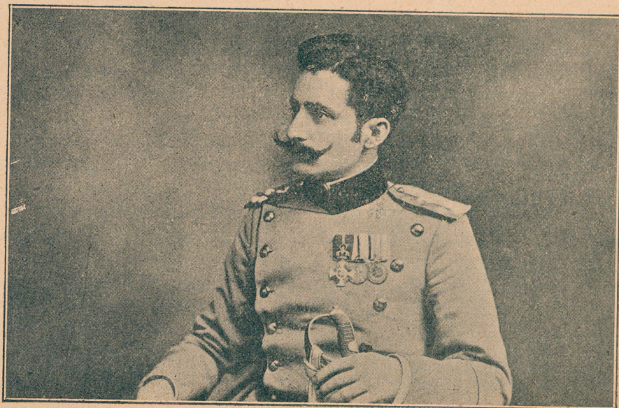
Војин Танкосић, капетан један од најхрабријих комитских вођа