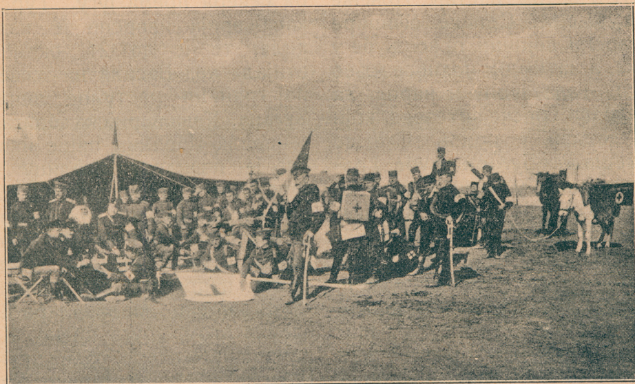
Српска војска, санитетско одељење на вежби

оставили. Дринопоље је чврсто утврђено те имаде за посаду 16. збор.