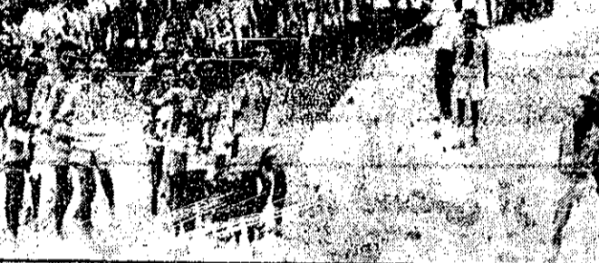
مدعیان ارضانی که بتازگی به جنگجویان استقلال طلب اریتره پیوسته اند در یک اردوگاه آموزشی رژه میروند.

چنانچه این قطعنامه از تصویب شورای امنیت سازمان ملل متحد بگذرد تمام کشورهای عضو سازمان موظف خواهند شد که بر طبق ماده هفتم منشور سازمان ملل متحد از فروش هر گونه اسلحه و تجهیزات نظامی به اسرائیل خودداری کنند.