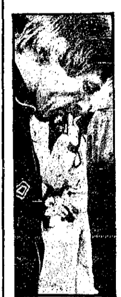
ویلی جانسون دیگر برای اسکاتلند هرگز بازی نخواهد کرد. او را می‌بینید که از برابر روزنامه‌نگاران سراسر افتد می‌گذرد (رادنیوتوی آسوشیئیتس)

تیم اسکاتلند در خطر اخراج از جام جهانی بازی بعدی اسکاتلند بایران است بررسی اخراج تیم اسکاتلند بخاطر استفاده یکی از بازیکنان این تیم از مواد محرک است کراش گروه اعزامی کیمهان: مهدی اندالهی، احمد علی اتحادیه، نورالله صرافیان و هرمز فرهنگ‌پور در صفحات ۱۰، ۱۱ و آخر