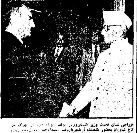
موراجی نمای نخست وزیر هند در وقت توفیق توفیق در تهران در کاخ نیاوران بحضور شاهنشاه آریابهریار یافت - صفحه ۲ - شون چهارم

کیمهان شماره ۱۶۰۴۲ - ۲۹ جمادی الثانی ۱۳۹۸ - شماره ۱۰۴۸۲