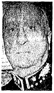
ارتشبد نعمت‌الله نصیری

ارتشبد نصیری، سفیر ایران در پاکستان شد ارتشبد نصیری ۱۴ سال معاون نخست وزیر و رئیس سازمان امنیت و اطلاعات کشور بود صفحه ۲ - شون هشتم