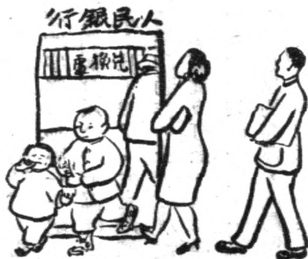
的啼啼哭哭着帶忙趕 (五) 券民人了換去妹妹