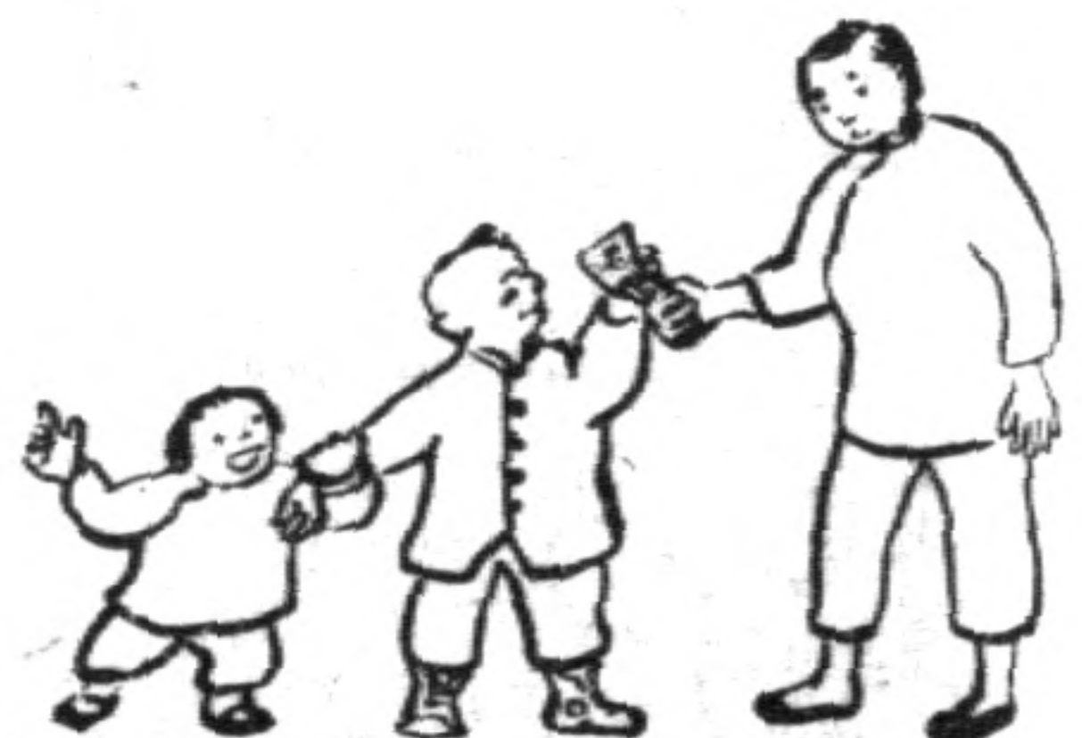
港元一我給媽媽天今（一） 糖買去妹妹帶，幣