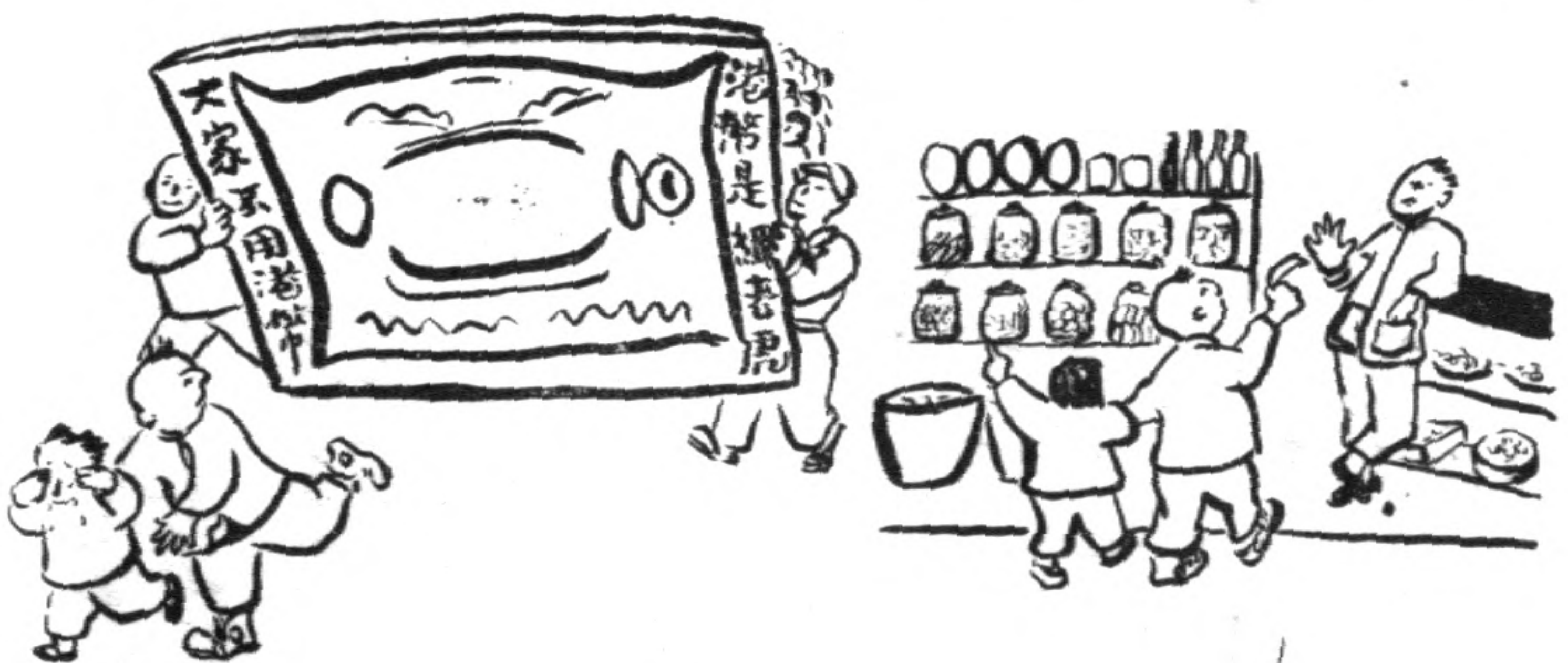
西東壞是幣港來原 (四)

人的敵人鋸齒虎和巨象以及其他的動物（例如沒有變成人的猴子），都不能長出茸密的毛來，所以只好逃跑到南方去，找尋