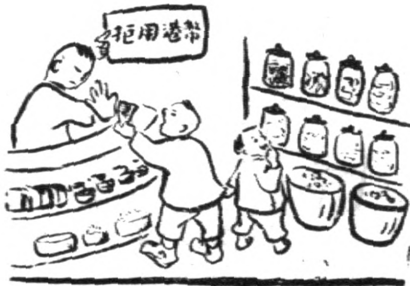
收肯不家東到走（二）