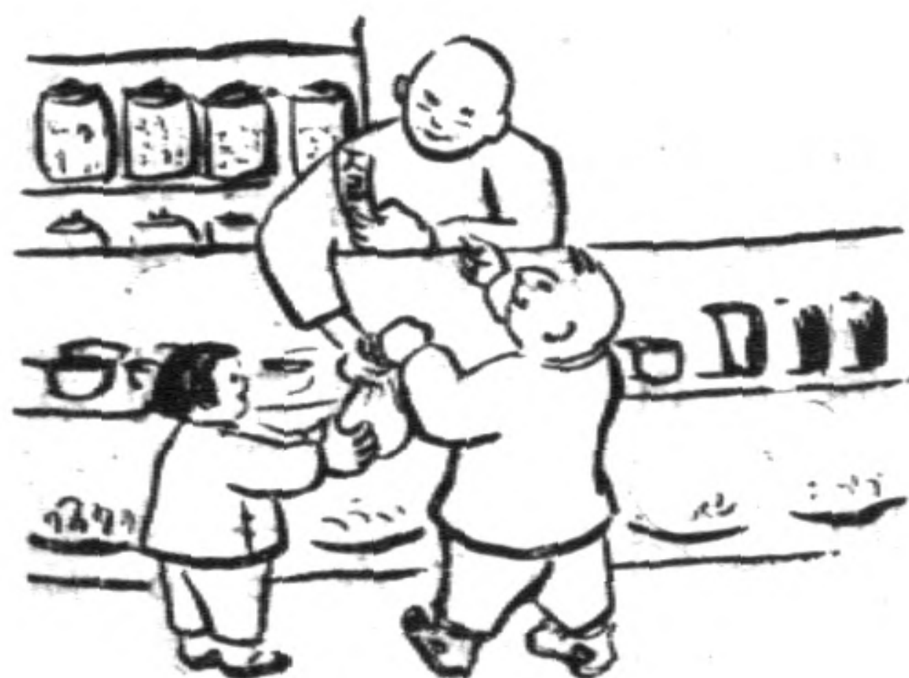
笑嘻嘻果糖到買 (六)

誰都知道，肉類比較任何的果實更容易吃得飽。所以肉食給予原始人以更多的氣力和更多的