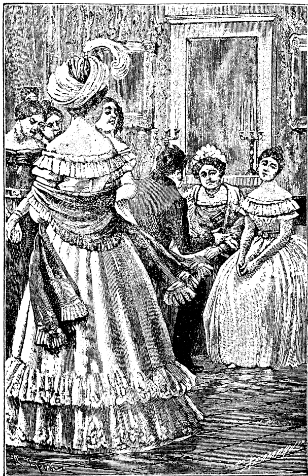
乞乞科夫的態度惹起了一切閨秀們的不平。