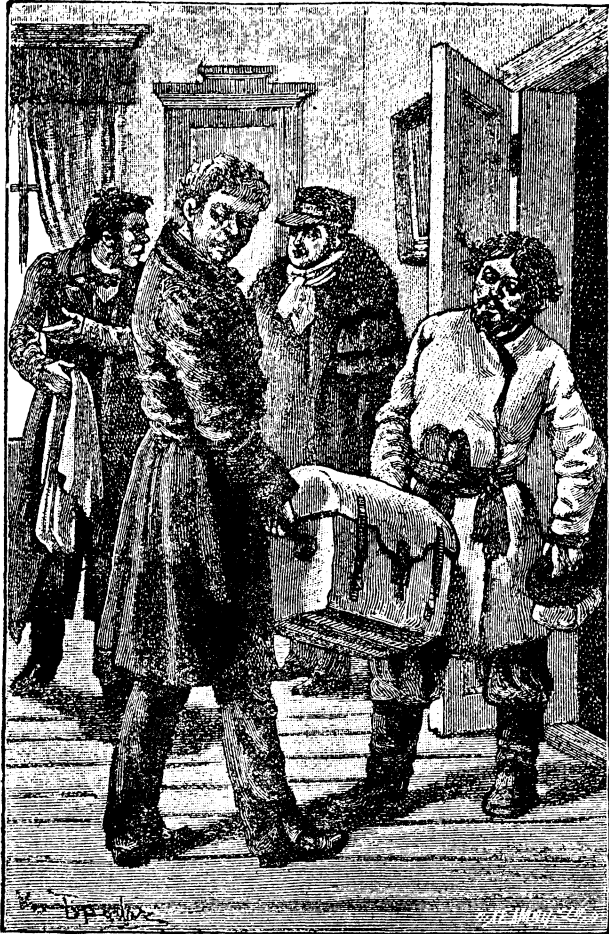
這箱子，是馬夫綏里方和跟丁彼得爾希加捧進來的。