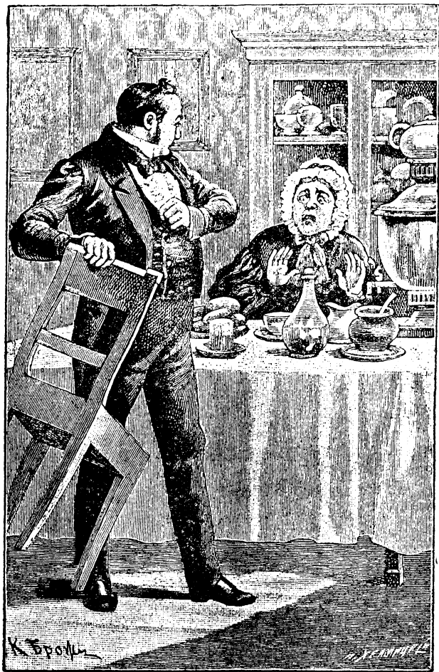
乞乞科夫再也忍不住了。