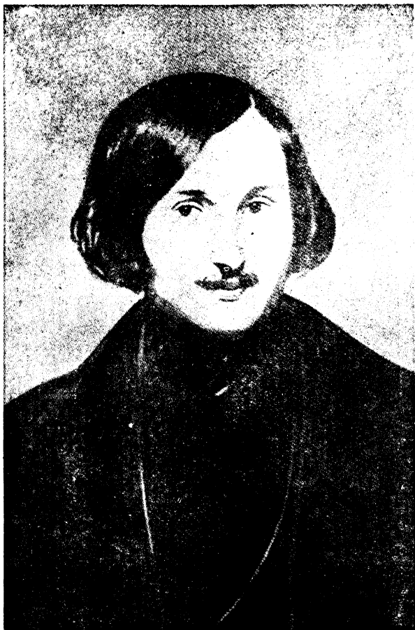
N. V. GOGOL