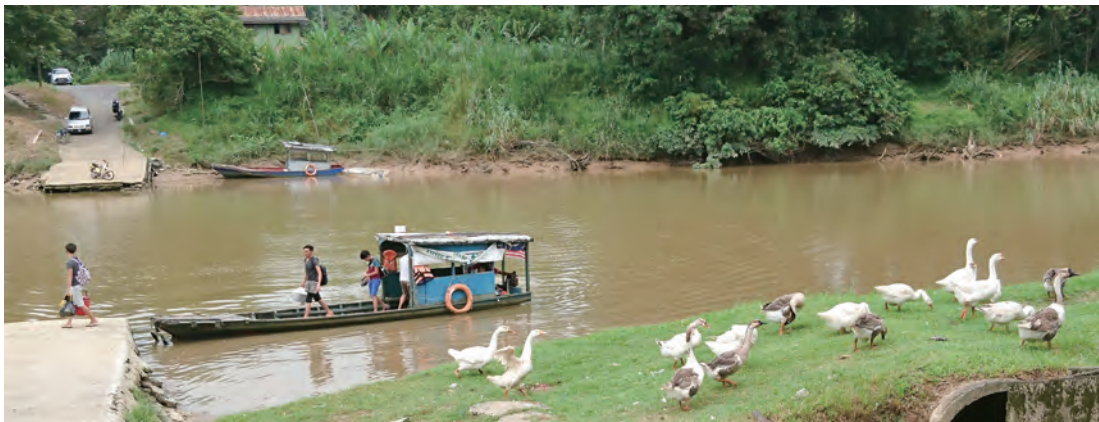
新堯灣老街臨近砂拉越河支流的分流，船是重要的交通工具之一。

後者位在世界第三大島婆羅洲島北部，簡稱東馬，包括沙巴、砂拉越與納閩聯邦直轄區，南與印尼交接，而新堯灣所在的砂拉越州，是馬來西亞最大州，是東馬古晉市之外最繁榮的城市，鎮上老街與印尼接壤的邊界距離約34公里，車程不到1小時。