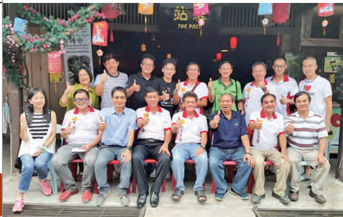
驛站是南向交流團隊舉辦許多活動的基地，兩地客庄的好朋友一起在店屋前合影。

與此同時，原來只在週五、週六下午6點至11點展開的夜市，隨著人潮的湧入活絡了夜市，新堯灣巴剎鄉村發展委員會、新堯灣老街夜市場籌備委員會與新堯灣老街夜市場攤販、商家齊聚一堂開會，決議再增加週日下午4時至11時的開檔時間，老街夜市自此人潮爆滿，店裡每天座無虛席，生意好到忙翻了。