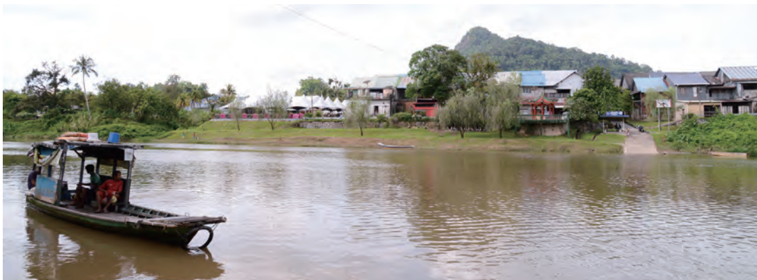
新堯灣老街與馬來村莊，僅一水之隔，後方是瑟冷布山。

馬來西亞是由13州與3個聯邦直轄區所組成的聯邦，為南海分成西馬來西亞與東馬來西亞。前者位在馬來半島，簡稱西馬，包括玻璃市州（Perlis）、吉打州（Kedah）、檳城州（Pulau Pinang）、霹靂州（Perak）、雪蘭莪州（Selangor）、森美蘭州（Negeri Sembilan）、馬六甲（Melaka）、柔佛州（Johor）、彭亨州（Pahang）、登嘉樓州（Terengganu）、吉蘭丹州（Kelantan）、砂拉越州、沙巴州（Sabah），以及首都吉隆坡聯邦直轄區與聯邦政府所在之布城聯邦（Putrajaya）直轄區，北連泰國（Thailand），南隔柔佛海峽（Straits of Johor），以新柔長堤（Johor-Singapore Causeway）和第二通道與新加坡相接。