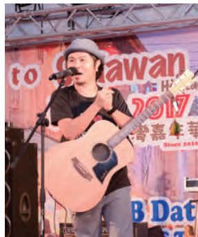
2016年金曲獎最佳客語專輯得主黃子軒於第2年南向交流時加入，上臺熱力開唱。