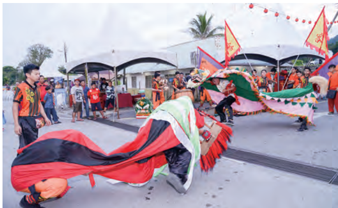
芎林金獅團在新堯灣會獅，接受眾獅拜會。