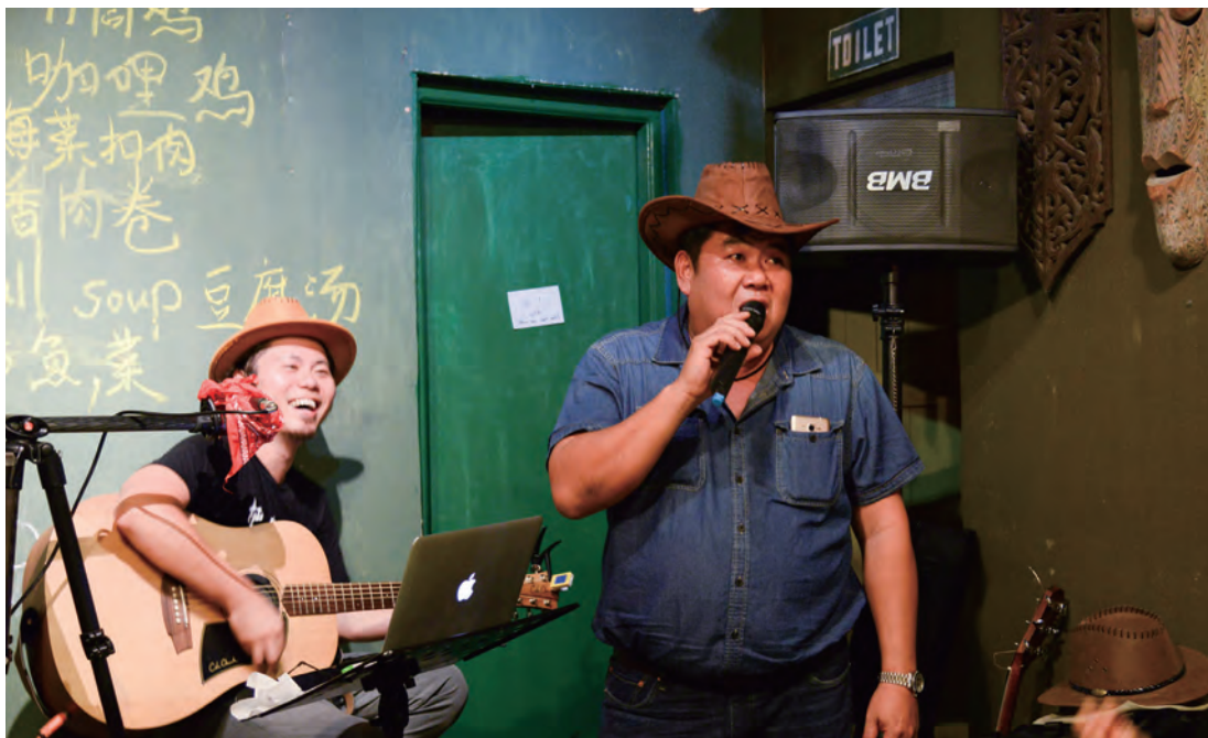
團隊南向馬來西亞，透過客家音樂、社造等深耕交流，締結金蘭情誼。