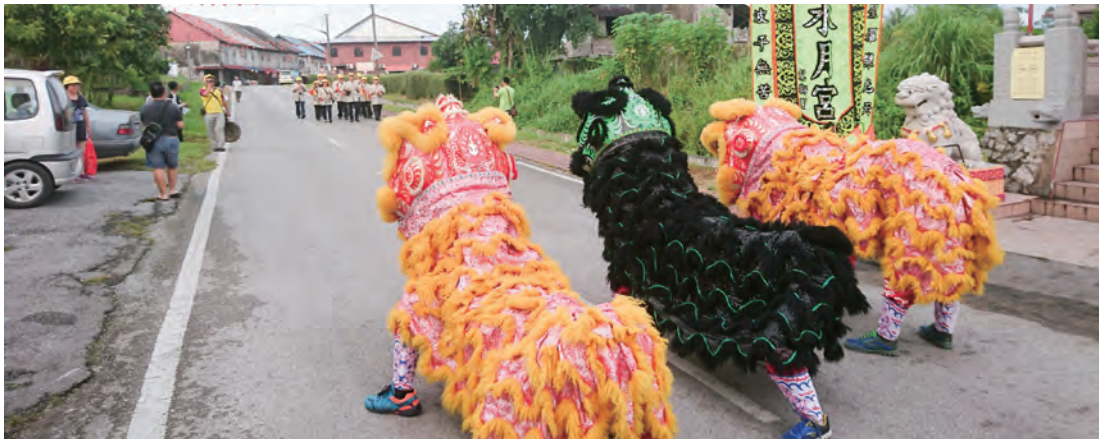
參加水月宮慶典演出的乾興客家八音團，受到當地獅隊的相迎，兩地的文化交流行程中，流露出客家鄉親「相親」的情感。