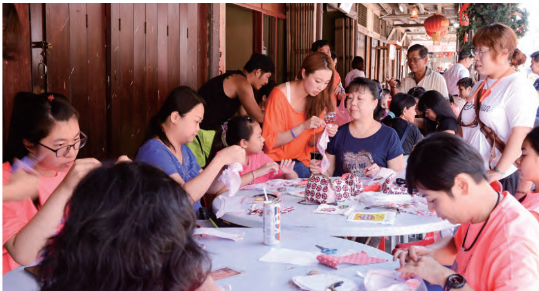
大孩子與大朋友們認真縫製拼布零錢包。

智遊戲而非純粹技藝性娛樂，一條長長的繩子在手裡串來串去，三兩下串去對方手裡，又再交換回來，直到無法從對方手中取得繩子。