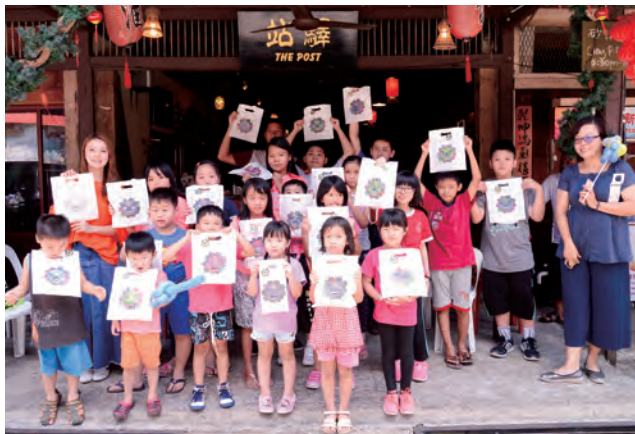
孩子們亮出自己彩繪的獅頭提袋好開心！