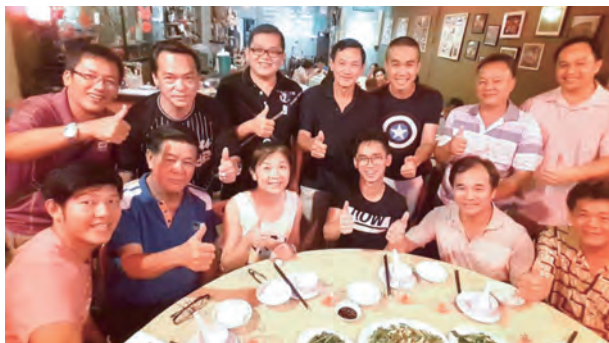
交流團團員們分工合力，端出16道經典的臺灣客家料理。

當地的菜包是用太白粉與糯米粉揉成皮，所以外皮有些透明，再包入鹹菜與豬肉等餡料，形狀似金元寶，尺寸小，約莫一口一個，與臺灣傳統從米磨成粉再製成板為皮的作法很不一樣，而且臺灣的菜包底下墊柚子葉，而新臺灣墊帆布去蒸。紅板倒是與臺灣口味一樣包紅豆，只是尺寸小了一半。