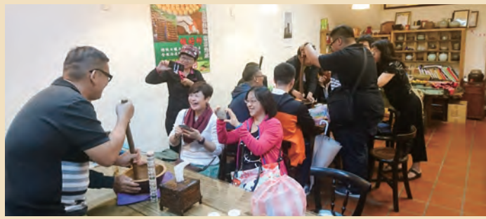
馬來西亞回訪團參訪湖口老街八音團、新埔柿餅、竹東竹簾、北埔擂茶，體驗臺灣的客庄文化。