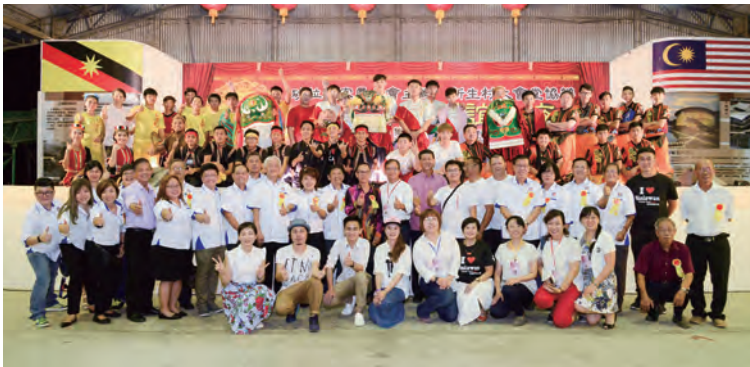
2017年南向團來到17哩新生村，帶來了客家流行音樂與客家獅的演出與交流。

這些華人新村從臨時的居所，隨著新一代的華人在此成長、生活，50多年後的今天，已成為永遠的家。而17哩這一區在新村成立之前，居民雖是散居，其實早已形成擁有商店區、學校、公家部門等的村落樣貌，早已奠定今日17哩的發展基礎，生活在此的村民逐步創造出屬於他們的家園。