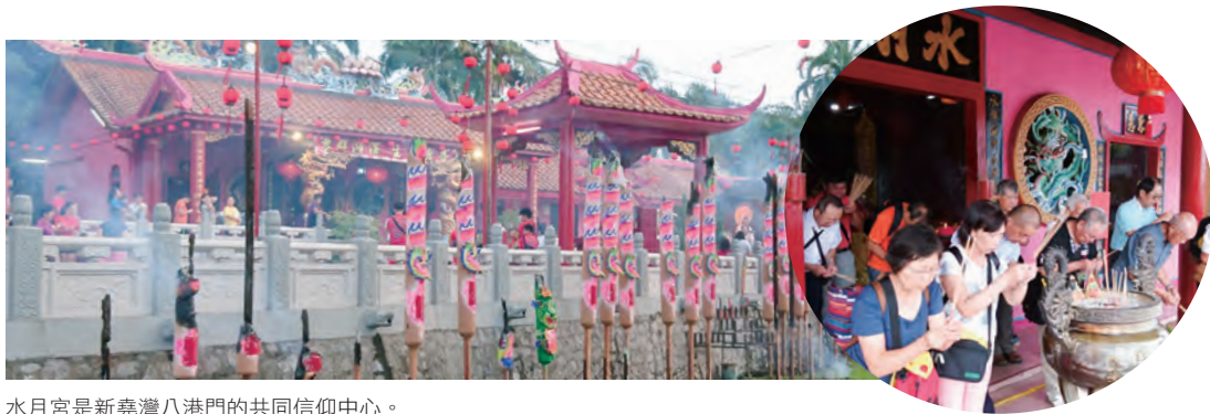
水月宮是新堯灣八港門的共同信仰中心。

儀典從農曆6月19日凌晨子時，實是前一日深夜11點展開，由代表港門辦理祭典的福首與老巴剎店家擔任的總理點燃八港門共同敬獻的12尺長龍香，宣告祭典正式展開，其後民眾紛紛上前點香祭拜。