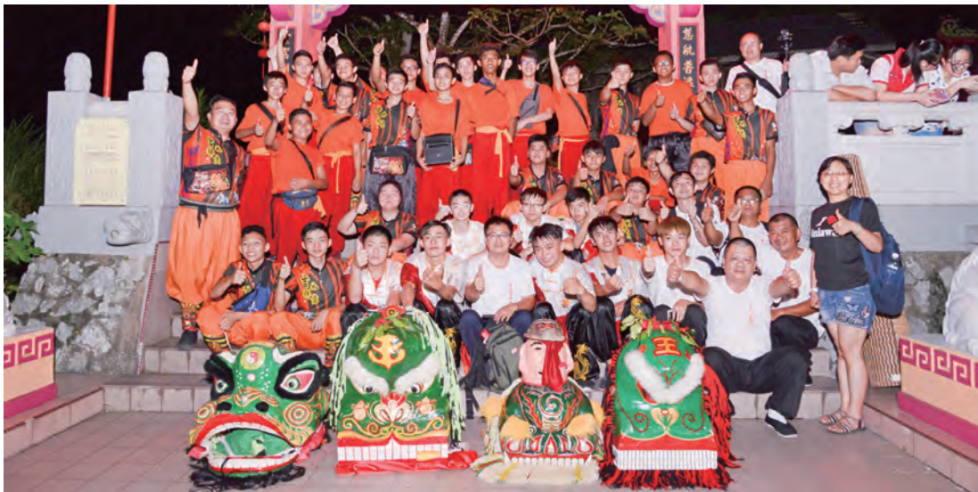
演出的空檔，芎林金獅團前往當地信仰中心水月宮，依客家獅拜廟禮儀參拜。

15名團員抵達古晉、新堯灣等地，於中華小學、水月宮昇平臺、17哩新生村表演客家獅，深獲當地獅隊及民眾佳評，扎實的基本功搭配大面、小面逗弄獅子的劇情演出，將