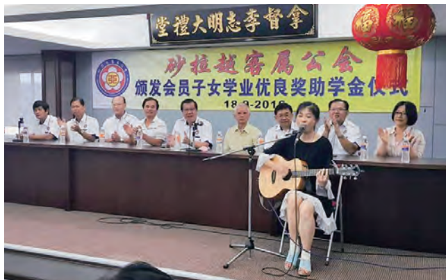
砂拉越客屬公會為客家人提供各類服務，謀取福利，圖為2017年南向團隊拜訪砂拉越客屬公會。

大時代裡，人禍、天災俱至。1963年，砂拉越河肆虐，造成新堯灣大水災，淹沒了一整層樓，不但毀壞了身家財產，連記錄當地歷史的公私文書也泰半損毀，造成了日後地方歷史追溯的困難。沿河發展的新堯灣，多年來接連飽受水患之苦，最近的一次在2016年，連水月宮也被水圍困了2日。