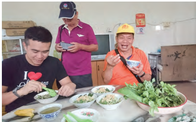
新堯灣的河婆擂茶就是用桌上的這些蔬菜等研磨而成，看表情就知道，苦啊！

河婆客家人來到新堯灣已1百多年，飲食上融入了當地原住民、馬來人的口味，包括大量使用當地生產的胡椒，以及香茅、辣椒、伽薑瑪（Kacangma，益母草）等，例如坐月子吃的雞酒，便加入伽薑瑪；當地菜色與臺灣客家料理很不一樣，例如薑絲炒大腸、客家小炒等四炆四炒當地都沒有，南向團隊傳授一家餐廳客家小炒的作法，成為當地點用率最高的一道菜。