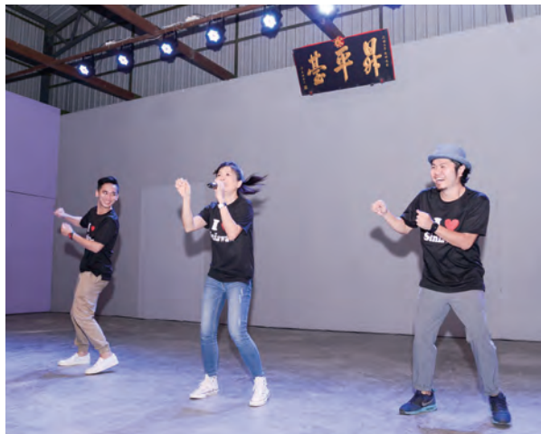
三位客家歌手在水月宮昇平臺高歌。