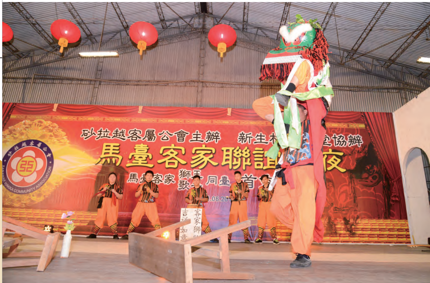
大馬吉祥如意龍獅團表演「綵和採青」的戲碼。