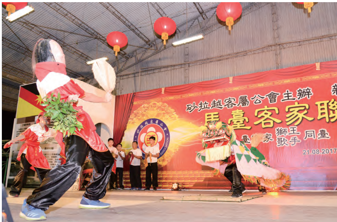
芎林金獅團的客家獅、大面和小面上陣，在17哩新生村的演出。

大、小面故事眾說紛紜，另有一說獅子是古代皇后娘娘養的寵物，忽有一日獅子不見了，皇帝派眾臣們到處尋找未果，皇后因想念獅子而生病，眾臣非常緊張，建議皇帝貼詔書獎賞協尋者，大面看不懂詔書，把它撕下玩耍，大面的好友小面知道後，趕緊帶大面一同到森林中尋找獅子並帶回給皇帝，免除大面殺身之禍。