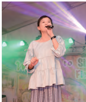
客家流行歌手徐世慧在2017年新臺灣嘉年華演唱。

然而到了海外客家庄，客家話反而成為彼此最親近的語言，3千公里的距離瞬間被相同的母語打破，感覺特別親暱，猶如見到自己家人一般。