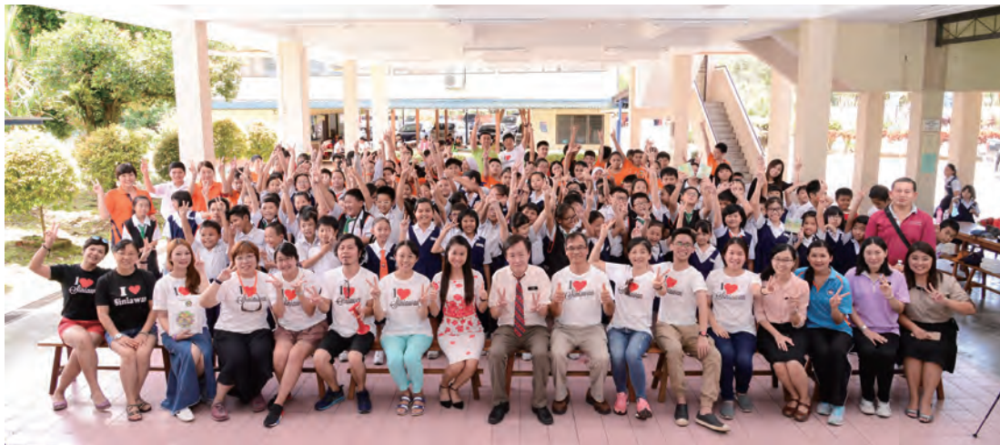
臺灣的3位客家歌手與金獅團到新堯灣中華小學，在孩子們的心中播下客家文化的種子。