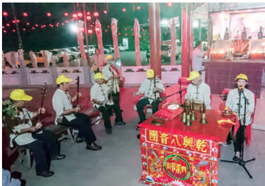
乾興客家八音團參加水月宮慈悲娘娘聖誕儀典，向阿娘敬獻五曲。

當地華人從未聽過這種客家傳統音樂的演奏，乾興客家八音團的演出，不但增添阿娘生慶典的熱鬧，也帶給新堯灣社區居民特殊體驗。而交流團也見識了當地的傳統樂音「潮州劇」，雙方的演奏交流，展現出不同的客家族群宗教音樂。