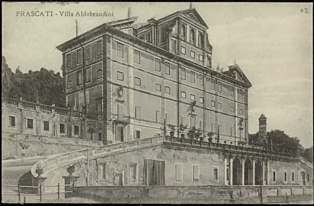
FRASCATI - Villa Aldobrandini