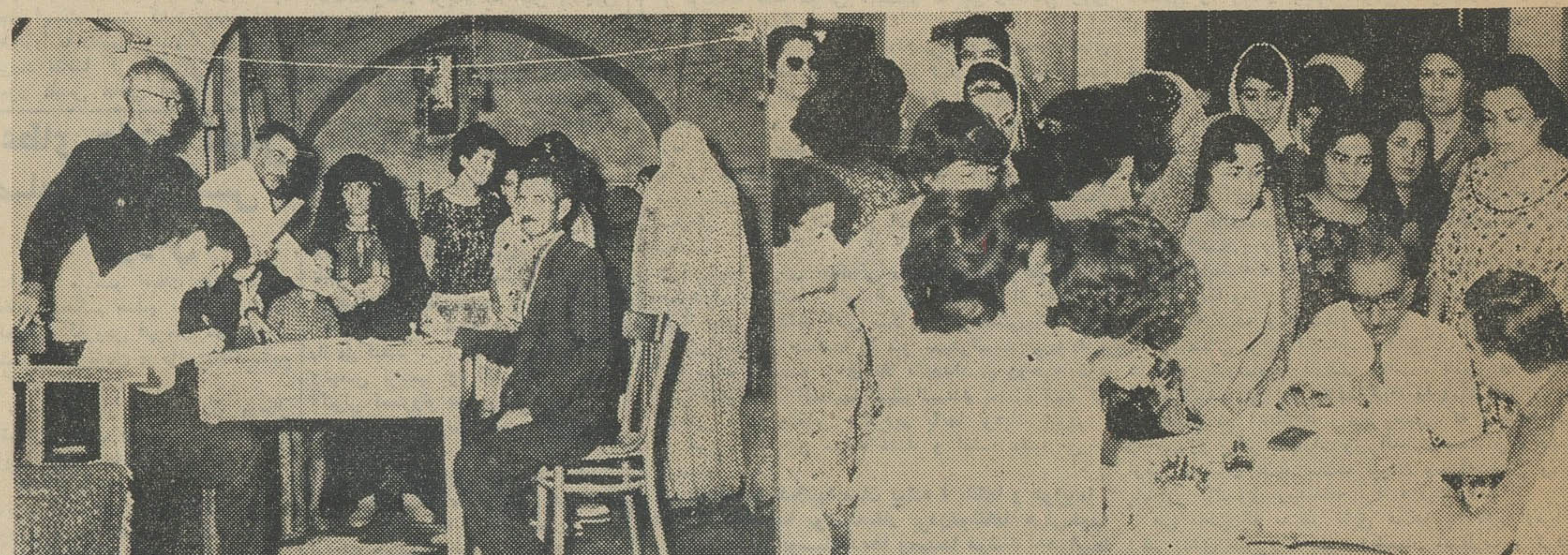
عکس بالا سمت راست بانوان اصفهانی و سمت چپ بانوان شاه آباد غرب را هنگام گرفتن کارت نشان میدهد.

شور و احساسات بانوان اصفهانی هنگام دریافت کارتهای الکتراال واقعا قابل توجه و بیسابقه بود. بانوان اصفهانی که اکثر کارت گرفته‌اند مصمم هستند این دوره افراد صالح و کارداران را بنمایند کمی مجلس شورایی ملی انتخاب نمایند.