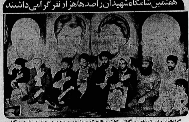
گوشه ای از مراسم شب هفت بزرگداشت ۷۳ شهیدمظلوم که در روز بدعت امام دهم در مدرسه شهید مطهری برگزار شد. در عکس میباید ختینی، ایشرفی و وزارهای (معاون وزارت کشور) دیده میشوند. در صفحه ۱۳

به تعداد شهدای فاجعه بمب گذاری شمع سرخ برافروخته شد هفتمین شامگاه شهیدان را صدها هزار نفر گرامی داشتند