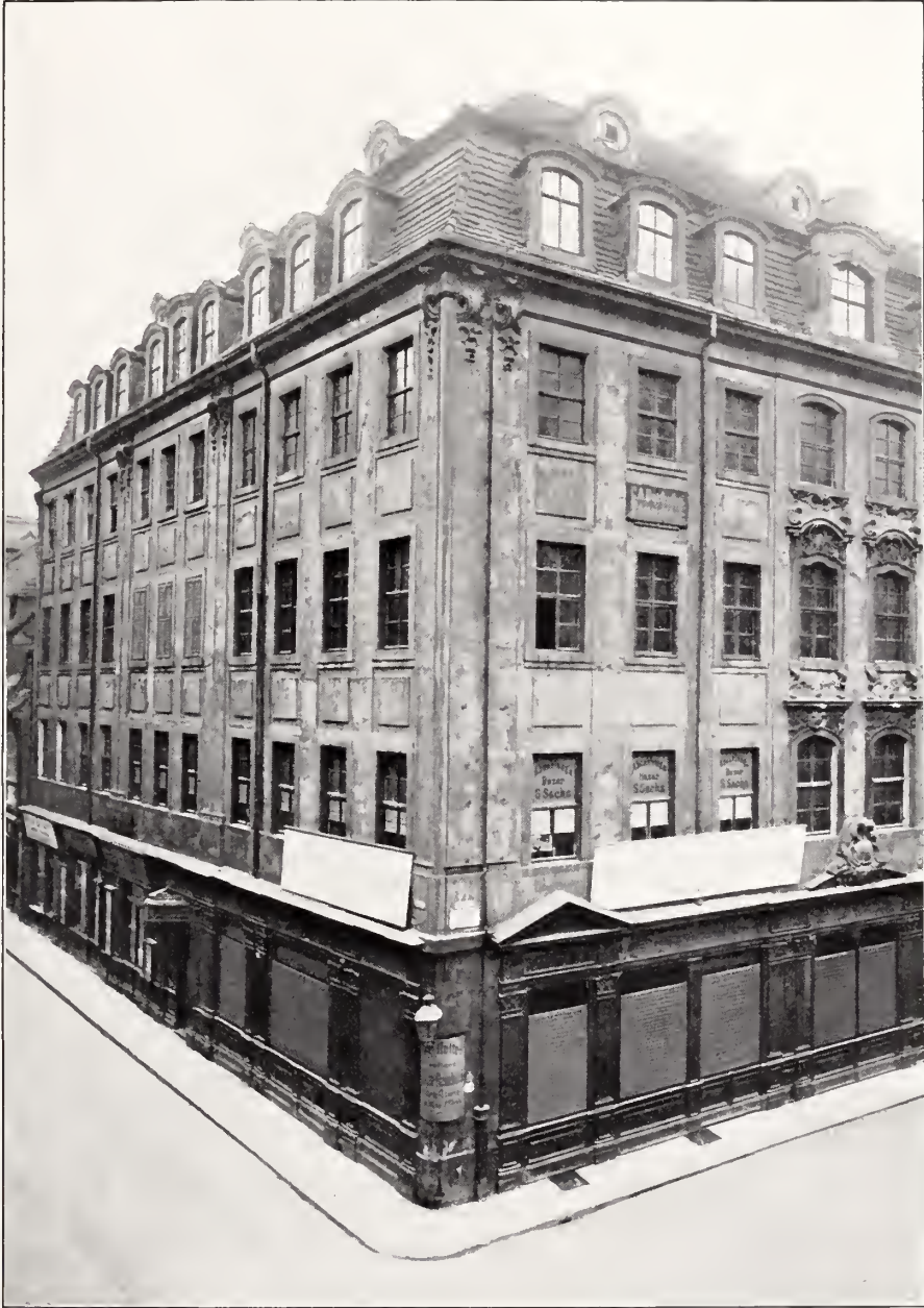
ECKHAUS UNIVERSITÄTSSTRASSE UND KUPFERGASSE; FRÜHER: ALTER NEUMARKT UND KUPFERGASSE Nr. 660