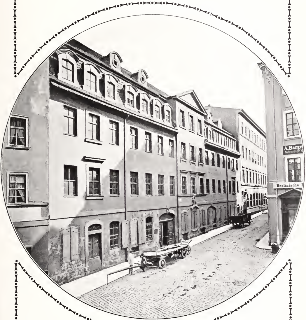
UNIVERSITÄTSSTRASSE 11; FRÜHER: ALTER NEUMARKT 674