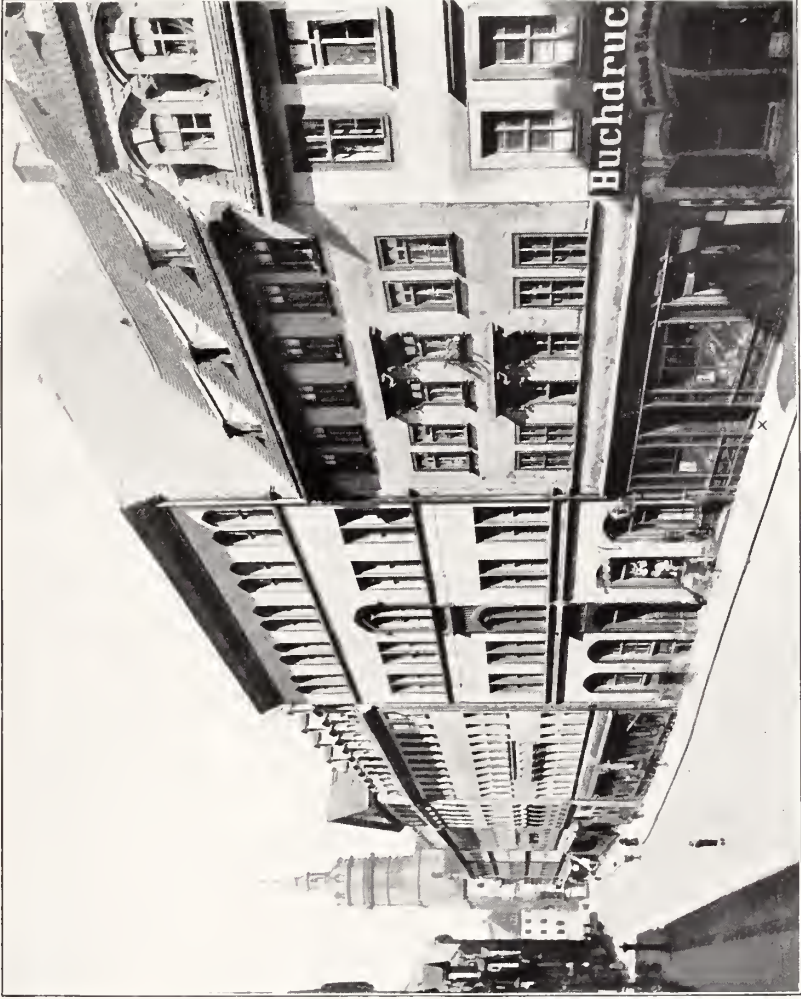
× ALTER NEUMARKT Nr. 675