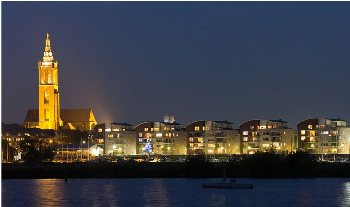
Christoffelkathedraal Roermond.

Een strakke compositie met de Christoffelkathedraal en de Maas op de voorgrond. Een mooie avondopname, die laat zien dat een historisch monument vaak gewoon tussen de hedendaagse bebouwing staat.