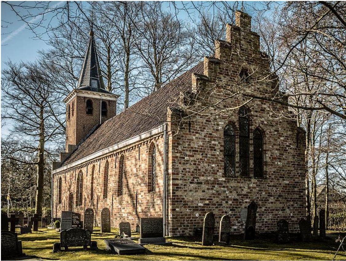
Sint-Hippolytuskerk Olterterp.

Een spannend, enigszins spookachtig beeld van de kerk in het Friese Olterterp. De jury twijfelt of de kleuren bewerkt zijn maar als dit het geval is dan heeft dit het beeld versterkt zonder storend te zijn. Mooi dat je de individuele stenen kunt zien. Dit type zeer oude kerken is kenmerkend voor de noordelijke provincies.