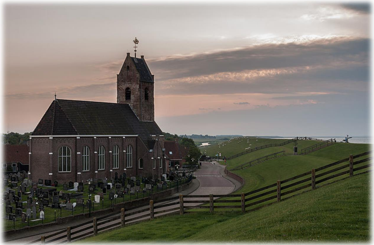
Winnaar Wiki Loves Monuments 2013: Mariakerk Wierum. Fotograaf: Uberprutser. CC BY-SA 3.0