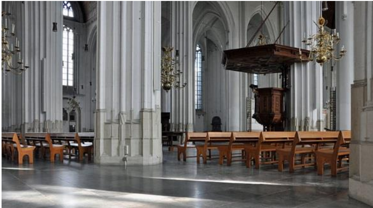
Stevenskerk Nijmegen.

Deze interieurfoto van de Stevenskerk heeft een mooi zacht licht. De compositie is weloverwogen met de verticale lijnen van de kolommen, de verdeling van de drie kroonluchters over het beeld en de plaats van de preekstoel. Het lichtspel op de vloer op de voorgrond voegt een interessant element toe. Het geheel doet denken aan de schilderijen van Saenredam.