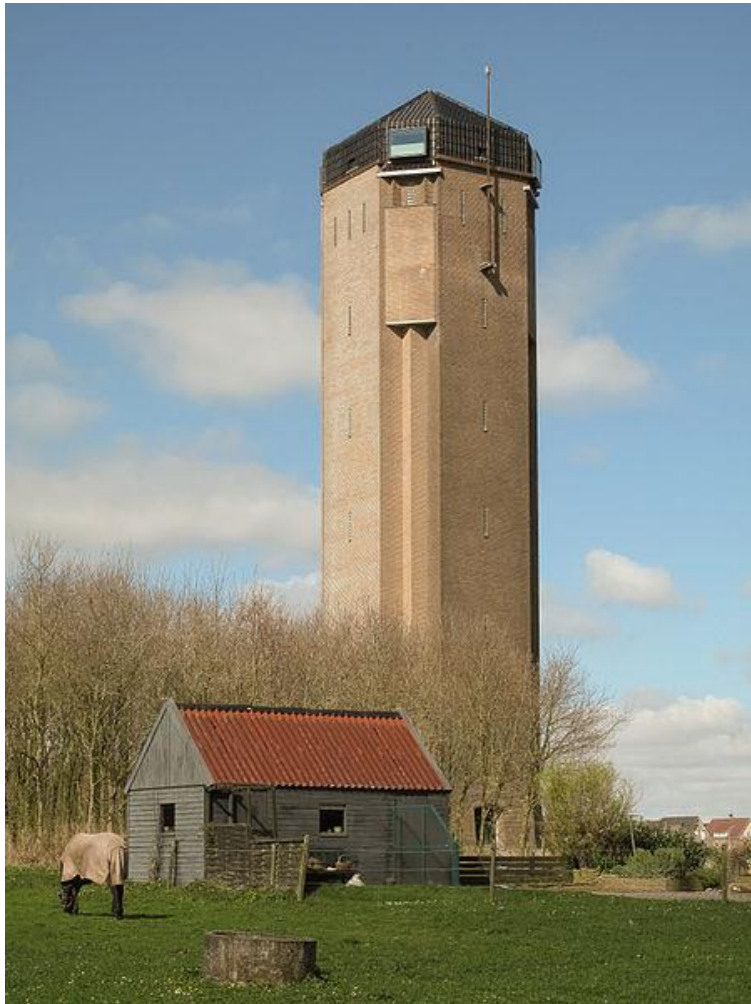
Watertoren Sint Jans klooster.

De foto van de watertoren in Sint Jans klooster uit 1931 is even strak van compositie als de toren van stijl is. De foto is mooi gelaagd (drinkbak, schuurtje, bomen, toren, dorp). Het oranje schuurdak als tegenhanger van de toren zorgt voor een harmonisch beeld, dat doet denken aan de strakke vlakverdeling en primaire kleuren van De Stijl.