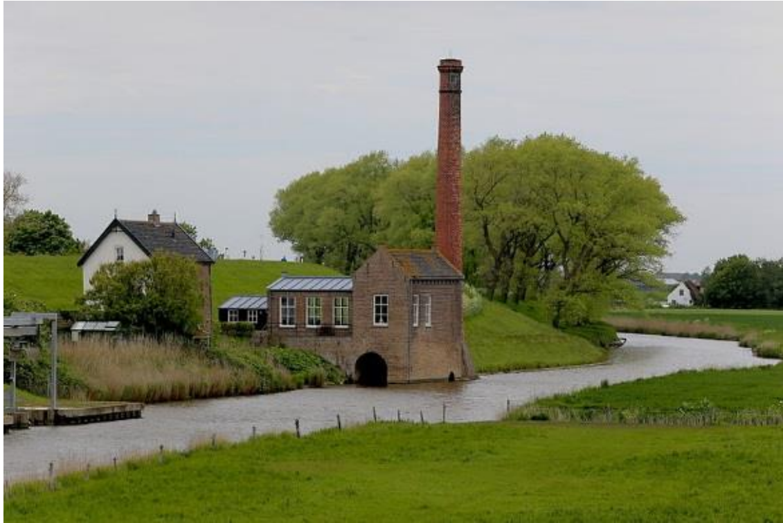
Stoomgemaal Poortvliet.

Op deze foto van het Stoomgemaal Oosterschelde zie je direct waarom een gemaal nodig is in dit waterrijke landschap. De schoorsteen is een icoon voor het stoomtijdperk. De compositie is sterk. Als je goed kijkt zie je links nog een deel van een modern gemaal.