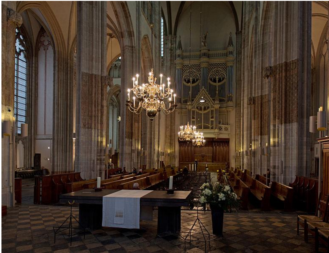
Domkerk Utrecht.

Een warme en sfeervolle foto van het interieur van de Utrechtse Domkerk. Technisch is de foto uitstekend; zo is de scherpte goed wat lastig is met deze lichtomstandigheden. De ramen en kroonluchters overstralen niet. Leuk dat er, als je goed kijkt, mensen op de foto staan.