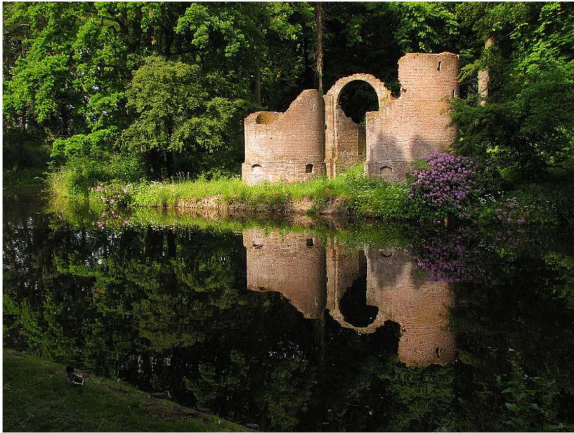
Fotograaf: Friesburg Kasteel Toutenburg Vollenhove.

De ruïne van Kasteel Toutenburg in Vollenhove levert een romantisch, sprookjesachtig beeld op. De spiegeling is prachtig. De compositie had nog wat sterker gekund.