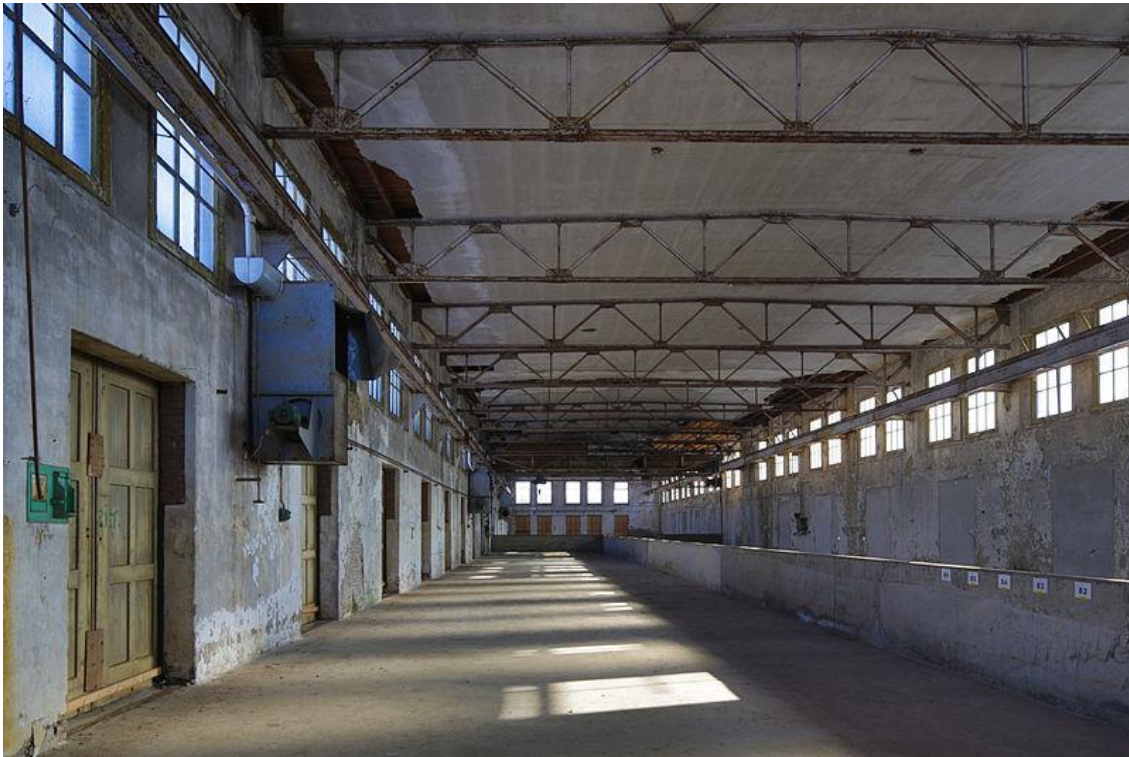
Fotograaf: Fgbcgp Enka-fabriek Ede.

Het interieur van Bitterzoutloods van de Enka-fabriek in Ede toont de schoonheid van industrieel erfgoed in verval. De compositie is strak. Het licht van de ramen speelt op de betonnen vloer.