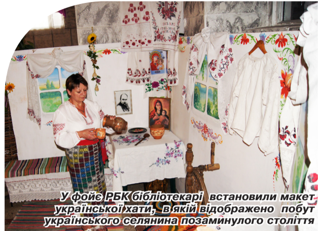
У фойє РБК бібліотекарі встановили макет української хати, в якій відображено побут українського селянина позаминулого століття