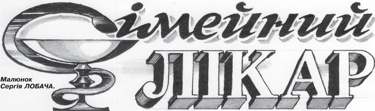
Малюнок Сергія ЛОБАЧА.