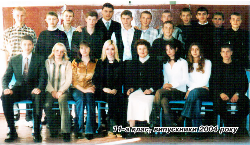
11-а клас, випускники 2004 року