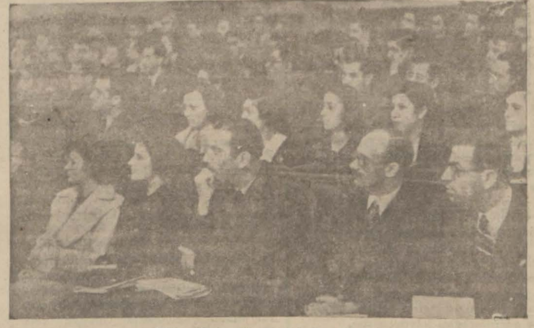
Diş tabipleri kongresinden bir görünüş.