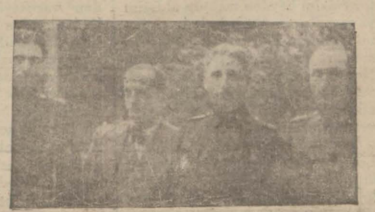
Hudut müzakeratını idare eden Türk heyeti

Türk - Bulgar hududunun tahdidine dair bazı mesaili müzakere etmek üzere şehrimize gelmiş olan Türk ve Bulgar murahhaslarından mürekkep Muhtelit komisyon mesaisine devam etmektedir. Türk ve Bulgar murahhasları arasında hususi temaslarda olmakta ve protokolün metni tesbit edilmektedir. Türk ve Bulgar murahhasları bir hafta kadar Sofyaya gidecekler ve protokolu orada imza edeceklerdir. Bulgar heyeti reisi Miralay Lukoff dün bizi Bristol otelinde kabul ederek Türkiye hakkındaki ih-