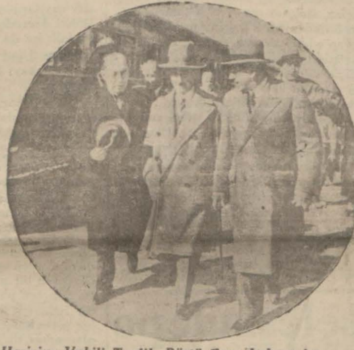
Hariciye Vekili Tevfik Rüştü Bey, Ankara istasyonunda Başvekil İsmet ve Meclis Reisi Kâzım Paşalar Hazretleri tarafından karşılanıyor.

İçtima Büyük Millet Meclisi Reisi Kâzım Pa- şa Hazretleri riyaset etmiş ve celseyi a- çarken son günlere siyasi vaziyet ve harici siyaset ehemmiyet kespetteğinden dolayı hükümetle beraber çalışmak