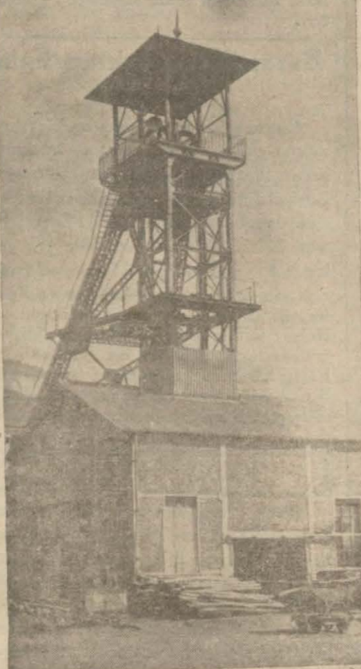
Kozluda Kömür iş asansör kulesi

Bu, çok mühim bir inkişaf ve terakki hatvesidir. Bu terakkinin kendili-