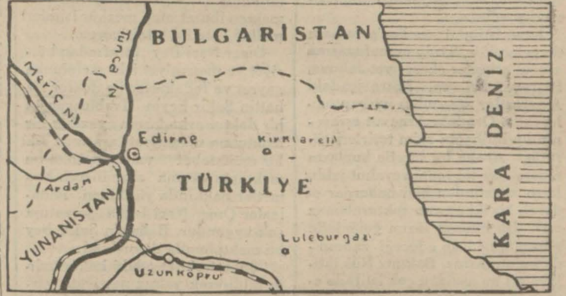
Türk - Bulgar hududunu gösteren bir harita