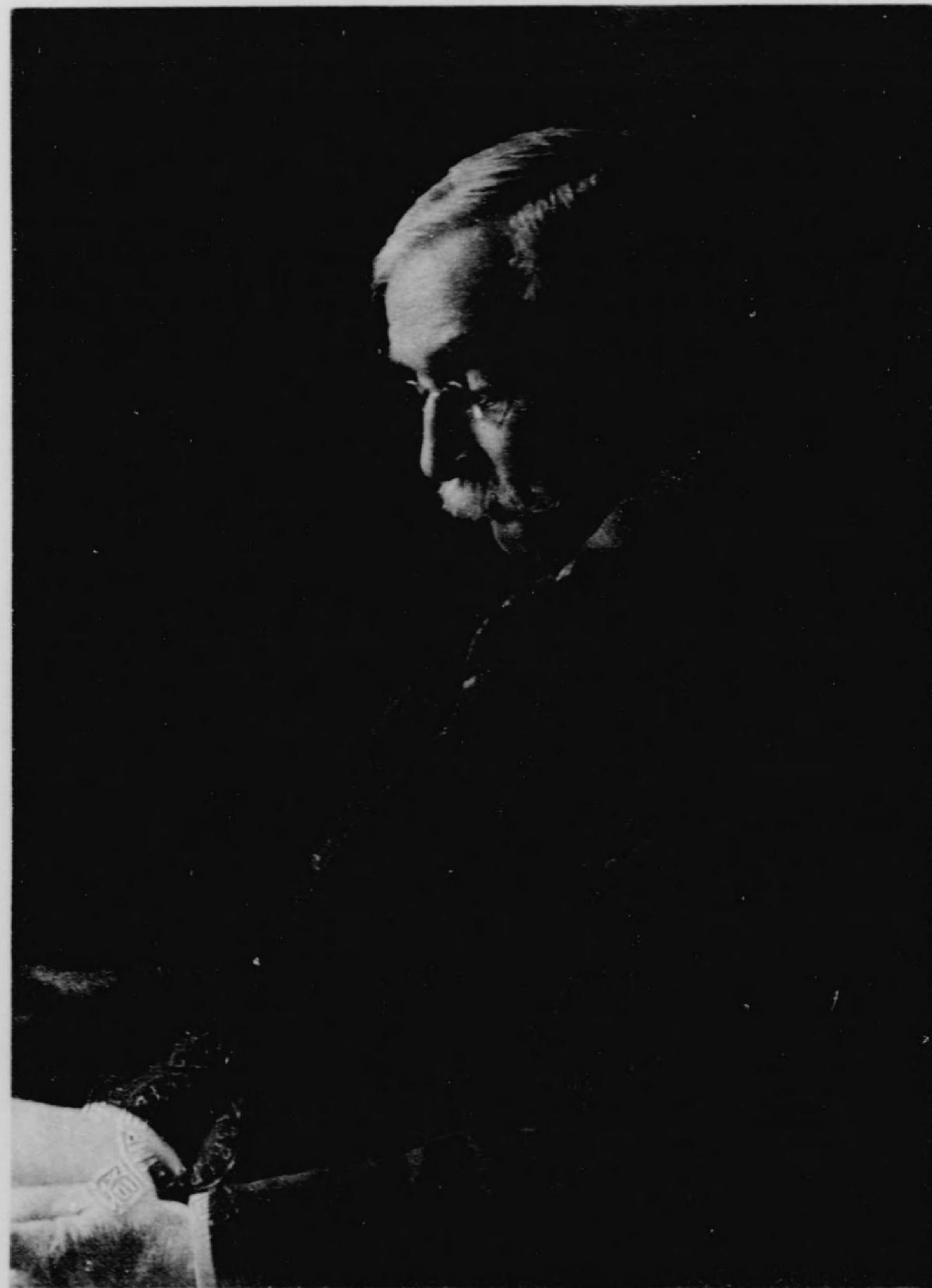
Joseph Shield Nicholson July 1912