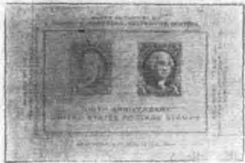
紐約集郵百年紀念展覽會票