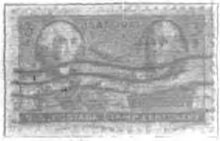
紐約集郵百年紀念票