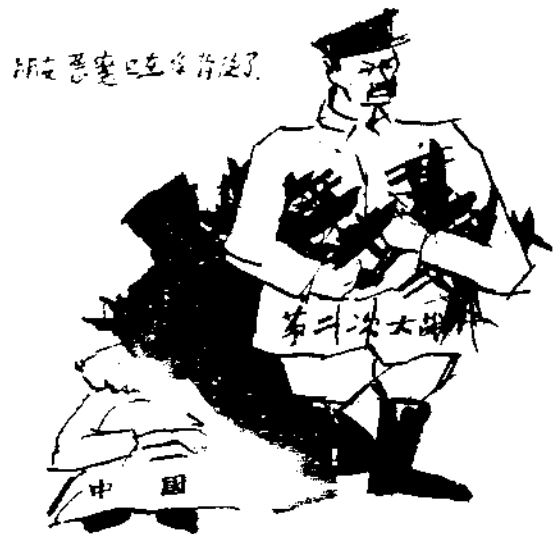
此種惡劣生活情形

工人工資與前數年比較，絕無顯著之增益，而工人生活費之指數，則較民十五年，無多大低落，且房租等項，反有增加，工人生活之不能呼應，其現象已甚明顯，至如上表七八兩月之總指數，較前上增，蓋社會生產已不能與消費者互為表裏矣。