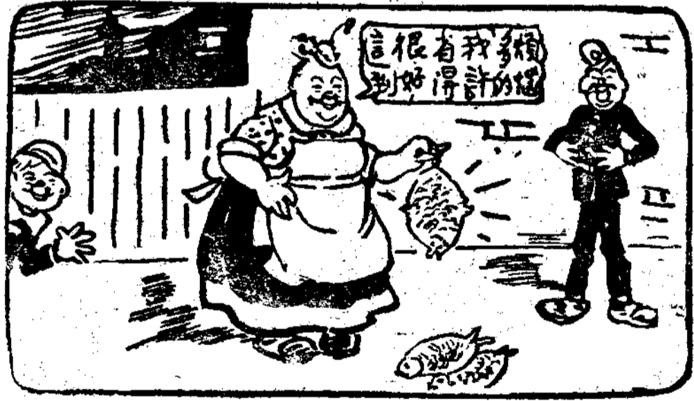
倒神個大中在蕉意，小頑有着一就拿胖 了，不姐，路皮將他孩皮一；邊走着大 • 滑留一胖當丟香故子的個剛想，魚姐