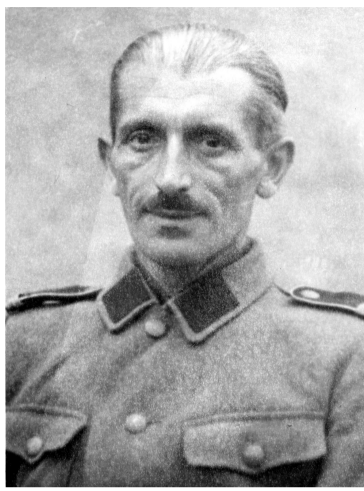
Коваль Р. Іван Ремболович: Історичний нарис. – Видання 2-ге, виправлене. Київ – Вінниця: Історичний клуб "Холодний Яр", "Державна картографічна фабрика", 2013. – С. 278. ЦДАВО України. – Ф. 3795. – Оп. 1. – Спр. 794. – Арк. 8, 11.

Роман КОВАЛЬ, Віктор МОРЕНЕЦЬ Джерела Життя ветеранських організацій. 26-й з'їзд Т-ва б. вояків Армії УНР у Франції // Дорогоказ. Орган вояцької думки і чину (Торонто). – 1969. – №24 (43). – Квітень – червень. – С. 20.