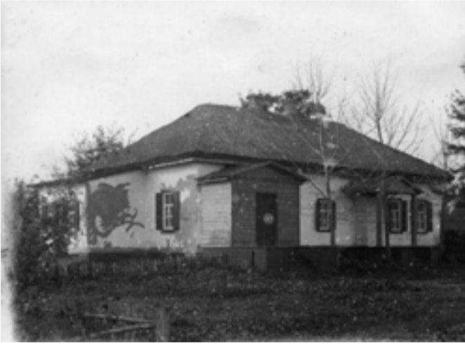
Головний будинок – вид із двору

Нині, у експозиції Гадяцького історико-краєзнавчого музею можна побачити окремі його примірники. Збереглося у місті і приміщення, де працювала редакторка. Розташовується воно по вулиці, що нині носить ім'я Михайла Драгоманова.