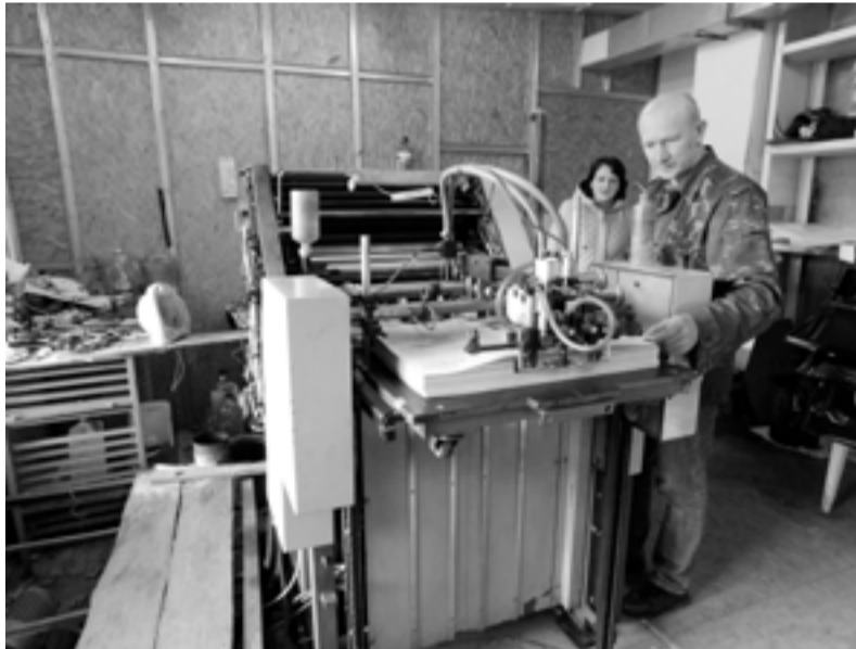
КП «Видавництво «Гадяч»»

Цитата філософа і письменника Джорджа Сантаяна: «Той, хто не пам'ятає свого минулого, приречений на його повторення»,