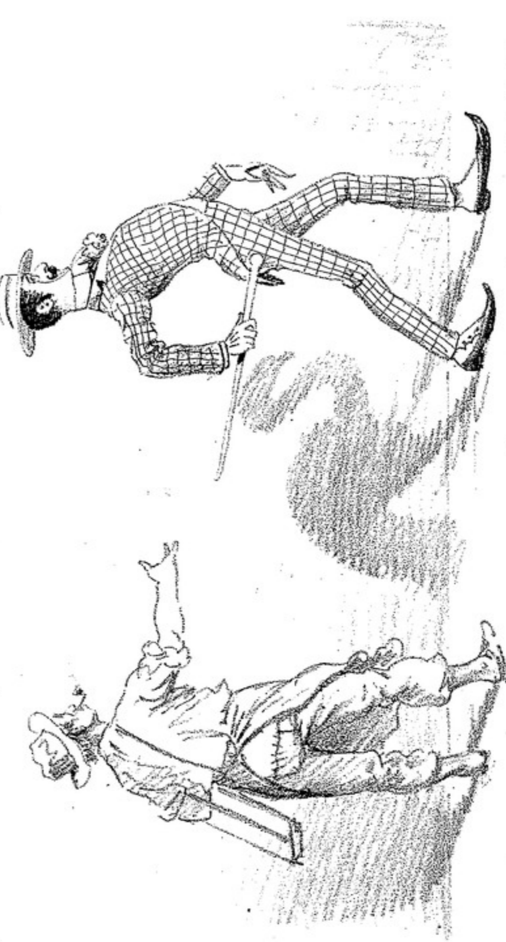
— ¡Qué hermoso es el hombre cuando tiene fortuna. Si para la praxa de la Lotería en Buenos-Aires, lo primero que haré será hacerme vestir así, si señor.