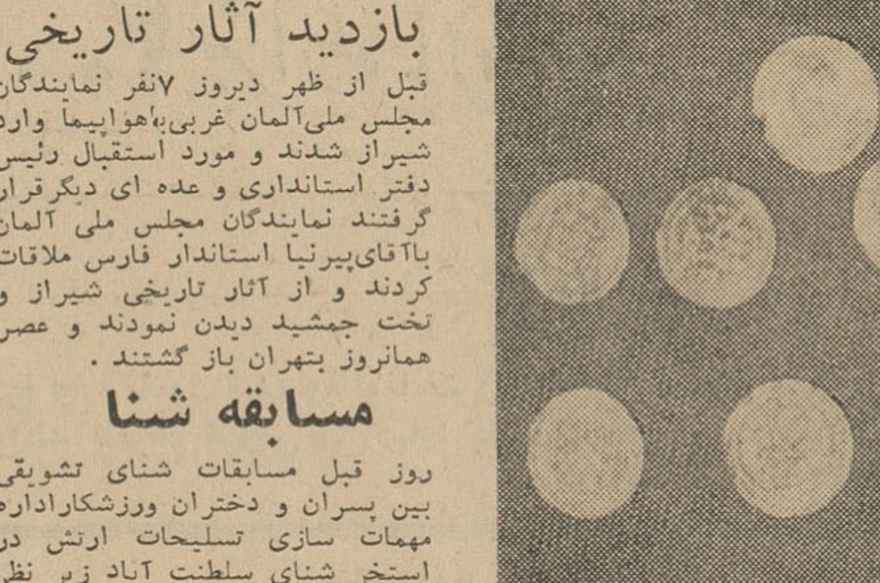
مقداری اشیاء عتیقه وسکه‌های طلا ازدوران گذشته کشف شد