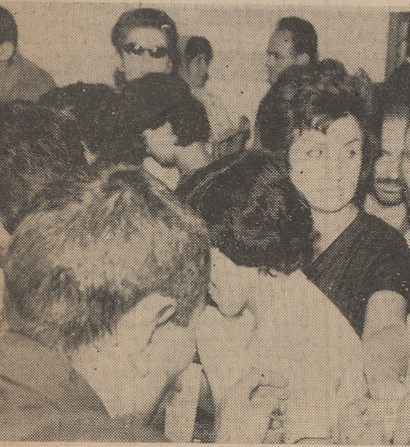
در بسیاری از حوزه‌ها مردم برای دادن رأی بیکدیگر سبقت می‌گرفتند.

● حزب توده يك حزب غیر قانونی است و نمیتواند هیچگونه فعالیت آشکار داشته باشد