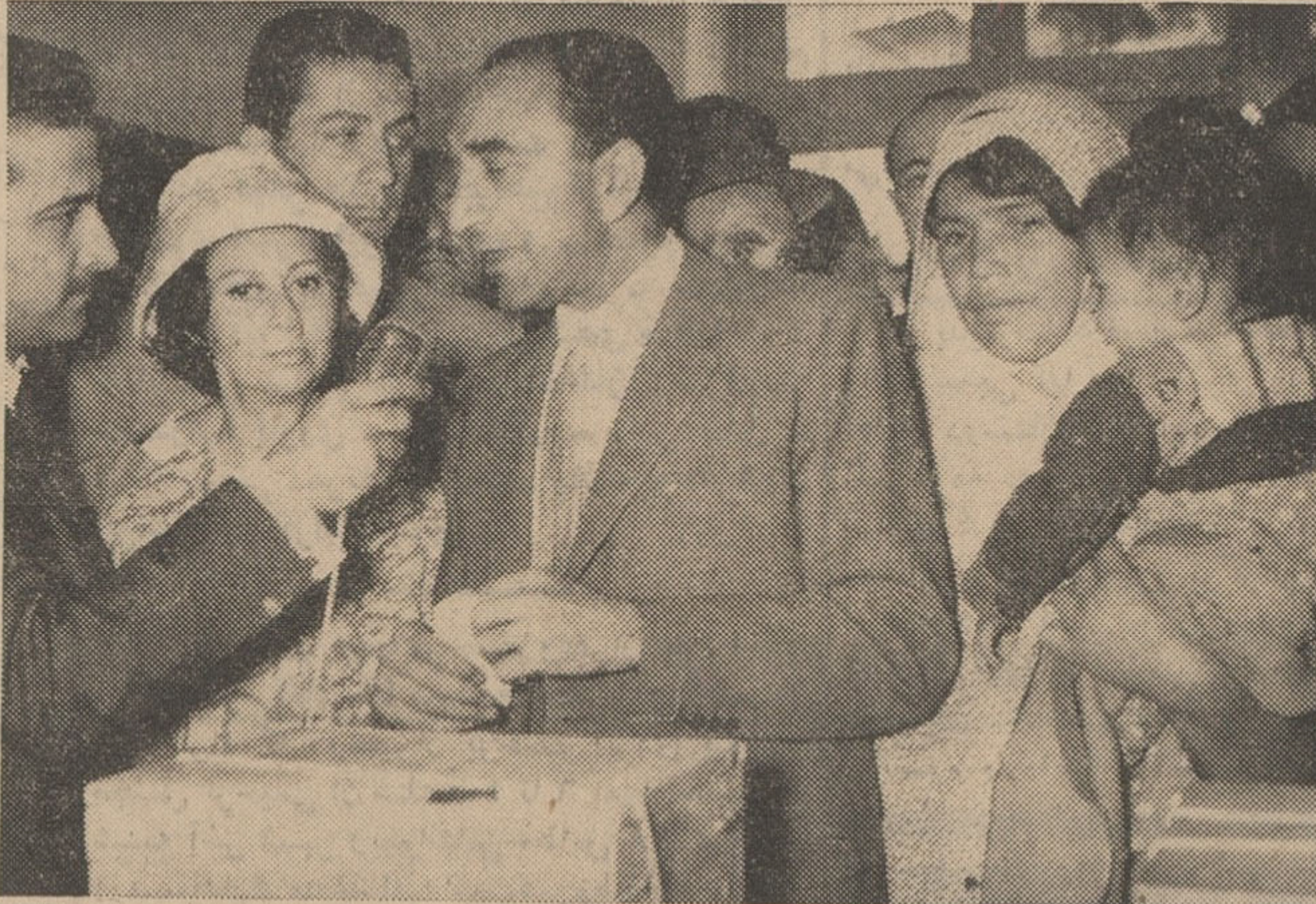
نخست وزیر و باو برای دادن رأی به حوزه دیرستان هدف مراجعه کردند. در این حوزه زنان چادری و بیجه بغل نیز برای خود را به صندوق می‌انداختند.

گفته شد که مجلسین تا روز ۱۴ مهر ماه تشکیل خواهد شد