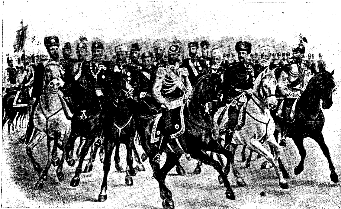
Țarul și suita lui.

Röknitz. Adineaori mi-ai declarat că ai face tot ce stă în poizibilitatea unui om, ca să schimbi esistența aceasta, și iată când îți arăt această poizibilitate, te dai laș înapoi. Nu ți-e teamă că ea se va ofili în atmosfera aceasta de dugheană, unde nu e destul de conziderată nici măcar de nevestele judecătorului și a doctorului?... Apoi dacă nu știi dta, frate dragă, stai să-ți spun eu, că soția dtale este inzestrată cu cel mai bizar amestec ce se poate afla în caractere... este și bună și mândră totodată... Bagă de seamă ce poate să se desvolte din bunătatea ei, dacă va simți zilnic înfrângeri în mân-