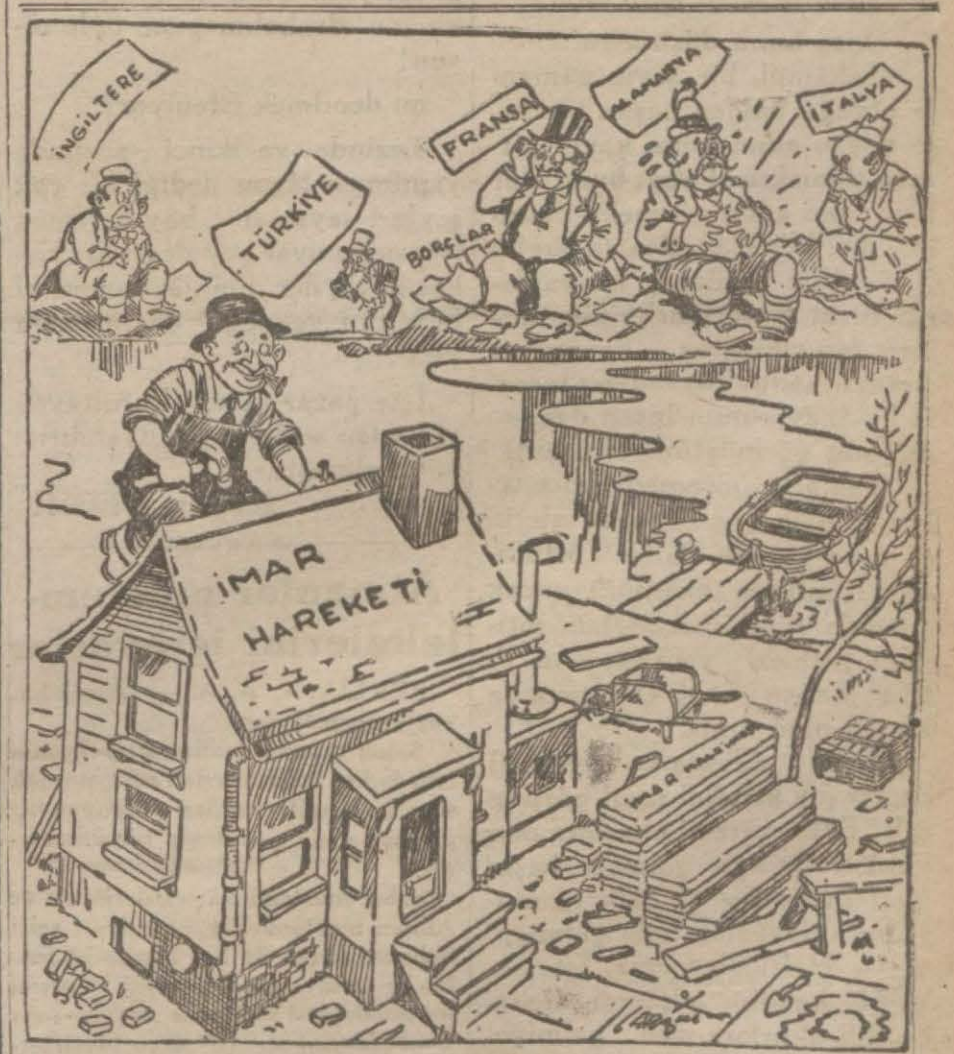
Hastalanan Avrupa imarçı Türkiyeyi gıpta ve hayrette seğrediyor: — Hey gidi dünya Hey!.. Hastalar iyi, iyiler hasta oldu.

Muhterem, nazır ayın 28 inden Ankaraya gelecek ve cumhuriyet bayramında hükümetimizin misafiri bulunacaktır.