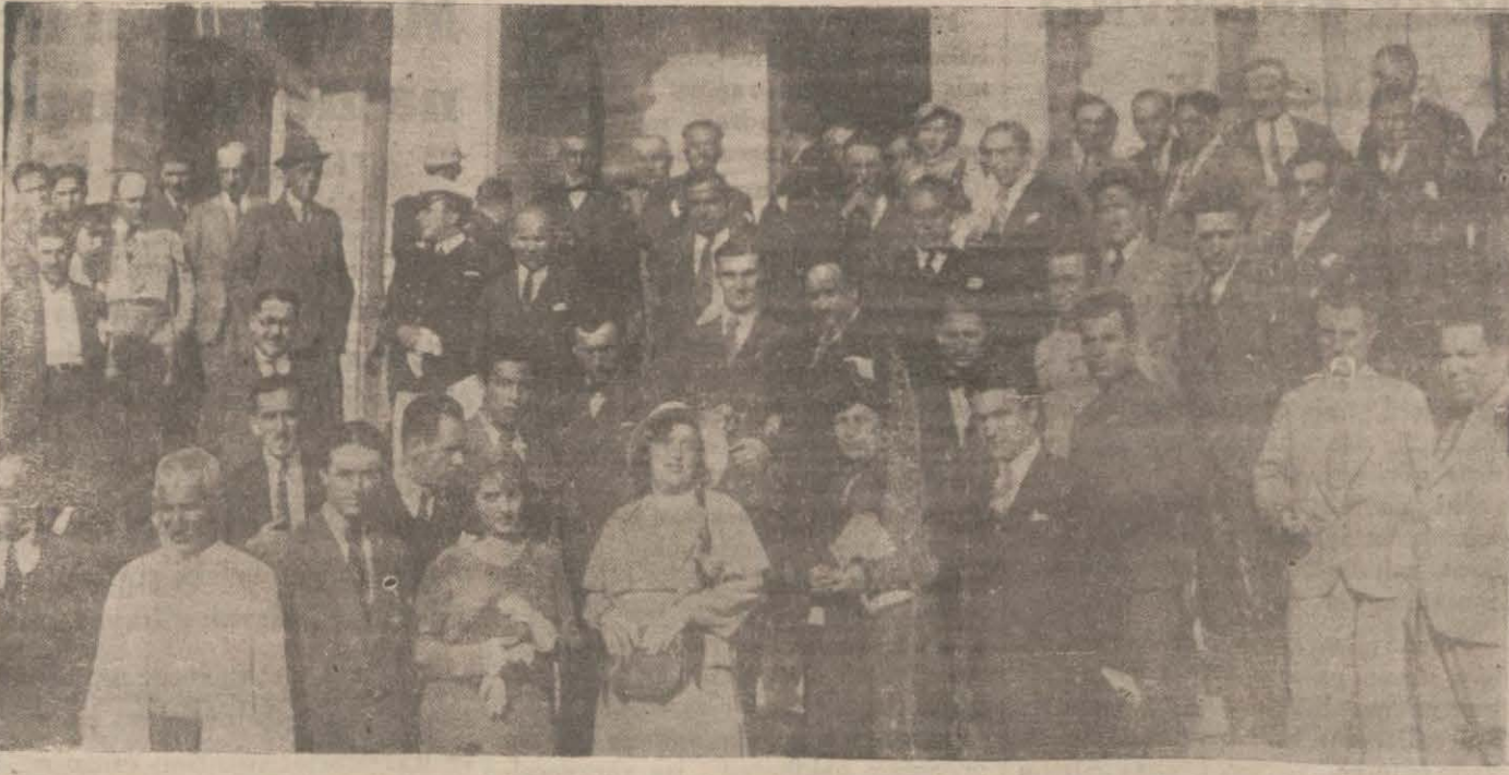
Kurultayda bir celse arasında azâ ve dinlegiciler..