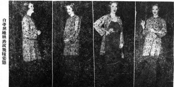
白蒂黛維絲表演幾種姿態

『總之，規則都是死的東西，最重要的還是天才。要做一位女演員你必須兩種都具有了。技巧不過是第一步罷了。』