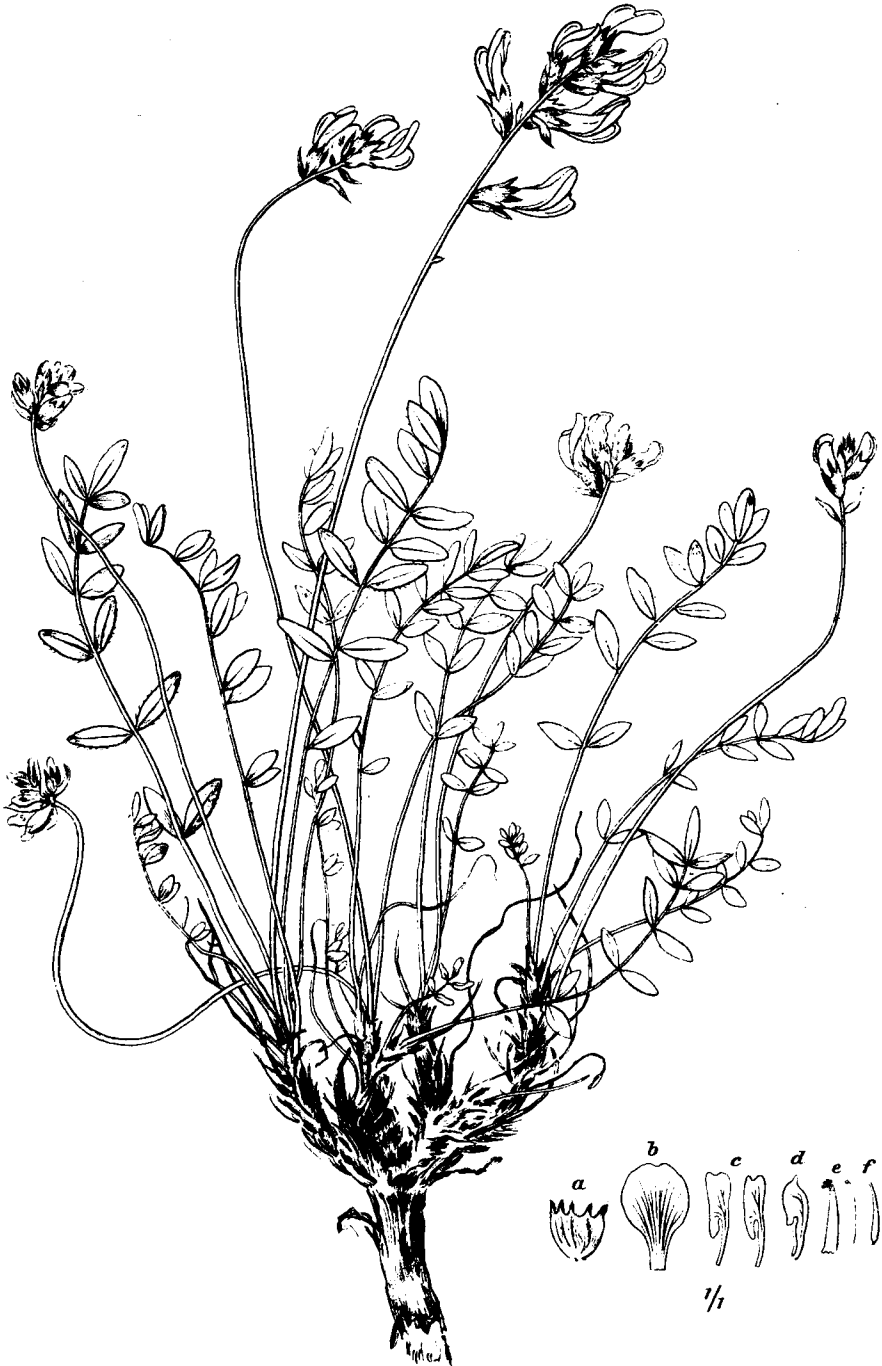
Oxytropis Ladygini sp.n.