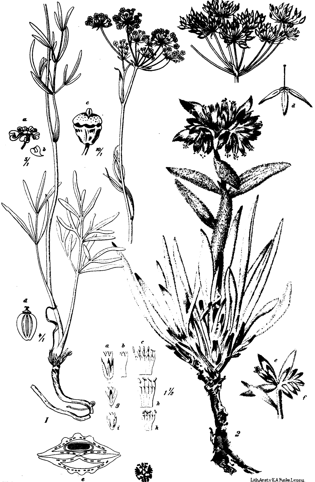
Fig.1. Peucedanum salsaugineum sp.n.