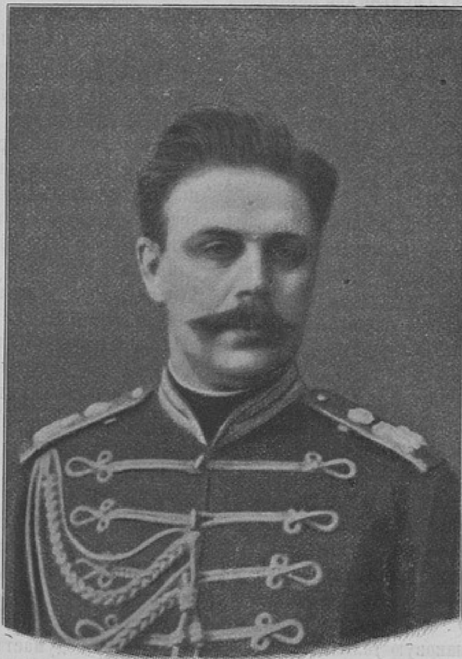
Генералъ адъютантъ Григорій Ивановичъ Чертковъ (въ 1841 г.) (къ статьѣ «Пажескій корпусъ»).

Административный механизмъ, созданный Петромъ Великимъ, оказался слишкомъ тяжелымъ и удаленнымъ отъ воздѣйствія центральной движущей силы; послѣдовавшія измѣненія, произведенныя въ этомъ механизмѣ, лишь внесли въ сферу государственнаго управленія чрезвычайную путаницу. Хаосъ, царствовавшій въ области государственныхъ дѣлъ въ первый годъ управленія Императора Александра I, требовалъ