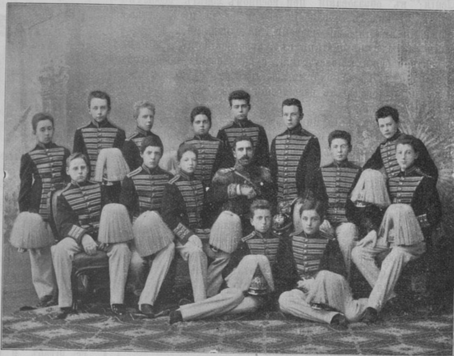
Пажи на коронаціи въ Москвѣ въ 1894 г. (къ статьѣ «Пажескій корпусъ»).

славныя традиціи, которыя минцы заслужили въ своихъ боевыхъ дѣлахъ. Надѣюсь, что другой разъ удастся мнѣ случай видѣть моихъ минцевъ. Фердинандъ.» Съ окончаніемъ чтенія телеграммы, музыка вновь заиграла національный болгарскій гимнъ, опять грянуло «ура». Въ то же время флаги, прикрывавшіе портретъ князя, упали и глазамъ всѣхъ находив-