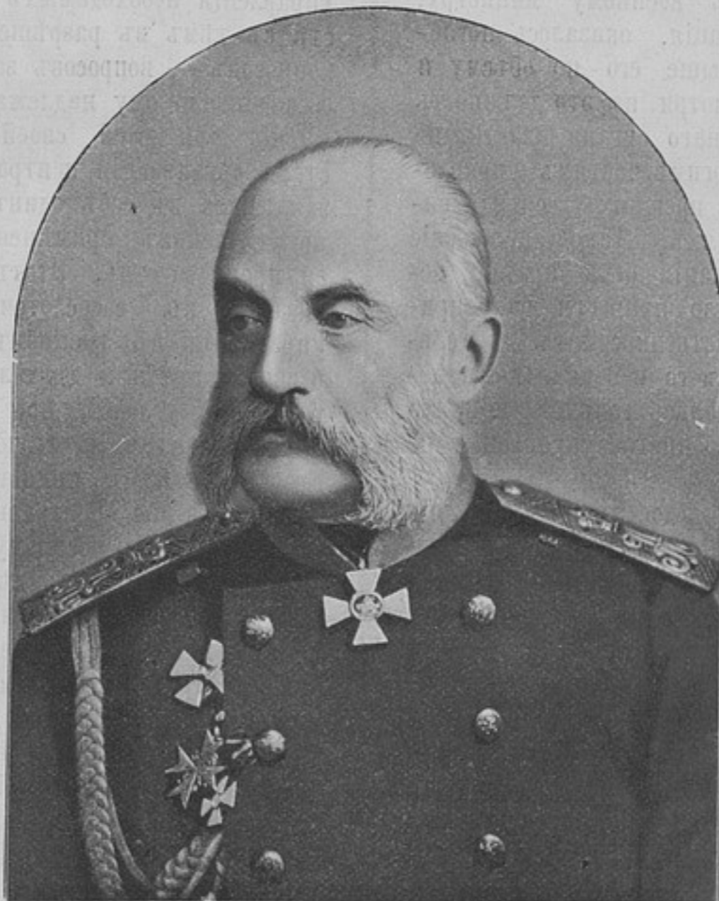
Генераль-адъютантъ Непоклойчицкій (къ статьѣ «Пажескій корпусъ»).