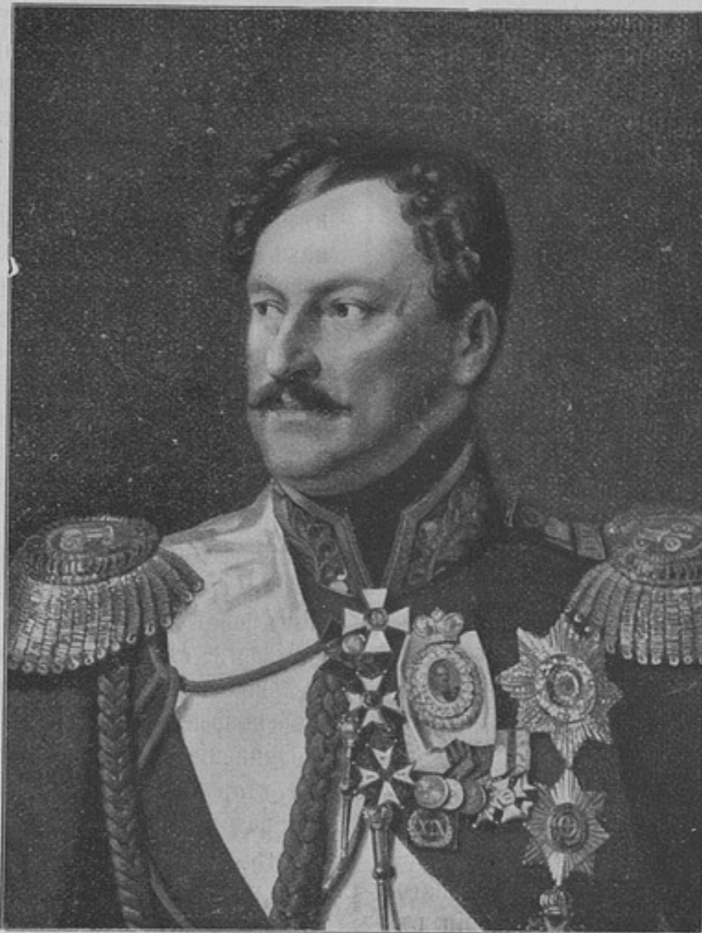
Святѣйшій Князь А. И. Чернышевъ (къ статьѣ «Пажескій корпусъ»).

при министрѣ — и учреждений особыхъ: военно-ученаго комитета, военно-топографическаго депо, вѣдавшаго частью генеральнаго штаба и картографическими работами, общаго по арміи де-