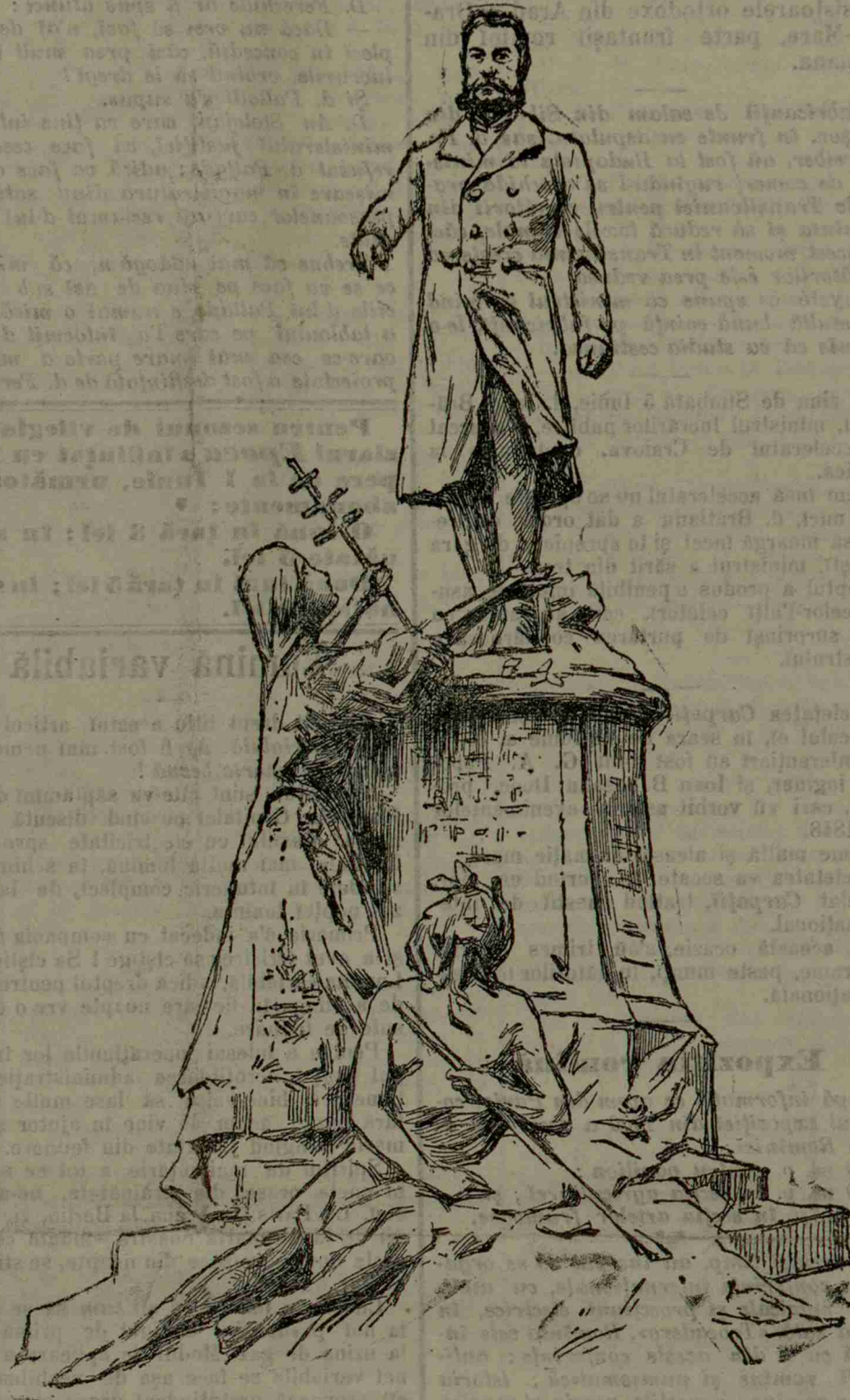
Statua lui Alexandru Lahovari