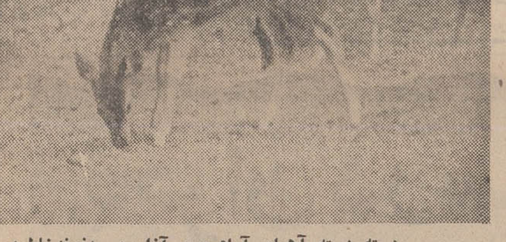
دسته آهوان آرام و بی آزار بی دندنه خاطر در باغ ریاست جمهوری اندونزی در شهر بوگور زندگی میکنند.

روزگار آن درازی بر فراز این عمارت پرچم هاند در اهتزاز بود و فرما تروایان هلندی در این ساختمان زندگی میکردند و حاکم مطلق بودند. پس از اعلام استقلال اندونزی مقر حکومت هلندیها با قلمگاه افراشته شد و سوکارنو بواسطه توفی که به مجسمه داشت گوشه و کناری باغ را با مجسمه های ساخت ایتالیا زینت داد که نمونه ای از آن در عکس بالا جلوی عمارت دیده میشود.