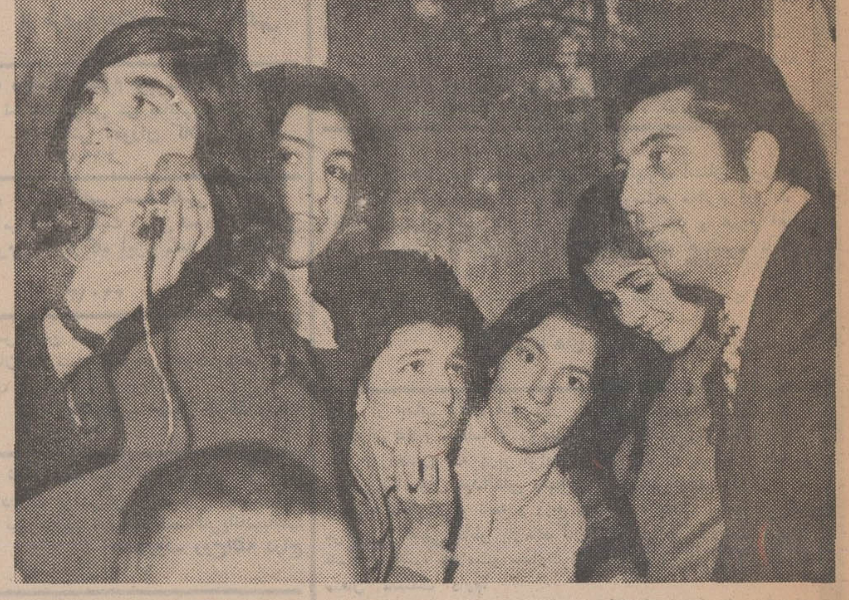
در مسابقه های دیروز جمعی از هنرمندان معروف کشور شرکت کرده بودند تا از جریان پیشرفت دانش آموزان آگاه شوند. آقای گلپایگانی خواننده مشهور یکی از این هنرمندان بود که در جلسات آواز دانش آموزان دبیرستانی بخش ۲ تهران شرکت کرده بود.

بیشتر دخترهای گفتند که پدرانشان با تمیز آواز موافقت کرده اند ولی با خواننده شدن آنها مخالفند. یکی از داوران مسابقه فن بیان میگفت: لجه از میان رفته، آهنگ صدا عالی است، حالت صحبت زیبا است و مملکت در آینده گویندگان فراوانی خواهد داشت. فعالیت یک داور خددا! در مسابقه های دبیرستانی بخش یک که در دبیرستان عاشق انجام شد گفت: تصویرکنم صحن خط از این باشد زیرا دو دختر در روز ۹ و ۱۱ و ۲۰ پسران نیز امتحان میدادند، ولی بقیه پسران دبیرستانی پس فردا مسابقه خواهند داد دختران غالباً شلواری پوشیده بودند و خانواده های آنها برای آگاه شدن از پیرویشان در محل مسابقه و اطراف سالن اجتماع کرده بودند. سابقه ها از ساعت ۸ صبح تا ۸ شب ادامه داشت باطل ناهار نیز بین شده بود. بخش یک فرهنگی ظاهراً بیش از بخش های دیگر هنرمند داشت تیمکند علقش اینست که تعداد دبیرستانی این بخش زیاد است. دیروز جمعی از مقامات آموزش و پرورش نیز از این مسابقه ها دیدن کردند.