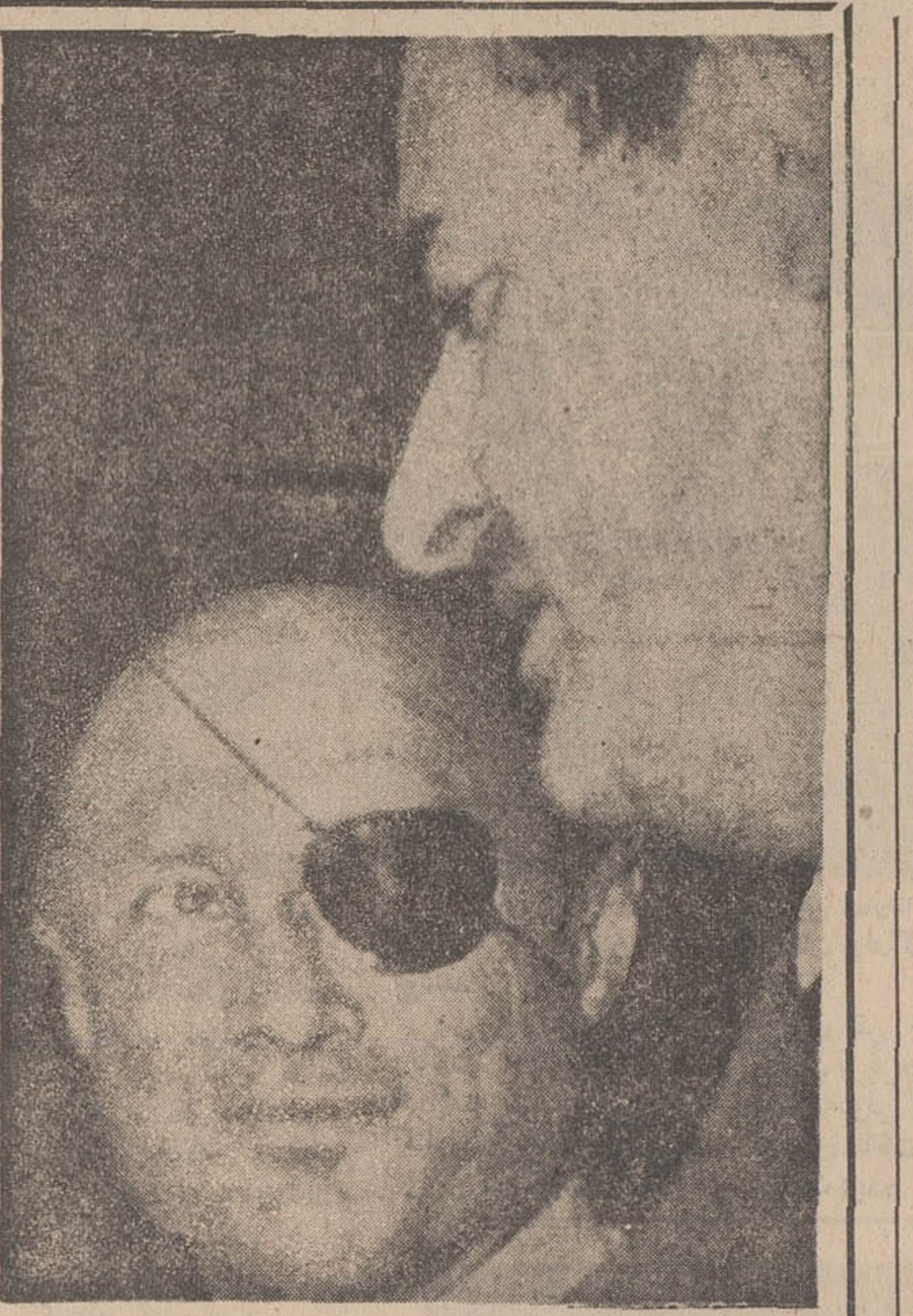
دندانمگان سرقت بزرگ در یاسالار مردخالیون، رئیس مینون خرید اسرائیل در فرانسه که بدنبال ماجرای فرارناوچه های موشک انداز بندر شروک بدرخواست دولت فرانسه ازباری فراخوانده شده بود اینکدر تل آویو برسریرد. این عکس در یاسالار یون و ژنرال دایان وانسان میدهد. ظاهر پرواز سرقت بزرگی که به آن دست زدند راضی بنظر میروند.

است تغییرات مهمی در چین کمونیست بوجود میآورد. یا آنکه عکس العمل شدیدی برای مدتی چین رادستخوش