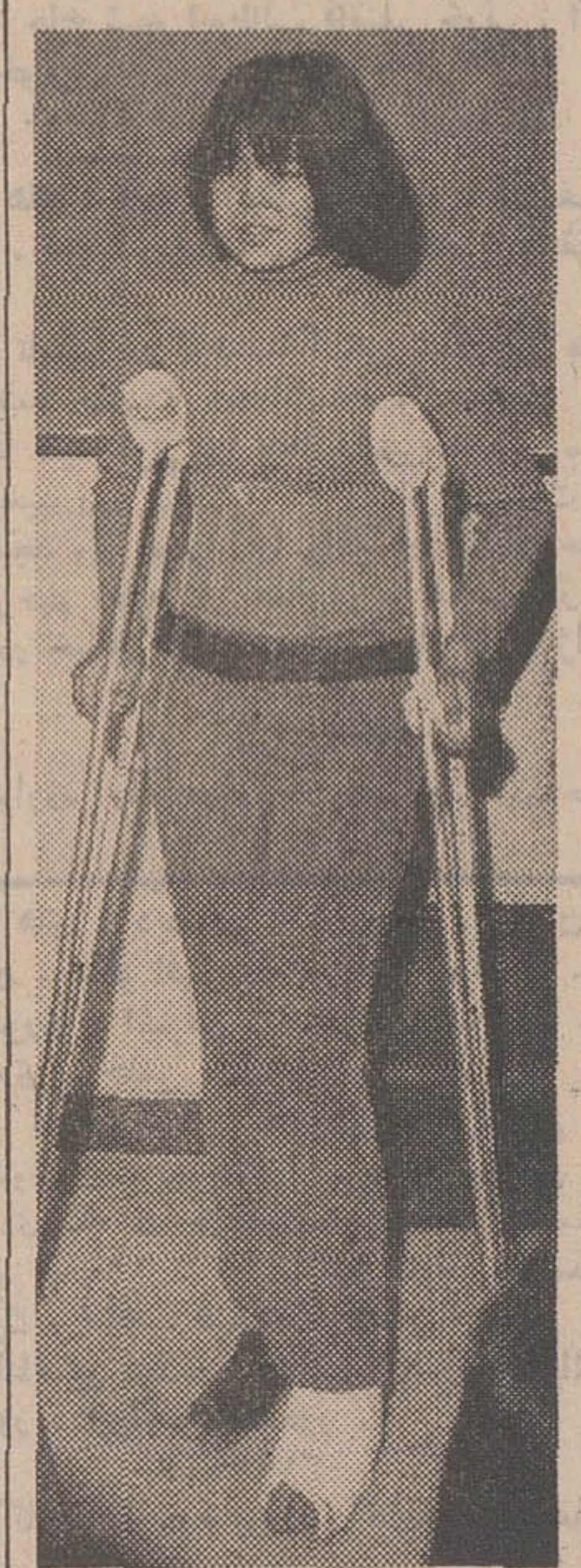
علاقه دختران دانش آموز به شرکت در مسابقات ورزشی و شان دادن هنر خود بحدی بود که یکی از آنها هفتاد و نه نفر از دختران این محله با حضور و نظارت خاصی در ورزشگاه کرج که زندگانی عادی مرا که ضامن مساعدت خواهد بود، برهم خواهد زد.

بیشتر دخترهای گفتند که پدرانشان با تمیز آواز موافقت کرده اند ولی با خواننده شدن آنها مخالفند. یکی از داوران مسابقه فن بیان میگفت: لجه از میان رفته، آهنگ صدا عالی است، حالت صحبت زیبا است و مملکت در آینده گویندگان فراوانی خواهد داشت. فعالیت یک داور خددا! در مسابقه های دبیرستانی بخش یک که در دبیرستان عاشق انجام شد گفت: تصویرکنم صحن خط از این باشد زیرا دو دختر در روز ۹ و ۱۱ و ۲۰ پسران نیز امتحان میدادند، ولی بقیه پسران دبیرستانی پس فردا مسابقه خواهند داد دختران غالباً شلواری پوشیده بودند و خانواده های آنها برای آگاه شدن از پیرویشان در محل مسابقه و اطراف سالن اجتماع کرده بودند. سابقه ها از ساعت ۸ صبح تا ۸ شب ادامه داشت باطل ناهار نیز بین شده بود. بخش یک فرهنگی ظاهراً بیش از بخش های دیگر هنرمند داشت تیمکند علقش اینست که تعداد دبیرستانی این بخش زیاد است. دیروز جمعی از مقامات آموزش و پرورش نیز از این مسابقه ها دیدن کردند.