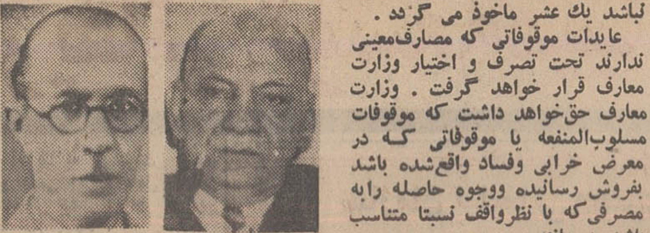
اورنگ و بهار

بناشد يك عشر ماخوذه می گردند. عایدات موقوفاتی که مصارف معینی ندارند تحت تصرف و اختیار وزارت معارف قرار خواهد گرفت.